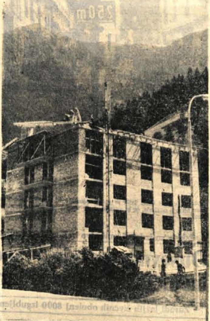
Stanovanja so v Trzinu še vedno bolj kot marsikje nadvse aktualna. V »Runo« zato še nestrpnje čakajo na dograditev novega stanovanjskega bloka

Ljudje in dogodki • Ljudje in dogodki • Ljudje in dogodki • Ljudje in dogodki • Ljudje in dogodki • Ljudje in dogodki • Ljudje in dogodki