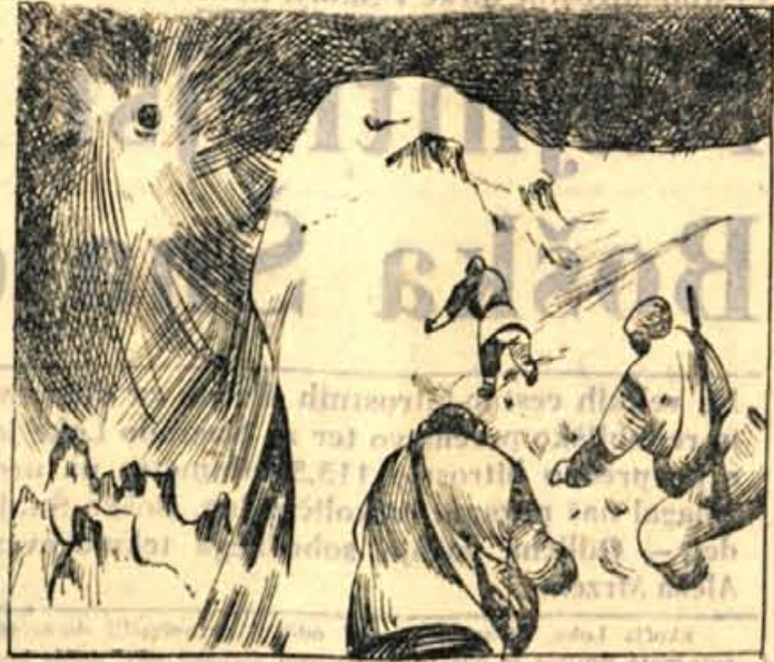
152. Ves čas jim je jemalo vid. Odmevali so streli. -Rešeni smo,- je spodbujal Kriš. -Sonce jim kvraj cilj. Krogle free sto čevljev proč od nas!- Vstali so, padali in se plazili naprej, dokler nisp dosegli vrha. Zmagala je volja.