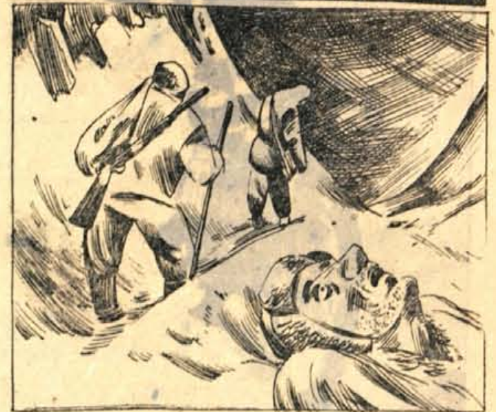
153. -Zdaj se moramo ustaviti,- je zasepetala Labiskwee, -če ne, bomo umrli.- Kar z nožem so odrezali vrvi svojih nahrbtnikov. Zavili so se v kožube in zaspali ko ubiti. McCana je napadel strahovit kašelj. Zjutraj je bil njegov neumiti obraz, okajen od mnogih ognjev, mrzel in trd ko kamen. Umril je.