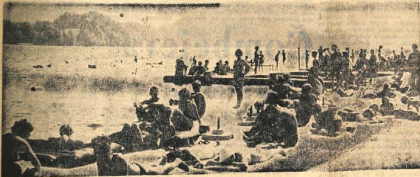
Cprav je sobotna nevihta prekinila vroče »pasje dni« se kopališča kljub temu še ne praznijo

GLASILO SOCIALISTIČNE ZVEZE DELOVNEGA LJUDSTVA ZA GORENJSKO