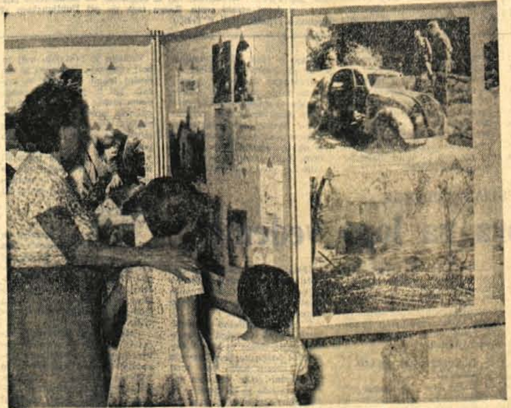
V trziškem muzeju je te dni odprta zanimiva razstava, ki jo je pripravila tamkajšnja organizacija ZB. Posebni del razstave prikazuje dokumente o ljubljenskem taborišču, ostali del razstave pa NOB na Gorenjskem v letu 1942. Razstava bo odprta do 20. avgusta

... upravni organ pri ObLO Trzin izda lahko odločbe za nove stavne parcele z največjo površino do 600 površinskih metrov. Le v izjemnih primerih, če to zahteva lega terena, lahko prosivec dobi večjo površino zemljišča od omenjene.