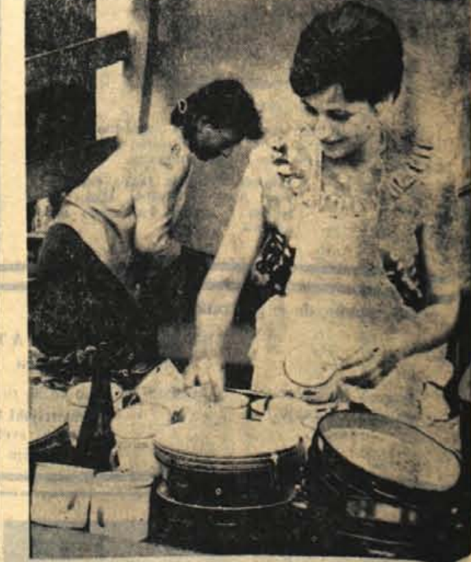
Doma so kislí obrazi kaj pogosti, ko je treba po kosilu razveljaviti rokave in pomiti posodo. V brigadi pa je zadeva drugačna. Čeprav je nad sto krožnikov, žlic, skodelic in drugega, je delo hitro opravi- ljeno, četudi so med delom žale zelo pogoste

zaključili verjetno v treh letih. Najtežja dela pa so na vrsti se- danj, ko je treba splanirati velik prostor pod Mežakljo in prav na