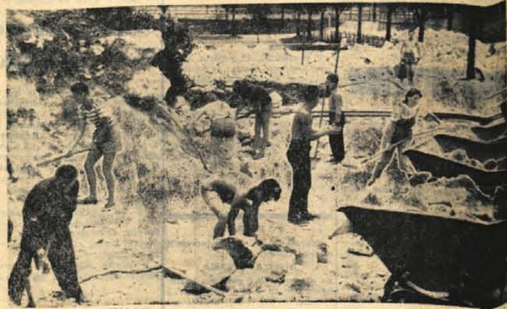
Delo je naporno. Pod Mežakljo je sama skala in kamenje