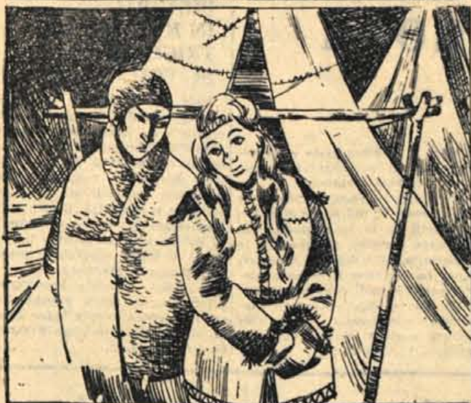
145. Labiskwee je opazila, da se na Kriševem obrazu skriva žalost. »V tvojih očeh vidim hrepenenje po svetu,« mu je rekla. »Ali šel si nazaj v svet?« Sele zdaj je spoznal, kako mu je draga Joy. Povedal si mi, kaj je ljubezen,« mu je rekla. Pomagala ti bom sbežati nazaj v svet. To naj bo preizkušnja moje ljubezni!