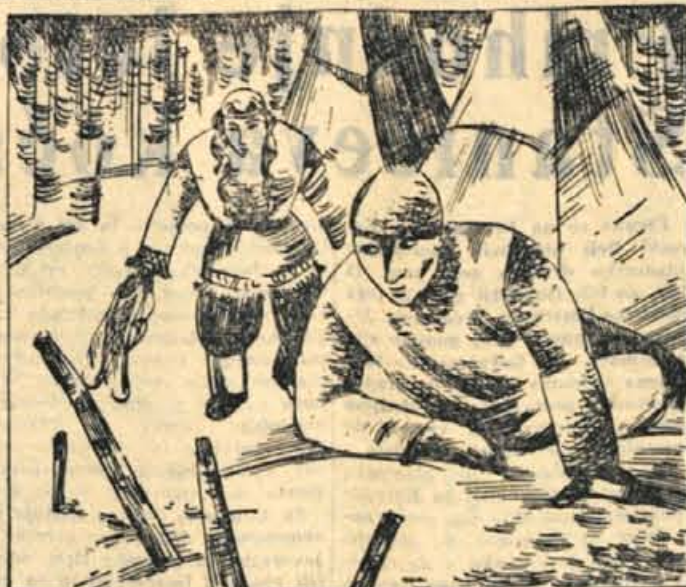
146. Ponoči je Labiskwee potegnila Kriša za rokav: »Pojdi!« Vstal je in previdno poslušal. Pobral je mokasine in se odpravil. Dekle je preskrbelo krpice, puško, moko, vžigalice in celo smuč. »Tukaj med drevjem je skrito,« je pokazala z roko. Ko sta zakurila, se je priplazil že McCan, ki ju je stalno opazoval.