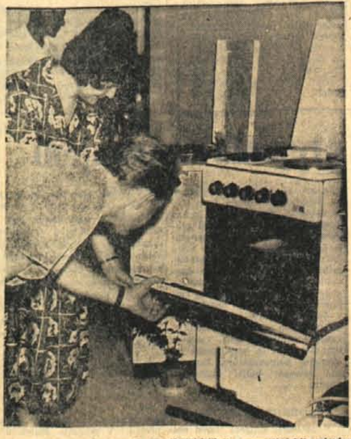
Velika izbira štedilnikov in drugih električnih gospodinjstev strojev je na sejmu zelo dobrodošla