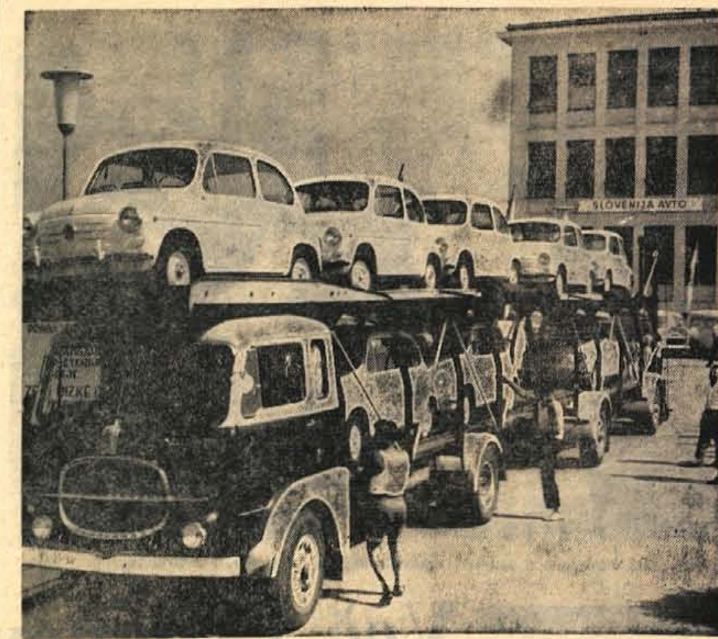
Kranj, 14. avgusta - Danes zjutraj so nekateri že s poirtostjo ugotavljali, da letošnji Gorenjski sejem ne bo več prinesel presenečenj, ker se bodo sejemska vrata zvečer zaprla. Toda sredi dopoldneva se je marsikomu spet poživil krvni obtok, ko sta pred razstavišče II privozila dva specialna kamiona za prevoz osebnih avtomobilov. Iz Kragujevca, od koder sta krenila v ponedeljek zjutraj, sta na svojem enonadstropnem ogrođju pripeljala 18 «fičkov», torej vsak devet. Številni gledavci, ki so opazovali ta nevsakdanji tovor, so bili zlasti navdušeni nad tem, kako hitro so raztovorili kamiona. Ni minilo namreč petnajst minut in prvi kamion je že stal prazen, devet «fičkov» pa je dobilo pred tekstilno šolo bolj stabilna tla

Glede na ugotovljeno problematiko oziroma stanje in ob upoštevanju novega zakona o gozdovih je občinski ljudski odbor Kranj konkretno ukrepal in s tem v zvezi sprejel predlog o razdelitvi pristojnosti gospodarjenja z gozdovi in sklepe za prihodnje gospodarjenje. Tako bo odslej gospodarilo z gozdovi državljanke lastnine Gozdno gospodarstvo Kranj in