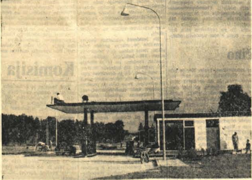
Nova bencinska črpalka »PETROL« v Radovljici, ki je veljala »okoli 30 milijonov, je dograjena. Danes jo prezmajo od graditeljev, jutri, pojutrišnjem pa bodo stekli tam že prvi litri raznovrstnega goriva v prazne rezervoarje avtomobilov, motorjev... Mimogrede naj še omenimo, da nameravajo postaviti, če bodo sredstva dopuščala, enako n drugi strani ceste. Razen tega pa pri ljubljanskem »Petrolu« razmišljajo, da bi zgradili bencinsko črpalko tudi v Trzinu.

novi bencinski črpalka »PETROL« v Radovljici, ki je veljala »okoli 30 milijonov, je dograjena. Danes jo prezmajo od graditeljev, jutri, pojutrišnjem pa bodo stekli tam že prvi litri raznovrstnega goriva v prazne rezervoarje avtomobilov, motorjev... Mimogrede naj še omenimo, da nameravajo postaviti, če bodo sredstva dopuščala, enako n drugi strani ceste. Razen tega pa pri ljubljanskem »Petrolu« razmišljajo, da bi zgradili bencinsko črpalko tudi v Trzinu.