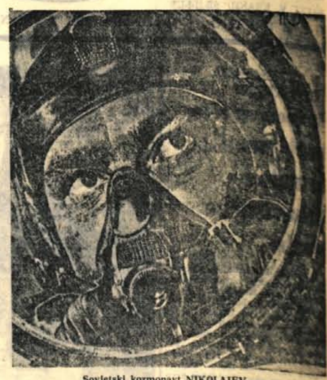
Sovjetski kozmonavt NIKOLAJEV

da na področju raketne tehnike in vesmirskega raziskav še vedno zaostajajo. Če sta imela tretji in četrti sovjetski vesoljski potnik normalen krvni pritisk in telesno vročino, je za večino Američanov značilna omedlevica in pomanjkanje teka. Po sovjetskem presledku v izstreljevanju vesoljskih ladij so Američani namreč na lihem upali, da so jih v tem razdobju naposled ulovili. Ameriška pričakovanja so bila čez okvir realnosti. Na politične odnose bodo vesoljske ladje vplivale v tej smeri, da bodo ameriški znanstveniki v eni sapi dobili več denarja in še bolj mrzlično in nervozno nadaljevali svoj tek za petami sovjetskih vesoljskih poskusov. Vesoljska perspektiva bi bila povsem drugačna, če vsake tri mesece največji državi na svetu ne bi obnavljali jedrskih poskusov. Obnavljajo jih z izgovorom: če boš ti, bom še jaz. Na zemlje-