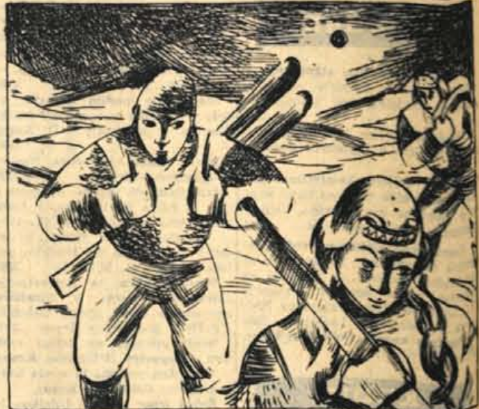
147. Samo dve poti sta jim bili na razpolago: proti zahodu proti jugu. »Hitro moramo na prelaz, da nas ne bodo prehiteli,« je spodbujal Kriš. Ob eni uri popoldne se je ledena skorja že toliko raztalila, da so se smuč začele vdirati. Se pred drugo se je začela vdirati tudi pod krpjami.