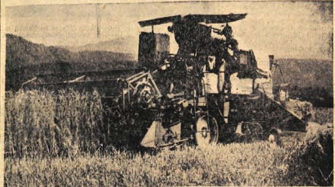
Lepo poletno vreme je - kar zadeva žetev - našim poljedelcem zelo naklonjeno. Pred nekaj dnevi smo na polju pri Velesovem opazili kombajn KZ. Cerklje, ki je žet pšenico. Ob tej priložnosti so nam v upravi zadrage povedali, da je letošnji pridelek okrog 22 metrskih stotov na hektar, le visokorod- ne sorte žit se bodo povzpele na 25 metrskih stotov

Jutri, 14. avgusta, se bodo spet sestali odborniki obeh zborov ob- činskega ljudskega odbora Tržič. Oba zbora bosta zasedala ločeno in skupno, prav gotovo pa bo naj- živejša razprava na skupnem zasedanju, ko bodo odborniki raz- pravljali in sklepali o izvršitvi proračuna in skladov za prvo pol- letje 1962.