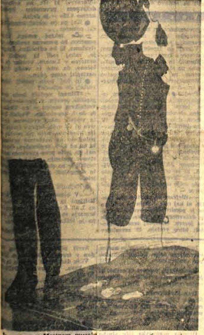
iz razstave v Mestnem muzeju

»Kar mislim si. Jaz pa bi te tako klical. Tvoje materino znamenje je podobno rozini.«