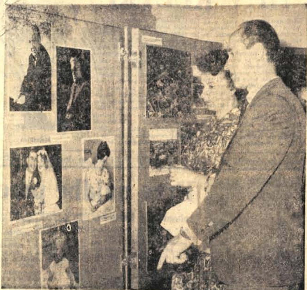
Obiskovavci Gorenjskega sejma se zelo zanimajo za razstavo mesta Oldham