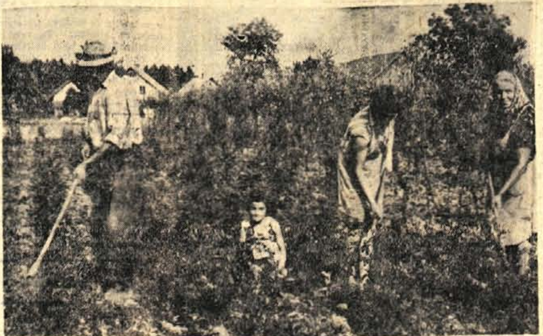
Drevesnic, (v Formah pri Skofji Loki), kot je tale na sliki, je v okolici Skofje Loke še petnajst, sicer pa daleč naokrog nobene več. Pravijo, da tradicija teh drevesnic z več kot 10.000 sadikami sega stolletje nazaj in da so nekdanj v njih gojili tudi po 30.000 sadik. Dela z drevesci pa je toliko (gojenje semen, presajevanje, škropljenje, okopavanje), da ta dejavnost pri kmetih počasi neuhje, saj je za služka z 200 dinarji za negovano drevesce, ki je naprodaj šele s privolitvijo posebne komisije, res premalo

vodov dražje surovine, ker pač ni izbire. Tak način dela znižuje konkurenčnost podjetja na zunanjem tržišču. Kljub vsem tem problemom pa je tovarna Sava na zunanjem tržišču še vedno uspešna, in to predvsem zaradi odlične kvalitete svojih izdelkov. Prav tako podjetje tudi računa, da bo v perspektivi izvoz nekajkrat povečalo. — P.