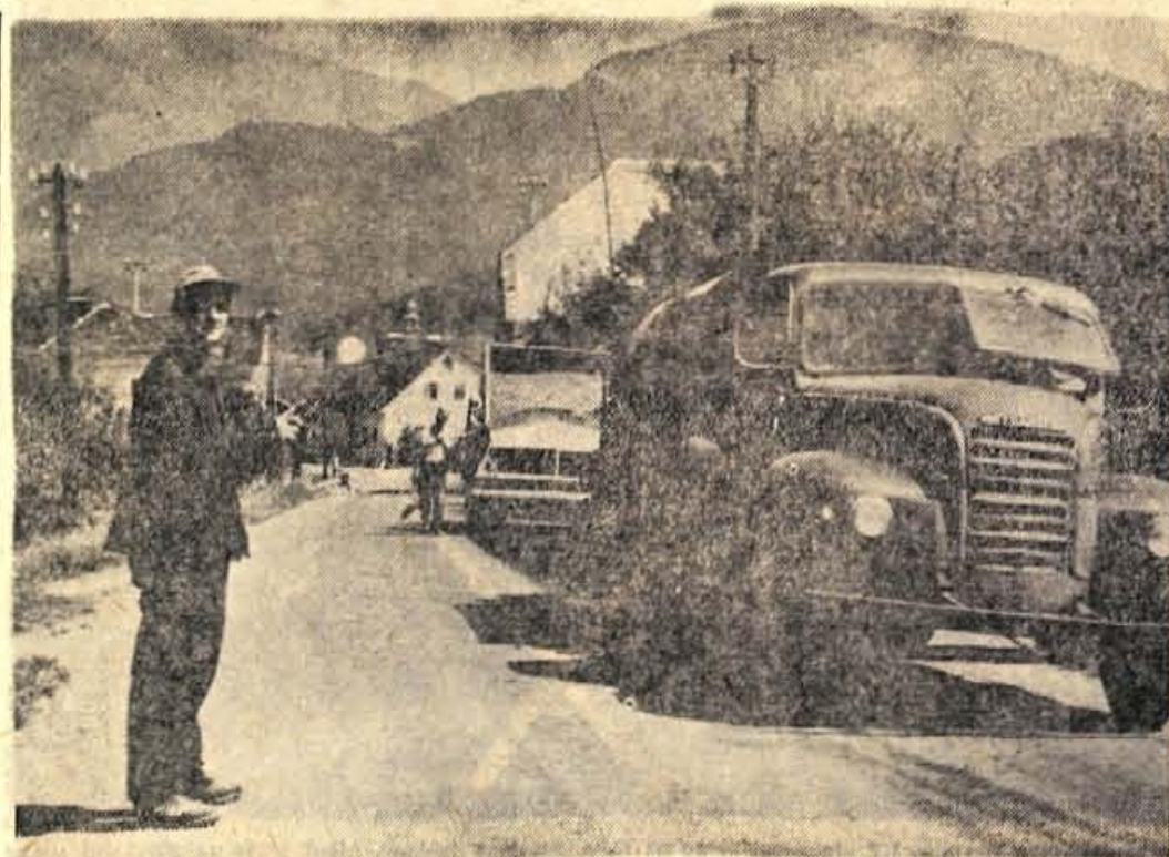
Polaganje asfaltne površinske prevleke v Tupalčah pri Preddvoru

Organi delavskega samoupravljanja v naših delovnih kolektivih naj bi temeljiteje preučevali gibanje proizvodnje in realizacije. Hkrati naj bi sprejeli tudi ustrezne konkretne ukrepe, kaj bodo storili za izboljšanje položaja, ker samo ugotavljanje težav ne bo prineslo uspehov. Pri tem naj bi samoupravni organi odločno težili, da bodo osebni dohodki naraščali v skladu s proizvodnjo. — P.