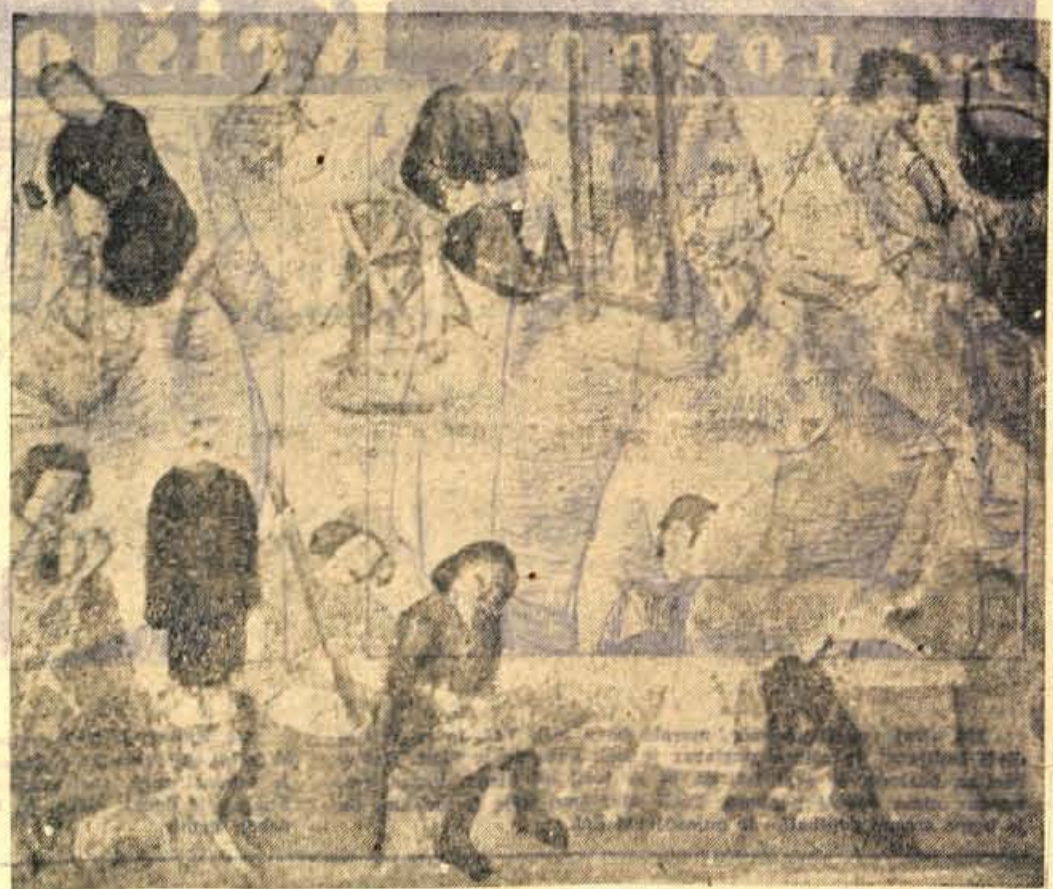
Detail freske v Crngrobu