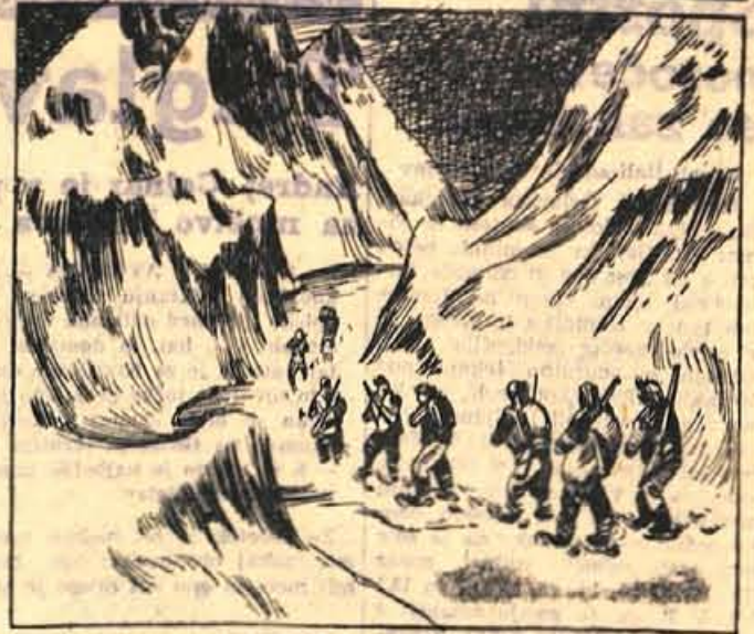
135. Več dni so neprestano potovali. Steza se je vila sem in tja med štrlečimi vrhovi, toda svoje smeri ni spremenila. Snega je bilo več kot v dolinah. Indijanci so bili utrjeni in vajeni hoje na krpljah že od delinstva. Tudi Kristof ni ta neskončna pot povzročila večjih težav kakor njim.