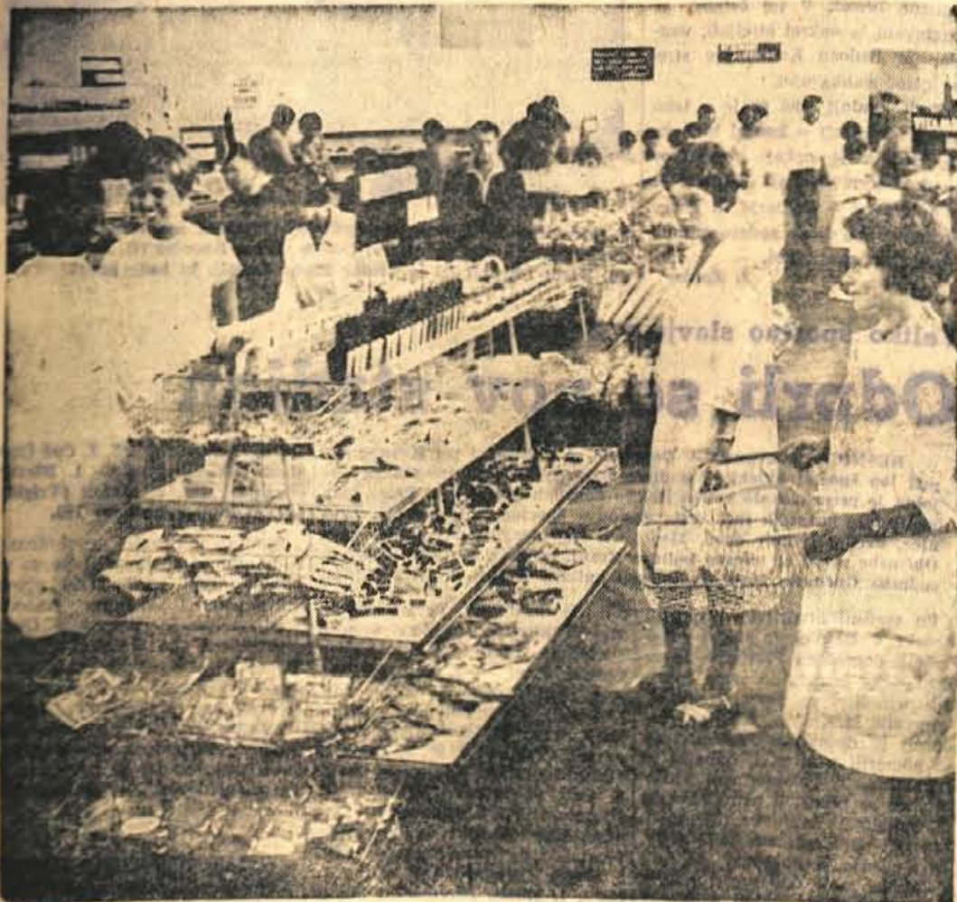
Naš paviljon leta 1961