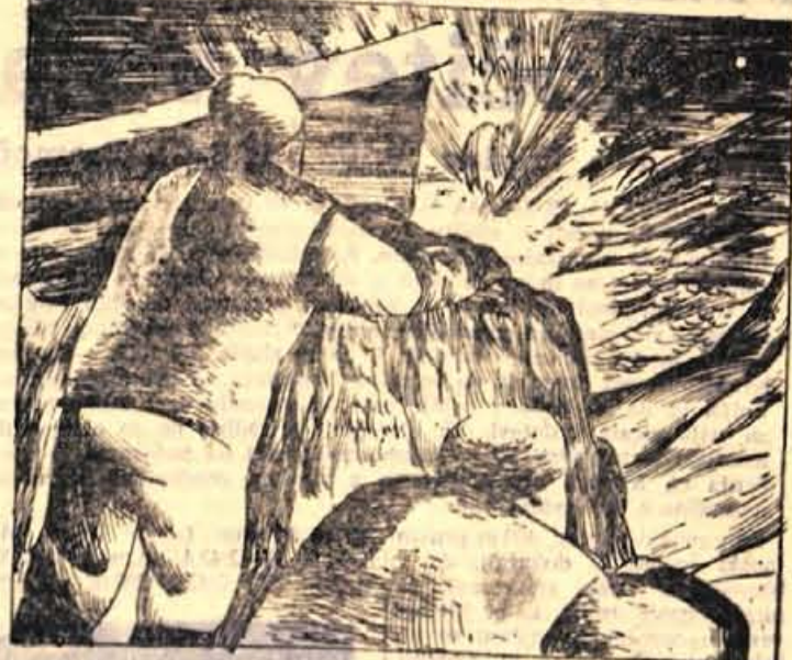
124. Kjerkoli se je prikazal Kriš, povsod je bil v središču pozornosti. Za nalašč je hodil od gostilne do gostilne. Kamor je vstopil, je bilo nekaj minut po njegovem prihodu nabito polno. Kadar je odšel, se je gostilna prav tako hitro spraznila. Val so pričakovali, kaj bo?