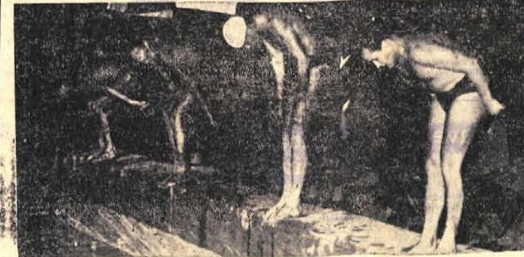
Po treh letih so kranjski plavavci v soboto prvič izgubili dvoboj z Ljubljano

Rezultati dvoboja: Triglav (Puhar 373, Potušek 380, V. 395, Knific 347, Čenčič 371, man 357), Ilirija 2151 (Rolnik 357, M. Kresc 362, Smerdelj 351, 354, C. Kresc 330, Ha 387) B.F.