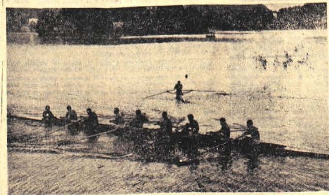
Mladinci blejskega osmerca v soboto niso nastopili

Danes dopoldne je bil na Hrušiči kros za pokal talcev okoli zasedene Hrušice. Nastopilo je 13 ekip. Rezultati so naslednji: člani — 1. Jesenice, 2. JLA Hrušica, 3. Partizan Hrušica itd., mladinci — 1. Partizan Hrušica, 2. Jesenice itd., mladinke — 1. Partizan Hrušica, pionirji — 1. Partizan Hrušica itd. — U.