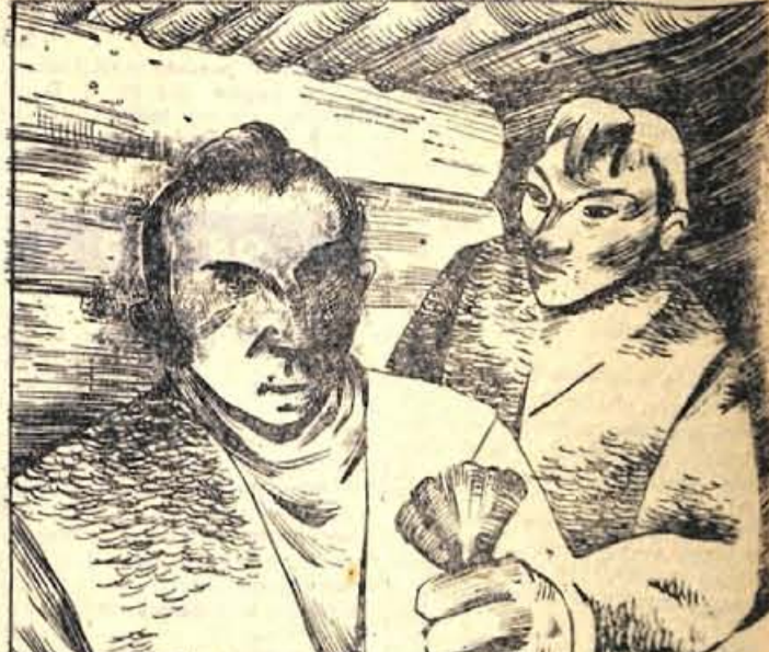
111. »Poslušaj me, Wentworth,« mu je rekel Kriš. »V roki držim vrečico, v kateri je za tisoč dolarjev zlatega prahu. Bojati sem in lahko si privoščim porato. Dajte mi en sam krompir in vrečica je vaša.« Stari Lisjak je težkal vrečico in premitšijeval. Nasled mu ga je stisnil v pest.