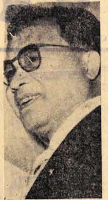
Prince Suvana Fuma, predsednik enotne laoske vlade

laoski oboroženi spor. To so večji del vojaški izvedenci, ki so Solali in vezbali domače čete.