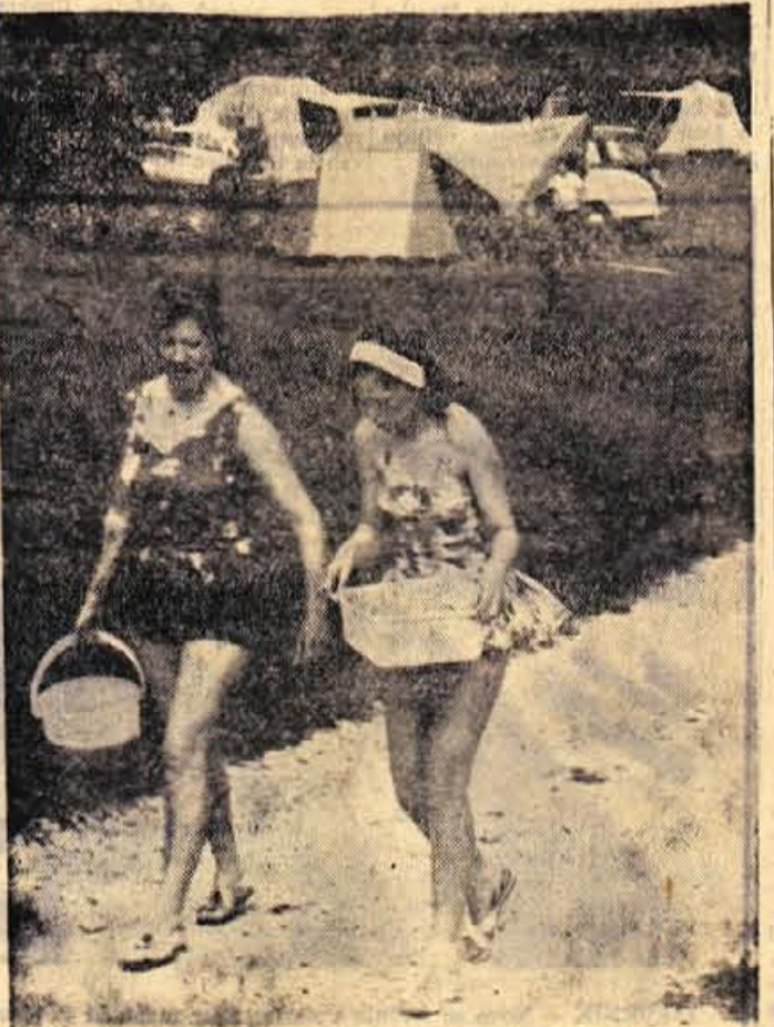
Mednarodna družina v blejskem naselju pod šotori je izredno zanimiva. Označe avtomobilov pravijo, da na zeleni površini najdejo začasni dom številne evropske družine. Dve tujki s posodo in vodo, ki je v taborišču vir čistote. Do blejskega jezera je po angleških dolžinskih merah samo nekaj jardov. In vodo seveda do šotorov nosijo na rokah

Za vsa pojasnila se obračajte na upravo Glasa ali na našo podružnico na Jesenicah.