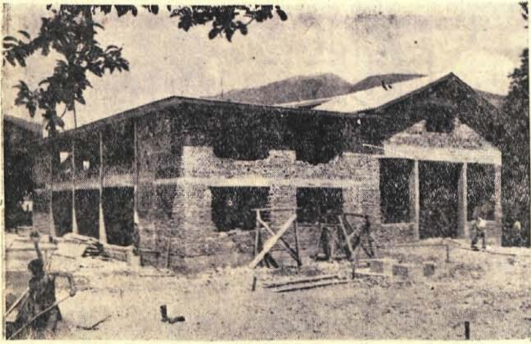
V Cerkljah so že lani začeli z gradnjo večjega poslopja, v katerem bo dobila prostor benecinska črpalna, mehanična delavnica, Obrtno podjetje pa poslovne prostore. Z deli seer še nadaljujejo, vendar pa objekt letos ne bo dograjen, kot je bilo predvideno. V Obrtnem podjetju smo zvedeli, da je počasna gradnja posledica pomanjkanja sredstev.

S pripojitvijo trziške krojaške delavnice k trgovskemu podjetju »Runo« Trzin, so nastale nove možnosti razširitve poslovanja, čemer je že obširno razpravljalo delovni kolektiv. Zavzel se je za to, da bi svoje poslovanje razširil na nekatere obrtne stroke in se lahko lotil izdelovanja pempetov usnjene konfekcije, copat, rokavic, moškega in ženskega krojaštva. O tem predlogu je razpravljali že tudi svet za blagovni promet pri ObLO Trzin, ki je predlog osvojil, bržkone pa bo dal privoljenje tudi ObLO, ki je o zadevi razpravljala na včerajšnji seji.