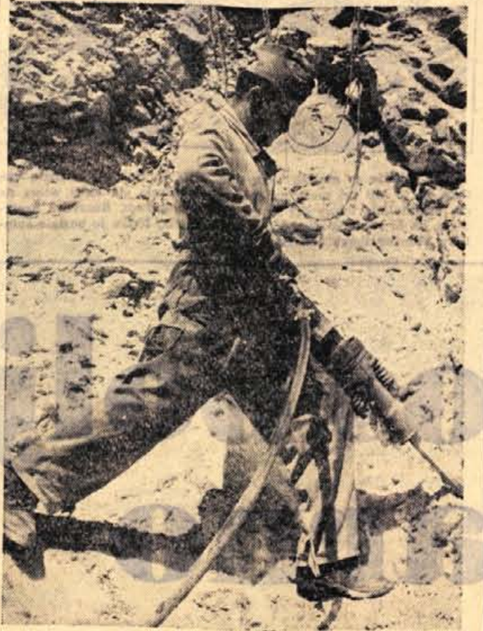
Dve zmagi graditeljev "Zasavske ceste"

pri organizaciji prireditve in oskrbi proge. Prireditelj pričakuje, da bo uspelo organizacijo dirk, ki s-prve za državno prvenstvo in tretje za republiko, nudil pri-jateljem športni užitek tisočim lju-biteljem avto-moto športa na Gorenjskem. Razen tega v Skofji Loki vedo povedati, da pričaku-jejo nov hitrostni rekord proge, ki bo presegel znamak 110 km na uro.