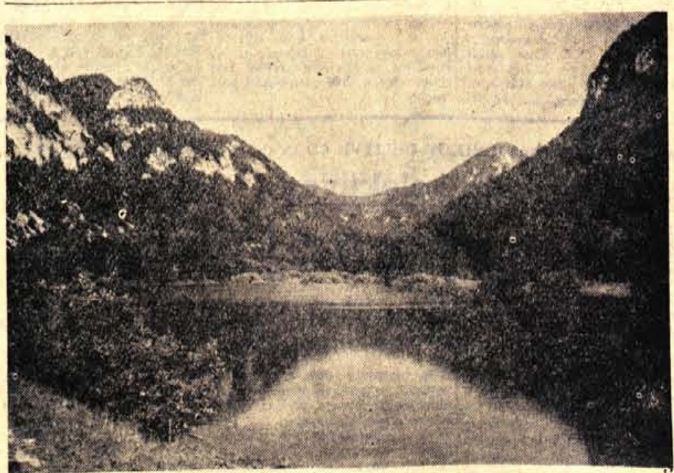
Tokrat v sliki • Tokrat v sliki • Tokrat v sliki • Tokrat v sliki • Tokrat v sliki

Bohinj? Crnjava? V zadnjem času na Gorenjskem kar čez noč nastajajo nova jezera. Kar pred tisočletji niso opravili ledeniki, skušajo sedaj »popraviti« ljudje, da bi napravili svoj kraj turistično mikavnejši. »Jezero« so uredili na Jezerskem, v Predvdvoru, o njem razpravljajo v Kranjski gori itd. Ob tem pa še vedno sameva romantično jezercje v Završnici pri Zirovnici, ki bi ga lahko z več dobre volje in domiselnosti pa malo denarja uredili v prijeten kotiček