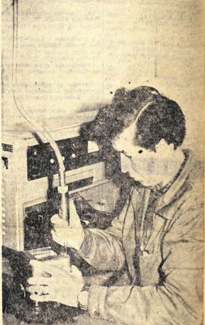
Kljub dopustov za nekatere ni počitka

Pretežni del dopustov bodo delavci v tovarni Savi izkoristili do oktobra. Politika planiranja dopustov v tej tovarni kaže, da se je delovni kolektiv zavzel, da ne sme dopustiti, da bi nastali povzročili večje izpade v proizvodnji. ŽELJE POSAMEZNIKOV VSKLAJUJEJO S SKUPNIMI INTERESI V LESNO-INDUSTRIJSKEM podjetju Jelovica v Skofji Loki so nam povedali, da dopusti delavcev v poletnih mesecih ne vplivajo bistveno na zmanjšanje proizvodnje. Ta je zaradi specifičnosti dela podjetja v poletnih mesecih celo večja kot v zimskih. Razen tega so vsi dopusti delavcev že naprej predvideni in potekajo po nekakšnih načrtih, ki jih prav za namenom, da ne bi trpela produktivnost, pripravijo vodje in mojstri v posameznih oddelkih. Le delavci obrata furnirja imajo vsako leto kolektivni dopust, ki pa jim teče vzporedno s čiščenjem kotlov, tako da do izpadov v proizvodnji ne more priti, ker je vsakoletno čiščenje že vnaprej planirano. V omenjenem obratu je zaposlenih okrog 150 delavcev. S takim načinom koriščenja poletnih dopustov so v Jelovici pričeli že pred nekaj leti, sedaj pa se je izkazalo, da je to zelo koristno. V tem podjetju se delavci in njihovi vodje pogovorijo, kdaj bo kdo koristil svoj dopust, potem pa želje posameznikov skušajo uskladiti s skupnimi interesi kolektiva, med katerimi je seveda v prvi vrsti redno doseganje plana proiz-