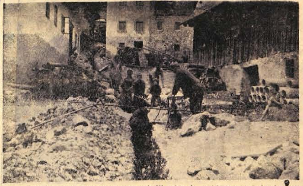
V vas Spodnje Danje v Selški dolini so napeljali sodobni vodovod. S tem se je vaščanom izpolnila velika želja, saj so doslej

Pripis uredništva: Veseli nas, da bodo s tem odgovorom prebivavci Zalega loga in okoljskih vasi pravilno obveščeni o vzrokih za ukinitve tamkajšnje pomožne pošte. Naj povemo, da smo informacije, opisane v članku »Ukinjen krajevni urad«, dobili v razgovoru z bivšim šefom krajevnega urada Zali log. Kot se vidi iz odgovora podjetja za PTT promet Kranj, so bila naša predvidevanja o podražitvi uslug z dostavljanjem pošte na dom, pravilna, zato naj to pismo ostane le kot dopolnilo k članku, ne pa kot popravek.