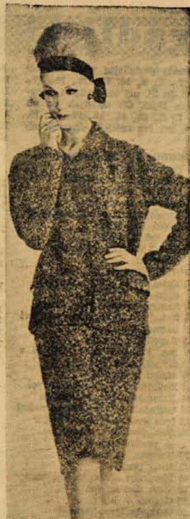
Za ročno pletenje malce zahteven pleten kostim v dveh nitkah kontrastnih barv. Krilo je podloženo s svilo, da lepo pade in se ne razteguje

— Starejše gospodinje si navadno ne negujejo rok in menijo, da se tako vsaj vidi, kje pri hiši največ dela. Tega mnenja pa niso vse, saj je pravi estetski užitek videti lepo negovane roke. Ne spomnite se vedno na roke, ko ste že začeli pomivati posodo in se vam tedaj ne zdi vredno iti po kremo v predal ali kopalnico. Pripravite si kremo nekje ob prostoru za pomivanje, da bo vedno pri roki in si jih po pomivanju namočite. Potrudite se, da vam bo to prešlo v navado.