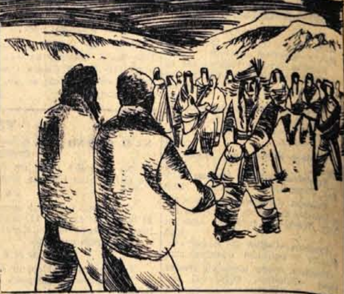
102. Kariuk je iz mošnje privlekel veliko kepo kovine. 'Saj je baker!' je vzkliknil Cok. 'In ubožci mislijo, da je to zlato...'