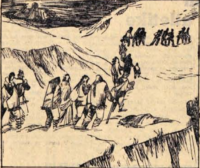
100. Ko sta srečno prekoračila prelaz, sta se spustila v sotesko. Navkreber proti njima je lezla raztegnjena vrsta ljudi...