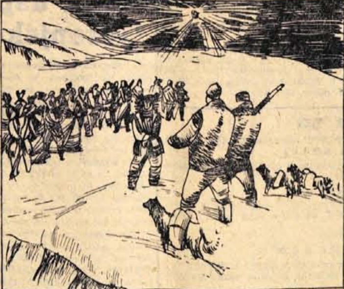
101. Indijanci so navallili na Kriša in Coka. Otepala sta se jih s palicami. Star Indijanec je stopil v ospredje...