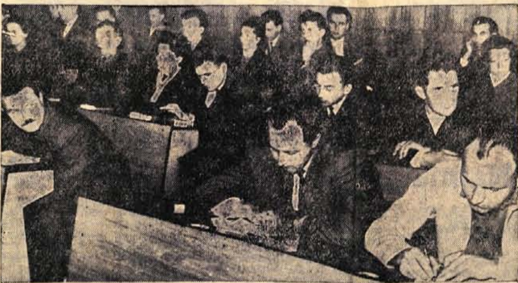
Člani ZK med posvetovanjem o perspektivah tekstilne industrije

industrije prenesti pred kolektive in pred samoupravne organe. Tam bodo komunisti - udeleženci današnjega posvetovanja - skušali tolačiti bližajoče se težave in nakazovati izhodišče v omenjeni