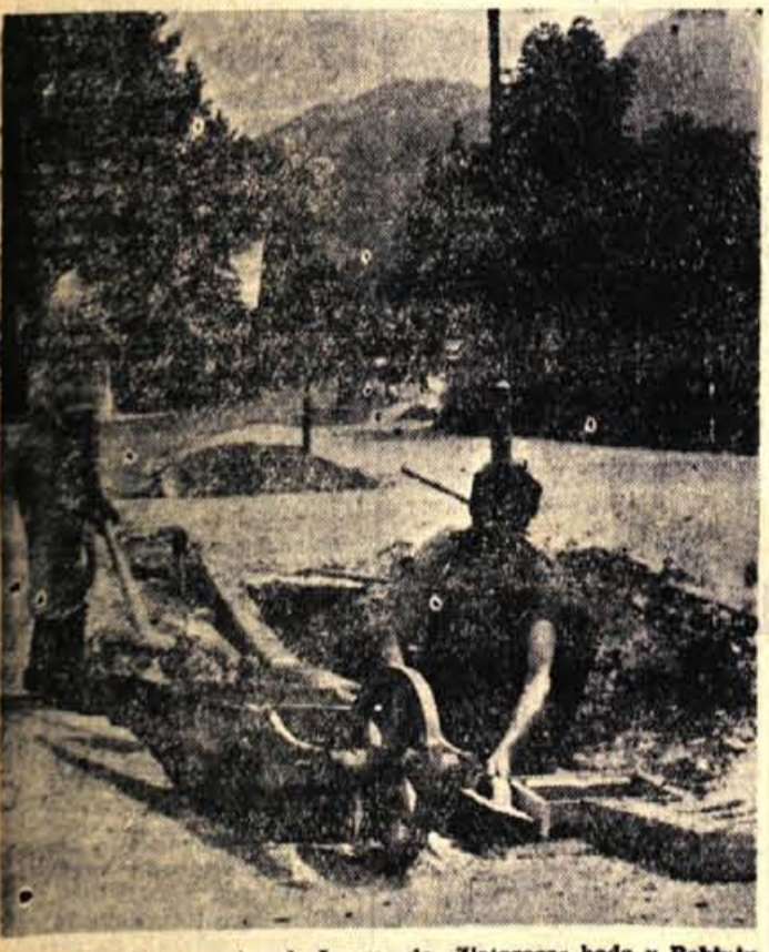
Razen asfaltirane ceste od »Jezera« do »Zlatoroga« bodo v Bohinju dobili v kratkem še avtobusni izogibalšči in sprehajalno stero dolgo 500 metrov. Le-ta bo ločena od avtobusnega izogibalšča, ki bo po vsej verjetnosti asfaltirano, in ceste s cvetličnim pasom. Na sliki: delavca bohinjske komunalne uprave, ki izvajata dela, pri zaključnem delu obtočnega jaška

Ta dan je bila v šoli tudi odprta razstava, ki je prikazovala razvoj podbreške šole od začetka do danes. Na razstavi je bilo tudi prikazano izvenšolsko kulturno-prosvetno delo, ki je v tesni povezavi s šolo - F. Cvenkel