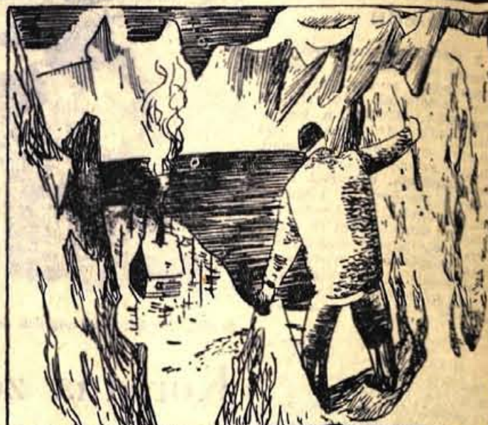
88. Zgodaj spomlad sta se napotila Kriš in Cok po reki Seward navzgor med gore, kjer je moralo biti tisto čudovito jezero, ki ga je pozimi našel Kriš. Vso pomlad sta ga iskala in ko sta se že nameravala vrniti, sta zagledala kočo in vodno površino, ki je zapeljala in prevarila že cel rod rudarjev.