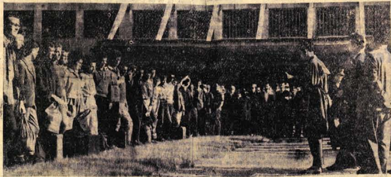
Sprejem mladinskih delovnih brigad na Jesenicah (glej poročilo na 4. strani)

Na tiskovni konferenci je bilo precej govora tudi o turistični propagandi in o njenem financiranju. Tako je na primer napočeno, da Gorenjska turistična zveza prodaja raznim turističnim agencijam (KOMPAS) prospekte po 40 dinarjev. Agencije pa jih dajejo turistom zastonj. To vsekakor ni v skladu z normalnim poslovanjem. Zato bo gotovo potrebno poslati primeren način financiranja za turistične prospekte, ki so v sodobnem turizmu nujno potrebni. - M. Z.