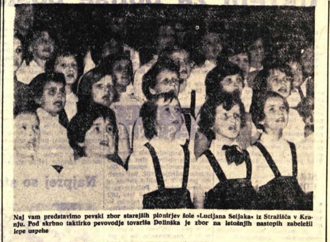
Naj vam predstavimo pevski zbor starejših pionirjev šole »Lucijana Seljaka« iz Strazliča v Kranju. Pod skrbno taktirko pevovodje tovariša Dolnška je zbor na letošnjih nastopih zabeležil lepe uspehe

teh lokacijah bodo namešili uredili novi postajališči. Vsa dela bodo v glavnem opravili s prostovoljnimi delom. Kraljeva skupnost Jezersko pa je pričela razsvetljevati o tem, da bi na postajališčih uredili tudi primerne čakalnice za potnike, ki bi s predvom koristile v dežju in snegu. Verjetno se bodo odločili za čakalnice, kakršne so postavili Godešani in Godešani pri Skofji Loki, če bodo le sredstva na razpolago. - R.