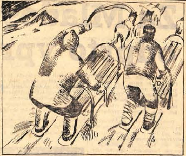
81. Zdaj se je začela dirka proti mesiu. Ko je napočil dan, je Kriš opazil pred seboj sanj. Ni še preteklo pol ure, pa se je vodilni pes že zaganjal vanje. Bil je Arizona Bill. Pot je bila ozka in Kriš je moral cele pol ure voziti za njim. Na prvem ovinku ga je začel prehitevati.