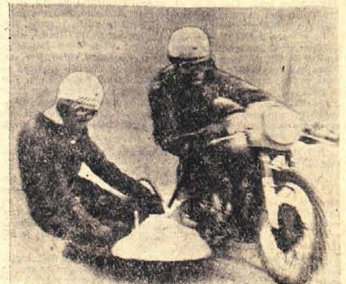
Tudi prikoličarji bodo avgusta tekmovali na velikih dirkah motoristov v Škofji Loki