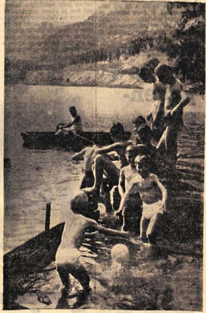
Med novim nasipom, po katerem bo peljala železniška proga do novih valjarn na Belškem polju in cesti I. reda Kranj-Jesenice, je nastalo pravo jezero. Kljub doka umazani vodi so se mladi jezerski kopavci le zbrali ob »umetnem jezeru«. Med njimi je seveda največ otrok. Da je zdravo kopanje v tej vodi, ne bi mogli trditi, saj se v njo steka razna umazanija. Zato bi bilo prav, če bi pristojni le nekaj ukrenili in prepovedali kopanje v tej vodi, da ne bo prepozno. Na ta način so dane vse možnosti, da se razširijo te ali one nalezljive bolezni. — M. Z.