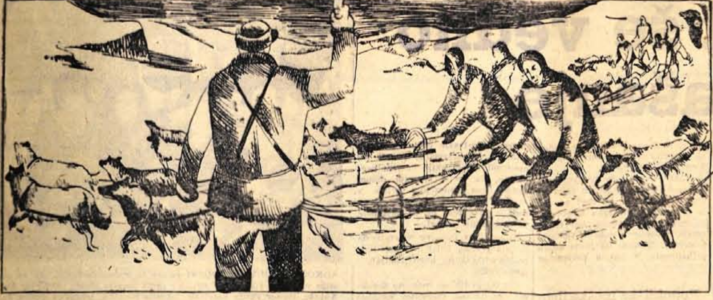
82. Opolnoči je policijski poročnik Pollock dal s pištolo znamenje in začela se je dirka. Petinštirideset vprej je zdrvelo k potoku. Vsak udeleženec je moral povedati policaju svoje ime, ko je postavil mejnike. Može so hiteli, začelo se je prvirvanje, vpije in onemoglo sopihanje.