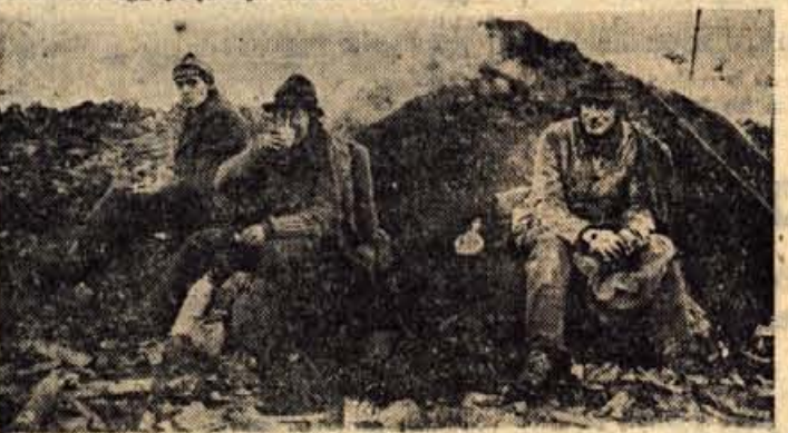
»Tukaj je bolj toplo«, so dejali oglarji in nihče se ni zmenil za sneg in mraz.

Cesta je vodila naprej po dolini. Snega je bilo vse več in kolosa »dobrega prijatelja tička« so