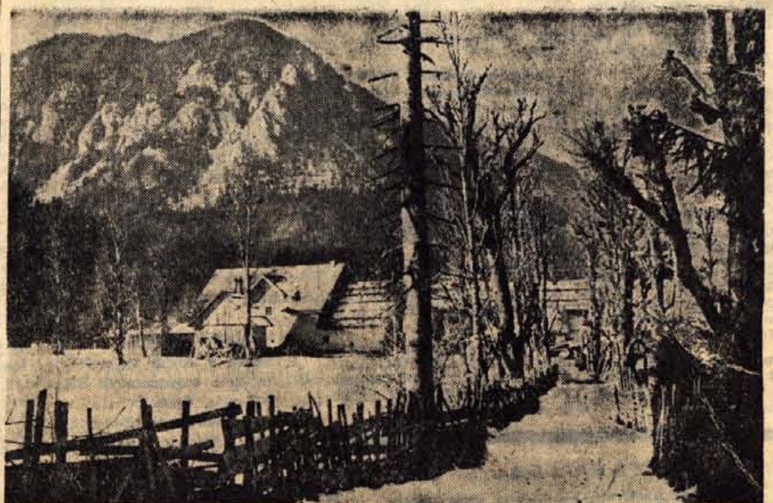
Se pozimi je dolina Radovne na moč prijetna

in po vsej Krmi je bilo tiho, slovesno, belo — pravilčno. Nazaj, navzdol je šlo laže. V