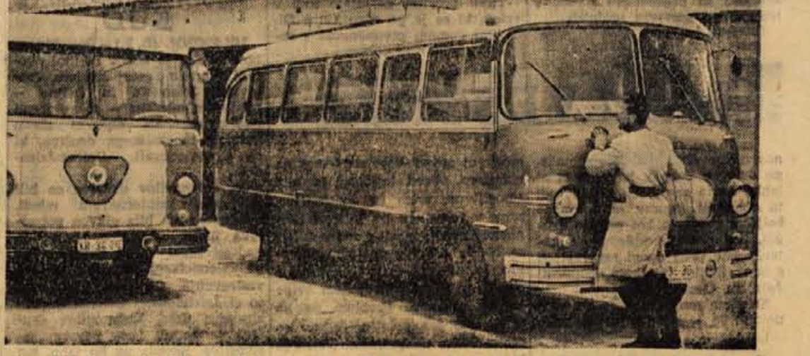
Jesenjski Avtoservis si je v zadnjem času zgradil garaže in nabavil 7 novih avtobusov, ki so že našli svoj dom v novih garažah.

Rateče, 16. januarja - Danes je prispelo na šolske počitnice v Rateče 96 gimnazijalcev z Reke in 33 dijakov podgaške šole iz Varaždina. 18. januarja pričakujejo še okoli 24 gimnazijalcev iz Varaždina in 21. januarja okoli 80 srednješolske mladine iz Ljubljane. Vsi, ki bodo prišli v Rateče in Planico, bodo stanovali v gostinskih podjetjih, po privatnih sobah in v osnovni šoli.