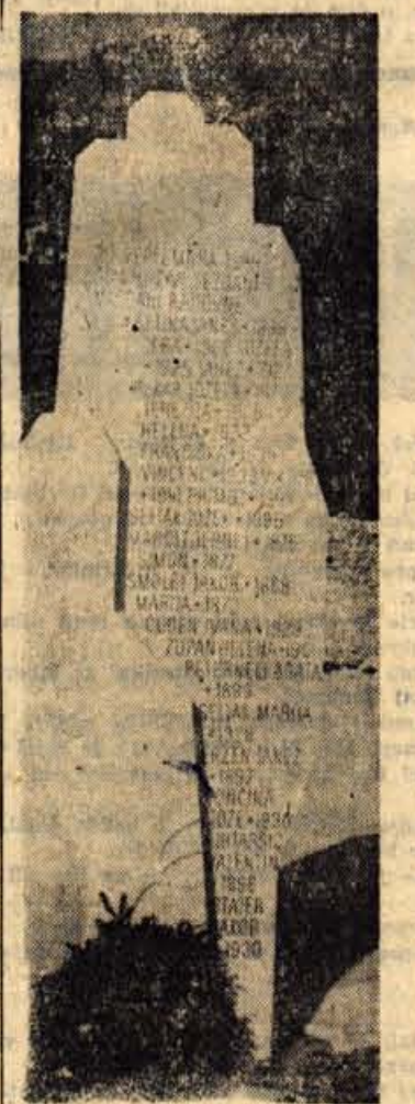
Spomenik v Radovni