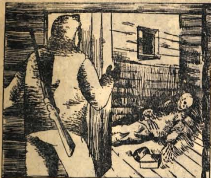
73. Spustil se je k jezeru. Ob robu borovega gozdička je stala razpadajoča kočica. Vstopil je. V kotu je ležalo človeško okostje, zavito v kožuhovalno. Zagledal je kepo zlata in kositrno skatlico, zapolnjeno z zlatimi zrni. Ljudska govornica je bila verna. Zapomnil si je kraj in odšel.