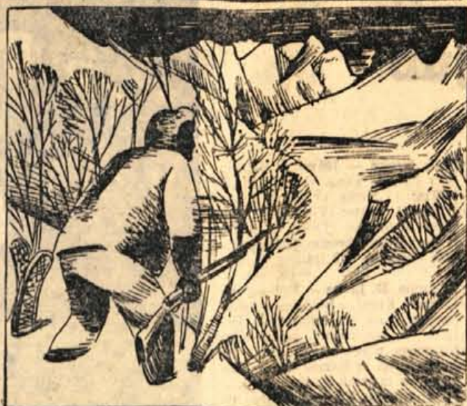
74. Na nekem ovinku je počilo z desne. Zaslišal je drugi pok in kroglja je zaživigala mimo. Nekdo je neprestano streljal. Kriš se je skrnil med grmovje, si odpel krpice in previdno gledal okoli sebe. Opazil ni nikogar. Streljanje je prihajalo z nasprotnega brega reke.