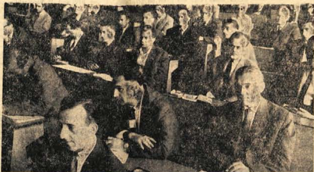
Zanimiva tema tokratnega posvetovanja Jugoslovanskega združenja za upravne znanosti je pritegnila v Kranj nad dvesto zaposlenih v različnih organih javne uprave, ki so na dvodnevem zborovanju temeljito obdelali in proučili omenjeno temo

operacije, specializacije in medsebojnega povezovanja sorodnih industrijskih podjetij v gorenjskem bazenu. Tudi pri nas se namreč vedno otreje in odločneje postavlja problem ekonomske-