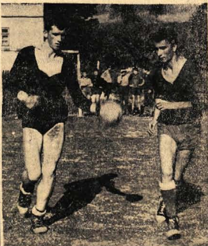
Radviljski rokometarji so letos prvič sodelovali v gorenjski ligi