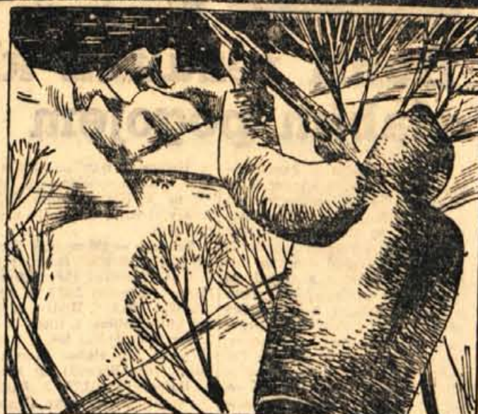
75. Medtem pa se je pojavila izza ovinka pasja vprega. Kriš je ustrelil v nasprotni breg, da bi opozoril moža na saneh. Neznani napadavec ga je zadel s prvo kroglo. Po neki navzgor so prihajali glasovi in prikazalo se je troje sanj.