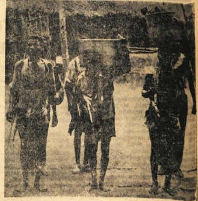
Pripadniki angolskega uporniškega gibanja

oddelke in sedaj razpolagajo že z večjimi količinami ročnih bomb in strelskega orožja. Pripravljenost in moralna trdnost angolskih borec sta na visoki. Ta vera v zmago izhaja iz nečloveškega izkoriščanja kolonialnih oblasti, saj skoraj ni človeka v Angolji, ki ga portugalski kolonialisti ne bi obsodili na prisilno delo. Mnogi sedanji borec uporniških oddelkov so pobegnili iz portugalske vojske in se pridružili osvobodilni vojski. Portugalska vojska in častniki so bili zelo surovi z domačimi plemen. V Angoli se torej bje odločena bitka, prava vojna,