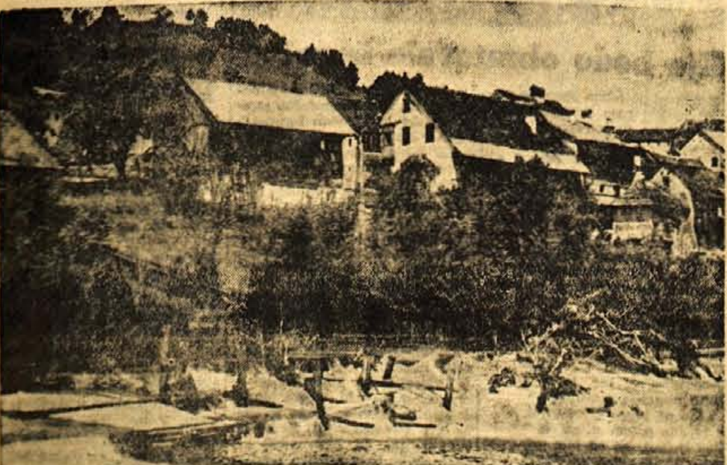
Jez na Sori pri škofji Loki je v pravi nevarnosti, da ga drevesje, ki ga je voda nanesa nanj, podr. Če teh dreves in vejčja ne bodo kmalu odstranili, prav lahko pride do velike škode