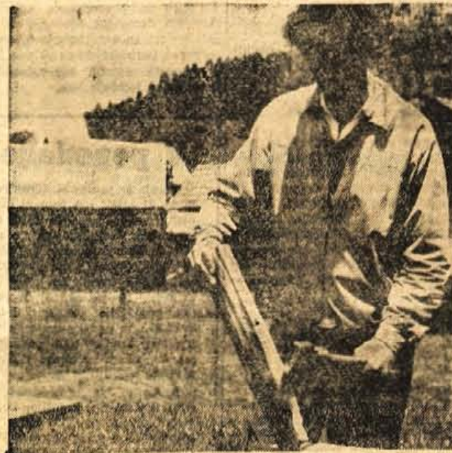
Praden bo kopalnice v Poljanah sprejelo prve kopavce, ga je treba urediti. Te dni je naš fotoreporter »ujel« predsednika tamkajšnjega turističnega društva, ki je pripravil plažo ob Sori.

Mladina, ki je včlanjena v delavsko-prosvetno društvo Svoboda Železniki, se je odločila, da bo odsej vsako soboto zvečer privedla ples v veliki sobi vile Vrt, ki je last družbeno-političnih organizacij v Železnikih. Pari se tam zavrtijo ob zvokih domačega kvarteta mladih glasbenikov iz tamkajšnjega podjetja NIKO. — J.