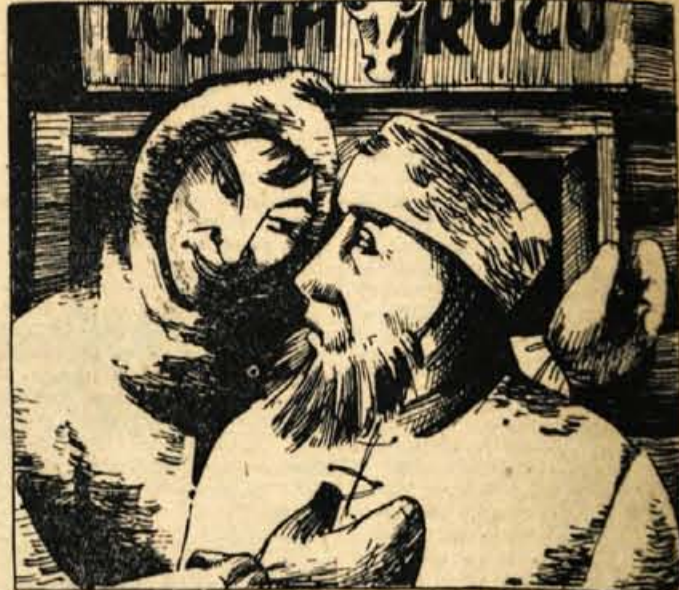
63. 'Veš, - je rekel zunaj Coku, - študiram sistem. Kadar zažene pravega, lahko opleniš igralnico! Coku ni bilo všeč. 'Cuj, Kriš, je rekel, - ako so ti sistemi začeli rojiti po glavi, bo bolje, če se kat taksaj vrneva v snežne pustinje.'