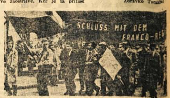
V znak solidarnosti do stavkajočih študentov in rudarjev je 200 dunajskih študentov demonstriralo pred špansko ambasado

Stavkovno gibanje ima za špansko politično življenje še neko drugo označbo. Telo, ki je bilo skoraj desetletja popolnoma mrtvo, ki ni kazalo nobenega znaka življenja, je ob sedanjih stavkah napravilo prve gibe. Slabotni krči so znak, da politični živci še niso popolnoma odmrli. Zaradi tega dejstva je tudi pritisk nasilja prilagojen tako, da ne povzroča nove zaostritve. Ker je ta pritisk