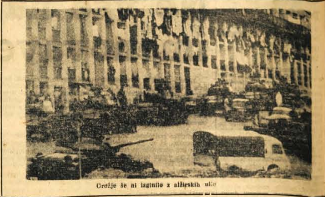
Orožje še ni izgnilo z alžirskih ulic

Kdaj bo odbila zadnja ura de-sničarskim zločinom? Geslo »Se-zgimo deželo« OAS-ovskih tip ne bo rešilo, kakor ne bodo moči uredničji svojih peklenskih de-lov. De Gaullova odločitev, da bo glasovanje o alžirski samostoj-nosti izvedel brez zavlačevanja, se pravi že okoli prvega julija, vsekakor ohrablja in ohrablja. Zdravko Tomasi!