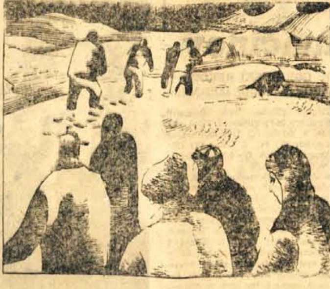
36. Tam, kjer se je komaj vidna gaz izgubila proti jugu, so krenili proti znehu. Zaperedema so gazili visok sneg. Prodiranje je bilo počasno in dohitelvi so jih začeli zastolati tekmeči. Za njimi se je vlekla strnjena vrsta mež. Ob pogledu nanje so se deklici iskrale temne oči.