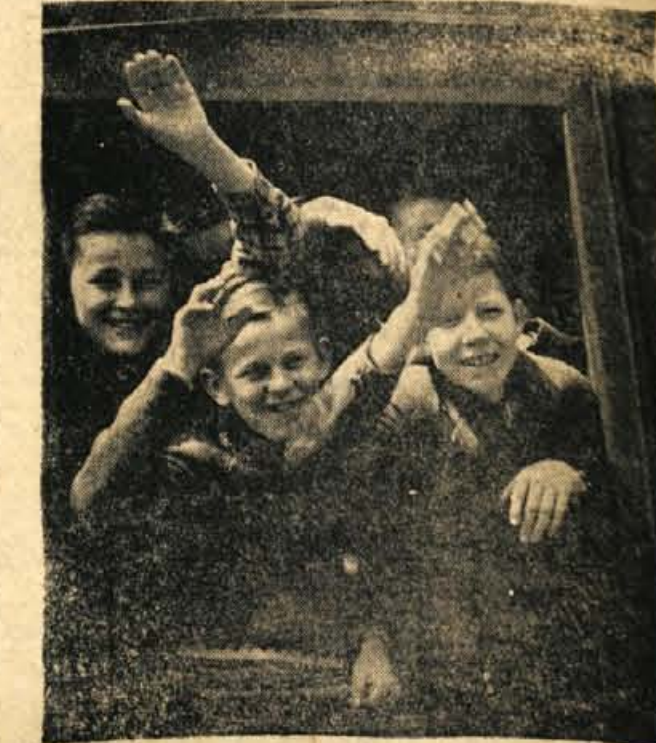
Najmlajšo ekipo kranjskih športnikov, ki je tudi potovala na festival »Bratstva in enotnosti« v Bitolo, so sestavljali obetajoči mladinski igralci. Ob odhodu so pristržno pozdravljali potnike, ki so bili v tistem času na kolodvoru

Ko smo prišli tja, so bili za vse nas, razen seveda za domačine, posebna zanimivost beli fesi. In kmalu po prihodu so nekateri