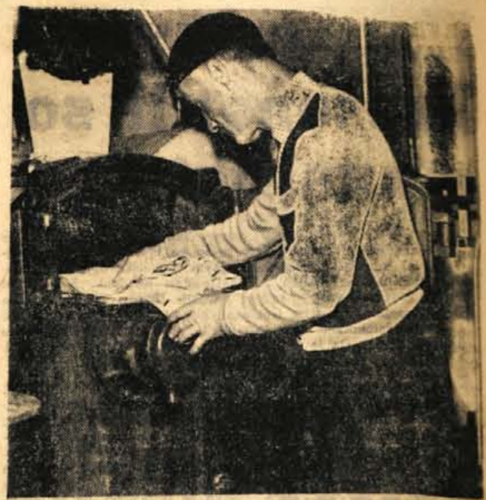
Ceprav kemična čistilnica, ki jo ima servis stanovanjske skupnosti Strazišče v Kranju obstaja šele kratak čas, je tamkajšnjim prebivalcem nadvse dobrodošla. Bojazni, da bi ne bilo dela, ni več v zadnjem času se že kažejo potrebe, da samo en delavec ne bo več kos potrebam

S tem seveda ni rečeno, da ni možnosti za zaposlovanje žena v Jeseniški občini. Kot pravijo na zavodu za zaposlovanje delavcev na Jesenicah, bo treba poiskati rezerve, ki jih je po njihovem mnenju še dovolj. Pravijo, da bo treba osvoboditi nove dejavnosti, posebej pa bo treba v podjetjih, kot so lesnagalanterijski obrat, razne obrti itd., poiskati še prosta delovna mesta za žene. Perspektive torej so, le z dobro voljo in pravilno politiko jih je treba izkoristiti. - M. Živkovič