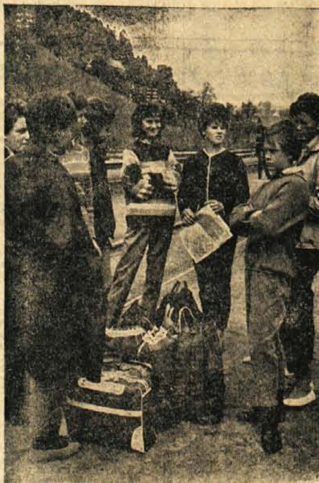
Cepprav je ekipa rokometnih igralcev prišla skupaj na kranjsko železniško postajo, so se tekmovalke hitro vključile v družbo z ostalimi mladinkami in mladinci

Danes imajo prav gotovo nekateri že prva športna srečanja. Rekordov — vsaj od Kranjčanov — tokrat ni pričakovati. Med rokometiški, odbojkarji, šahisti, atleti in namiznoteniškimi igralci so v večini mladi in bolj ali manj nepoznani obrabi. Vse vrste so sestavljene v večini iz pionirjev ali mladih neizkušnih igralcev in