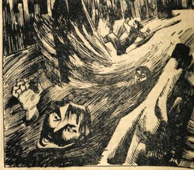
40. Box Canyon je pobiral od iskaleev zlata mrtvaški davek. Pristali so pred vhodom v sotesko in ogledovali greben, ki je štrlel iz vode. Tam je bilo že več čolnov in lasnikov, ki si niso upali dalje. S skrbljo so zrl v divlje kipenje valov.