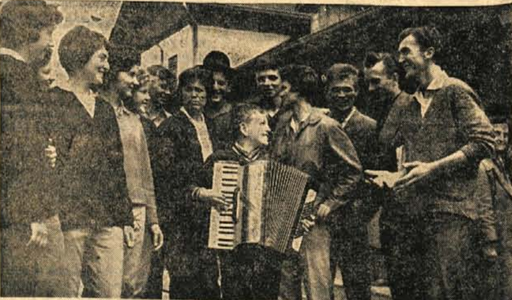
Folklorna skupina dijaškega doma na Zlatem polju v Kranju bo v Bitoli za gledavce zanimiva tudi zaradi malega harmonikaša, ki so ga na naši slikki obkrožili navdušeni mladi folkloristi