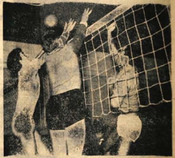
Odbojkarji iz Kropi so včeraj v zelo lepi igri premagali tekme iz Izole, s tem pa so ostali na prvem mestu II. republiške lige