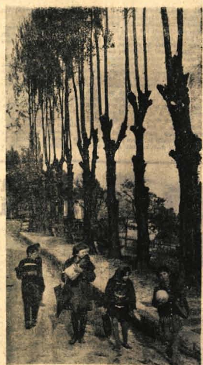
VELIKI IN MALI

Loške tovarne hladilnikov v I. tromesečju sploh niso izvažale,