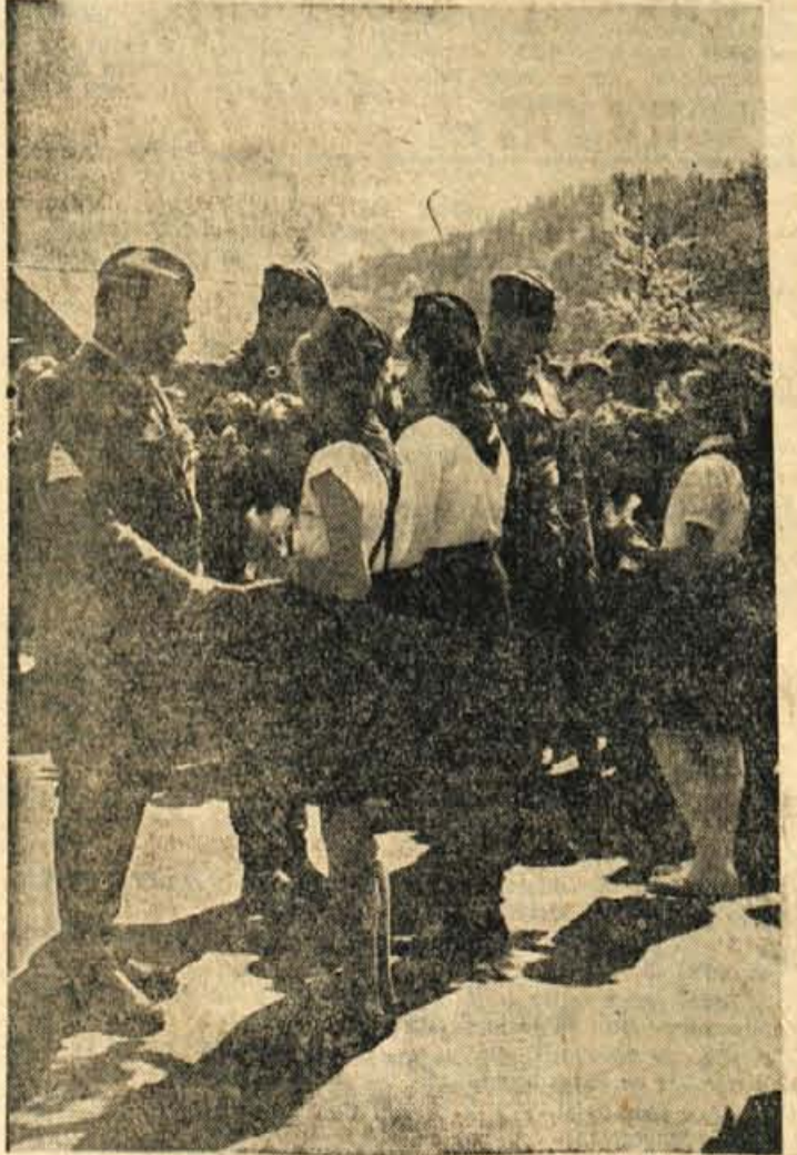
Pionirke pripenjajo borcem nageljne