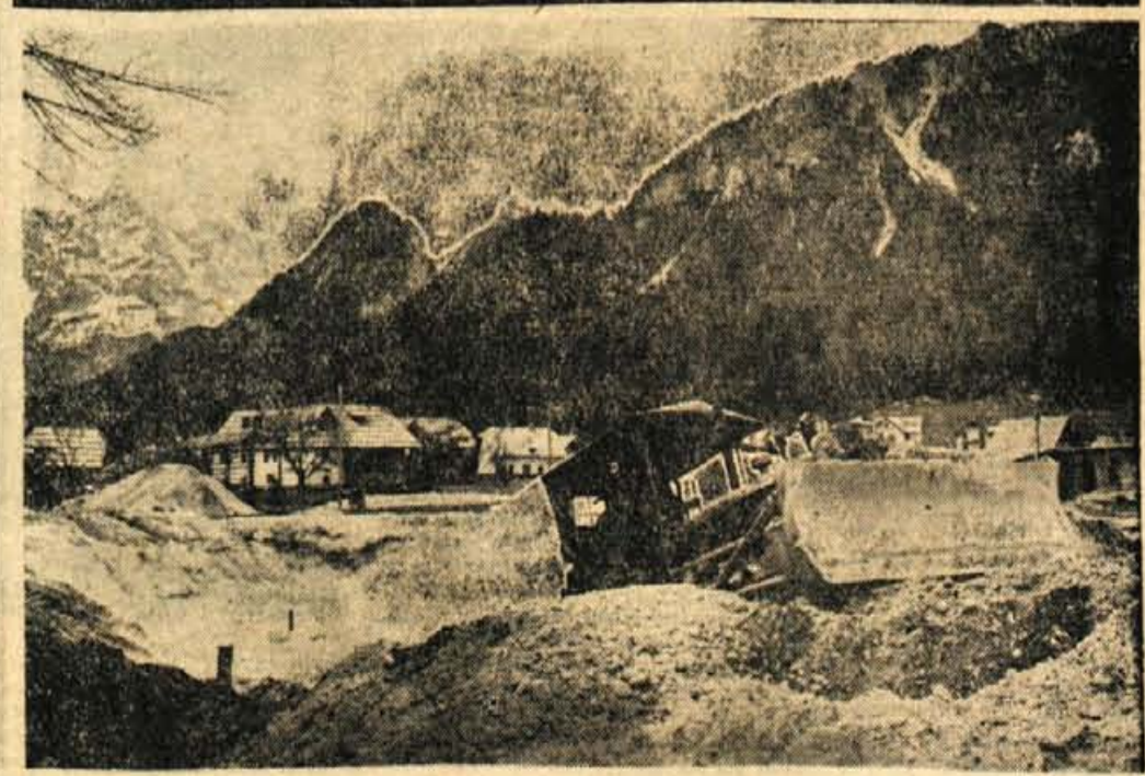
KRANJSKA GORA — Te dni so začeli v Kranjski gori z zemljskimi deli za nov hotel, ki ga gradijo v okviru ostalih turističnih objektov v Zgorunjsavski dolini. Novi hotel bo med najodličnejši tovrstni objekti pri nas