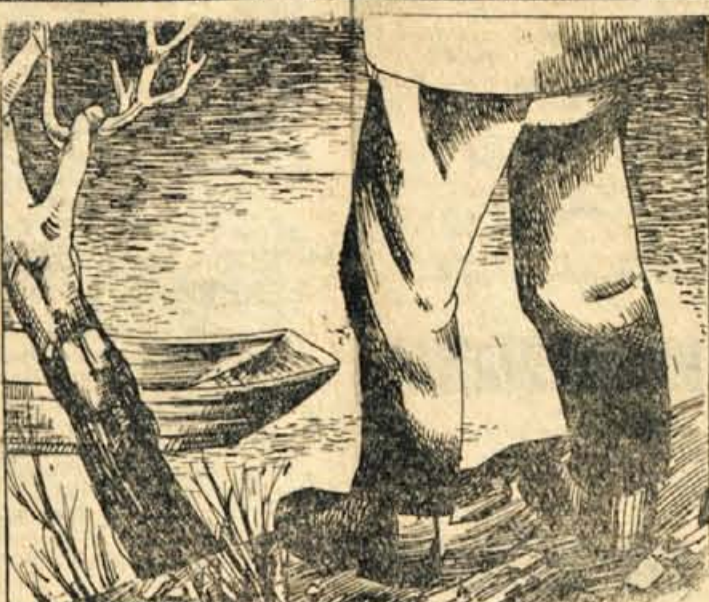
23. Pot ga je peljala nad gozdno črto preko zaledenelih pečin okrog jezera Crater. Na jezeru jezagal dol. »Dvakrat bi peljal z njim, pa bi imel svojo tono na drugi strani.« je pomislil. Bil pa je »sub- in čolnar je računel 40 dolarjev za tono. Domislil se je navsila in stopil k možakarju.