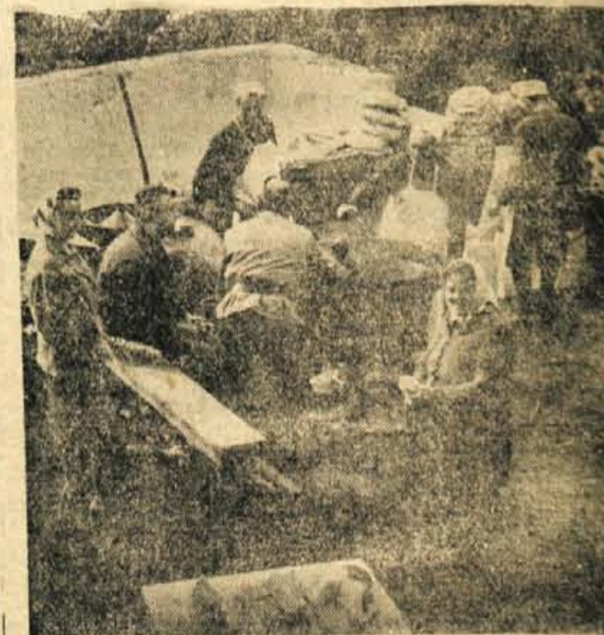
Hrana iz partizanskega kotla je bila okusna in je vsem teknila. Lešanske žene so ob tej priliki napekle okrog 200 kg domačega kruha