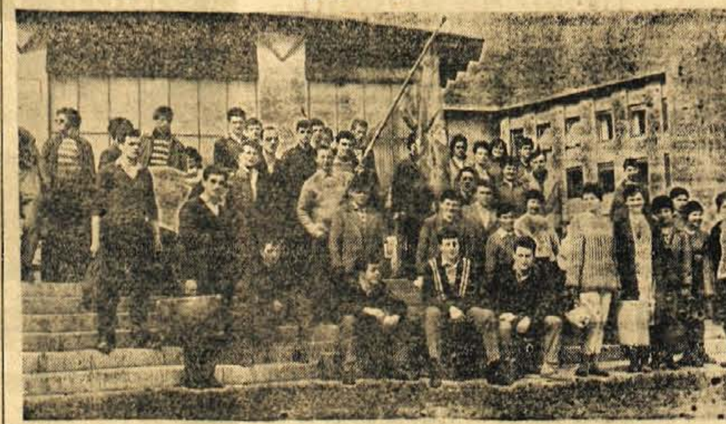
LJUBLJANA, 8. maja — Ob 9. uri je z vlakom odšla iz Ljubljane XXII. gorenjsko-novomeška mladinska delovna brigada »Jožeta Strupija«, ki bo gradila avtomobilsko cesto na odseku Parčin-Osiponca. Na ljubljanskem kolodvoru so se od brigadirjev poslovili in jim zaželeli dosti delovnih zmag številni mladinci in