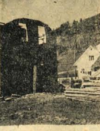
Ob Sori v Gorenji vasi gradijo tale stanovanjski blok, nato pa bodo posamezniki v njegovi bližini gradili vrstne hišice. To bo drugi stanovanjski blok v Gorenji vasi

Ob koncu naj bi se omenili lani preurejeno gostišče "Mlino" in "Murica", odprto blejsko restavracijo na gradu, mlečno restavracijo v nekdanjem "bunker baruter" novozgrajeno krilo počitniškega doma Svobode. Vse te izboljšave gostinskih kapacitet so bile odpravljene v glavnem z lastnimi sredstvi, le nekaj je bilo iz investicijskega sklada ObLO. — J. B.