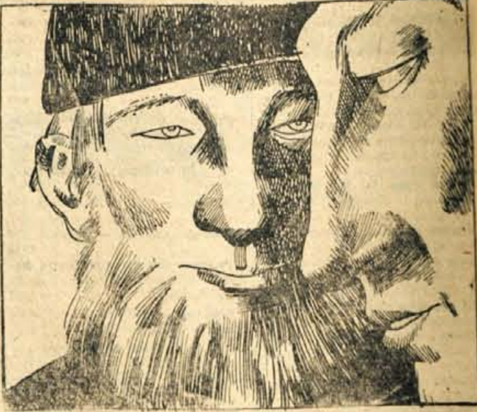
24. »Pogledaj, kaka je ta ženska!« — »Imaš jo imenoma, imenoma in jih si na vaš čoln. Vzemite sekuro in zasekajte vanj drvo od vrha do dna. Ali razumete? Dnevno bo šlo po njej sto ton in ne boste imeli drugega dela, kakor pobirati denar!« Za domisljevo ga je čolnar nagradil: prepeljal mu je blago.