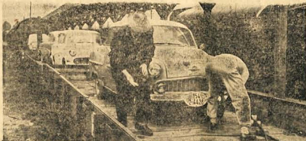
JESENICE — Tovarš Tito je v svojem govoru v nedeljo v Splitu med drugim videti ste, da smo takoj po seji Izvršnega komiteja CK ZKJ sprejeli nekaj nujnih ukrepov, med njimi tudi prepoved uvoza avtomobilov. Ta prepoved bi morala začeti veljati — mislim 2. maja. Kaj pa se je zgodilo? Na našo mejo je tisti dan, preden bi morali spustiti rampo, prišlo 2000 avtomobilov. Pomislite 2000 avtomobilov! Naj velja vsak izmed njih samo 1000 dolarjev, pa znese to že dva milijona dolarjev, to pa ni majhen znesek... Naš fotoreporter je ujel na filmski trak, ko so raztovarjali avtomobile na Jeseniški železniški postaji.

Braziliji, ki še ni prebolela »ustavne krize« po tako čudni in nevsakdanji ostavki predsednika Quadrosa bo navezovanje na zelo razširjeno politiko mednarodnega sodelovanja olajšanje. Olajšanje v tem smislu, da bodo Brazilci poverovali v svojo moč. — Zdravko Tomažič