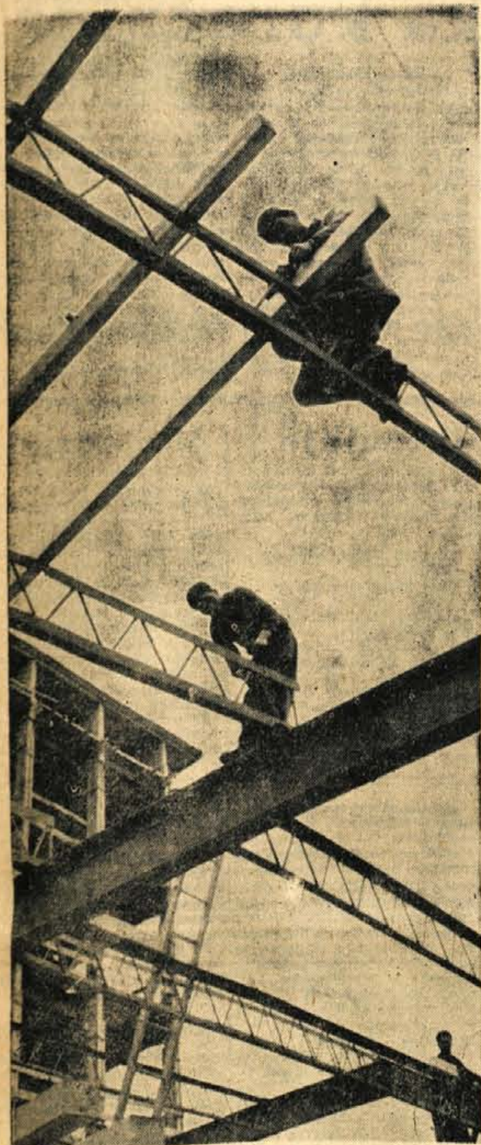
Gradnja Narodne banke v Kranju vzbuja pozornost s svojim železobetonskim skeletom. Železni skelet, ki ga predstavlja naša slika, pa je še posebno zanimiv, če ga gledamo iz »žabje« perspective. Le kaj bi rekli delavci, ki sestavljajo skelet in gledajo na zemljo s »ptičje« perspective?

GLASILO SOCIALISTICNE ZVEZE DELOVNEGA LJUDSTVA ZA GORENJSKO