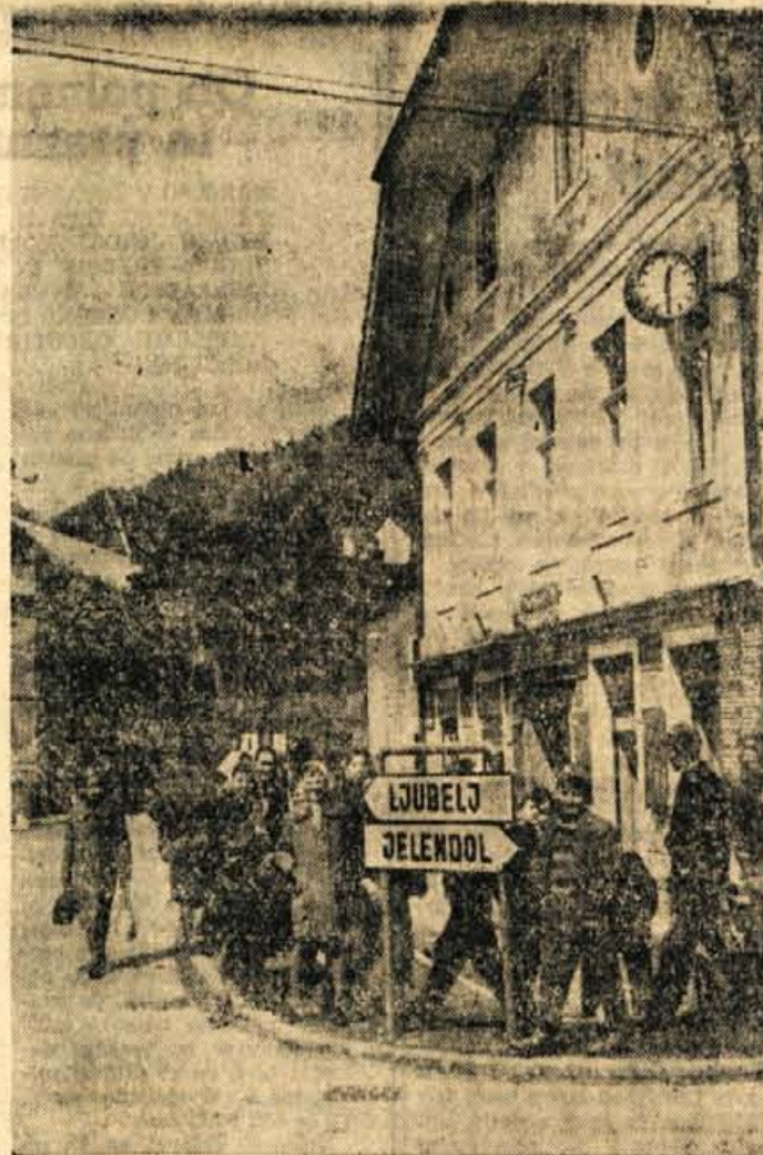
V obeh dolinah: v Jelendolu in Podlublju so samo dvorzredne Otročji višjih razredov pa se vozijo z avtobusi na osemletko ObLO jim sveda plačuje prevozne stroške. Tako rešujejo šol v teh oddaljenih krajih, kar omogoča kvalitetnejši Otrok pa vsakdanja vožnja prav nič ne dolgočas. To je tudi iz njihovega razpoloženja na avtobusni postaji v Trziču.

Svet za blagovni promet pri ObLO Trzič je predlagal, da bi podaljšan čas tržišča do 4. ure popoldne, in to zaradi boljše oskrbe potrošnikov z zelenjavo in drugimi živiliškimi potrebščinami.