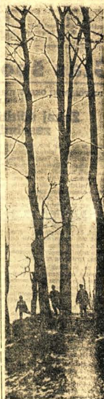
Majhnj in veliki

Neprimeren prostor so tudi najslabša stran knjižnic v jeseniški občini, kjer ima skupaj z vaškimi knjižnicami tudi matična premanjše in neuhijonske prostore. V krajevnih knjižnicah delajo knjižničarji - volonterji, s katerimi je ma-