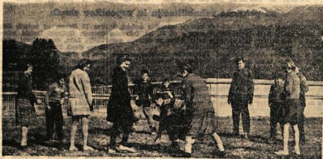
Ker osnovna šola v Cerkljah nima primerne telovadnice, se tamošnji šolarji s pridom poslužujejo igrišča za Zadruginim domom. Igre na prostem pa prihajajo v poštev le, kadar je toplo sončno vreme.

Jesenice, 13. februarja - Občinski odbor Ljudske tehnike na Jesenicah je za danes zvečer sklical redno letno skupščino v Delavskem domu, kjer bo podal svoje obračun. Dejavnost Ljudske tehnike na Jesenicah zajema 5 društev Ljudske tehnike, 3 avto-moto društva, 1 radioamaterski klub, 1 foto-klub, 1 aro klub, 1 društvo izumiteljev tehničnih izboljšav in 12 šolskih klubov Ljudske tehnike. Na skupščini se bodo pogovorili predvsem o delu za leto in o razširitvi dejavnosti na delovne kolektive in stanovanjske skupnosti.