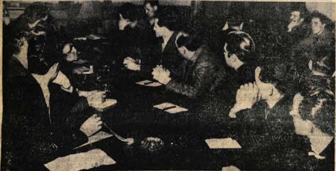
S plenuma ObSS Radovljica v dvorani občinskega ljudskega odbora

Izobraževanje bo potekalo v dveh smereh: praktično na delovnem mestu in v Centru, kjer se bodo razen mladine izobraževali in izpopolnjevali tudi odrasli, in sicer za vsa delovna mesta. Največji del na novo vključenih delavcev pa bo seveda iz vrst mladine. Vsako leto naj bi se za trgovski poklic odločilo povprečno (Nadaljevanje na 2. strani)