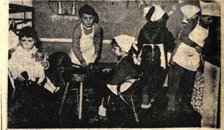
Saj to je pravcata kuharska šola. Kuharjev in kuharic ne manjka. Kakšen bo tokratni jedilni list, sem pa pozabil vprašati.

in še kaj. Najbolj pa je pogrešal mamico in očka. Kdo bi prešel vse solze, ki so stolzele čez nje-