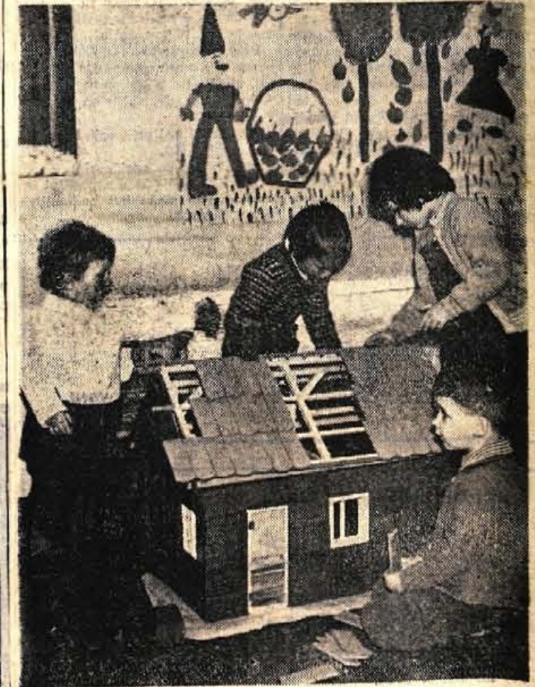
Hudo je, če te tare stanovanjska stiska. Potrpite malo! Ena, dve, tri — in hiša bo zgrajena. Kdo bo stanoval v njej? Kdo neki? Kuža, muca, pa še za nekaj lutk bo ostalo prostora

tanko tako kot mamica in očka. Kakšen je pravzaprav njegov delavnik? — Nekako mesec je tega, gova okrogla liča? Pa se je v čudotvornem fantazijskem svetu kmalu znašel. Saj ima vsaka tri-