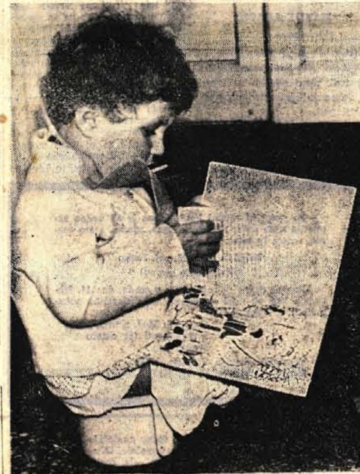
To je edina priložnost, kjer lahko človek v miru »prebere« kakšno povest...