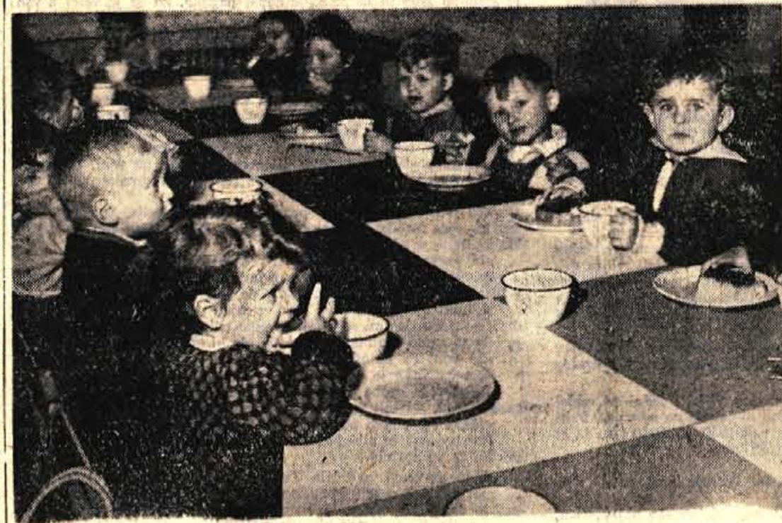
Lakota je huda stvar, ampak v vrtcu jo uspešno preganjajo z izdatnimi malicami in južnami

Namen tega pisanja pa bi bil prav gotovo zgrožen, če bi pripovedoval o težavah in nevšečnostih, s katerimi se bori vodstvo vrta. Pomudimo se rajši pri otrocih, ki so dobili v tem okolju prijetno in gostoljubno domovanje. — Nekateri prihajajo v vrtec že pred šesto uro zjutraj, drugi kasneje. Mamice in očete so v službi, zato ne kaže puščati radovednih malčkov samih doma. Matere nekaterih otrok niso zaposlene, pa vendar pošiljajo otroke v vrtec. Otrok dobi tu primerno vzgojo, živi v prijetni družini in se zabava povsem drugače kot doma.