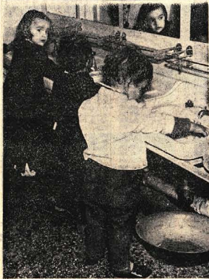
Osebna higiena je tudi nekaj vredna! Odrasli pravijo, da bi bilo hudo napak, če bi sedli k matici z umazanimi rokami.

Ne pripovedujem vam pravljice. Zares ne! Posredoval vam bom le nekaj bežnih vtisov iz vrta »Tatjane Odarjeve« v Kranju.