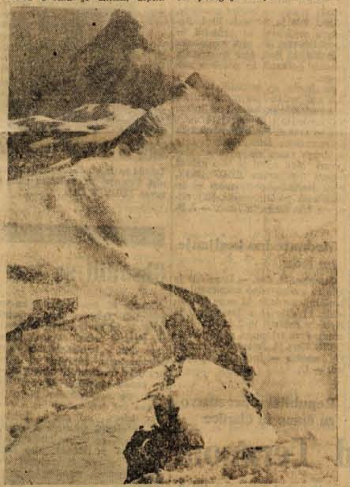
SAMO PREKO DOMAČIH ZASNEŽENIH STEN IN VRHOV VODI POT V ALPE, NA KAVKAZ, V HIMALAJO IN ANDE - Z zimskega vzpona na Triglav (spodaj Kredarica, v ozadju Rjavina)

Za obrat Polica pri Naklem V pošte pridejo osebe iz bližnje okolice Nakla in relacij Tržič oziroma Jesenice. Osebnj prejemki po pravilniku o delitvi osebnih dohodkov. Interesenti naj se pisмено ali osebno zglasijo v upravi podjetja.