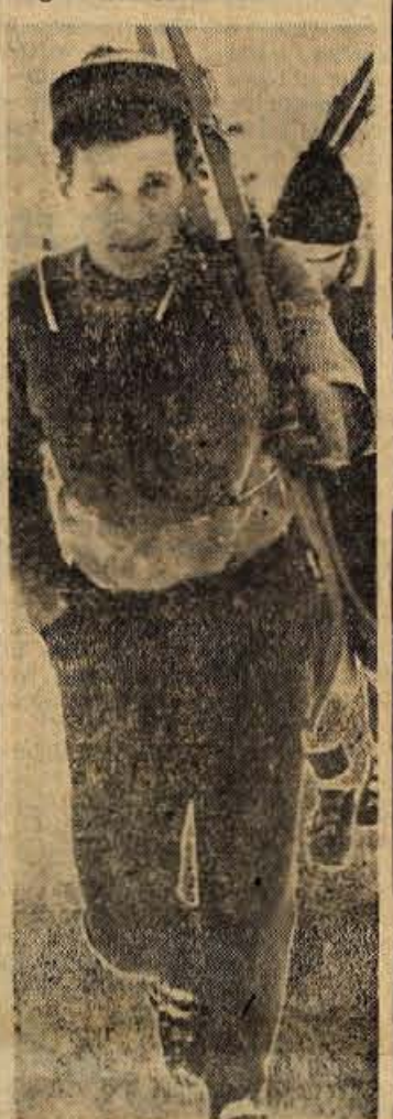
Takole se je ob 80-metrski skakalnici vzpenjal na zaletišče zmagovalcev LUDVIK ZAJC

tos. Daljave danes še niso bile prav velike, manjkalo pa tudi ni nekaj nezanesljivosti v zraku in lažjih poškodb. Temu pa je bil vzrok tudi hud mraz, počasen sneg in trda skakalnica.