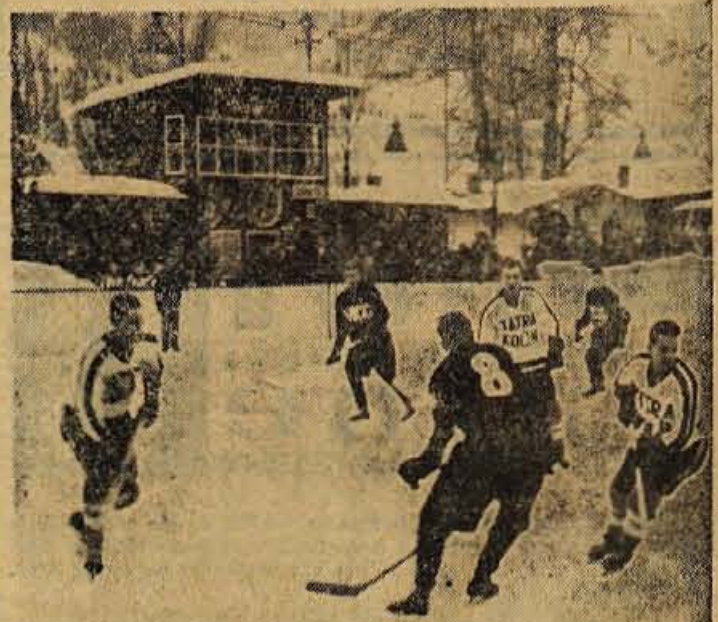
Včerajšnja tekma med hokejisti Kranjske gore in Tatre iz Kolina