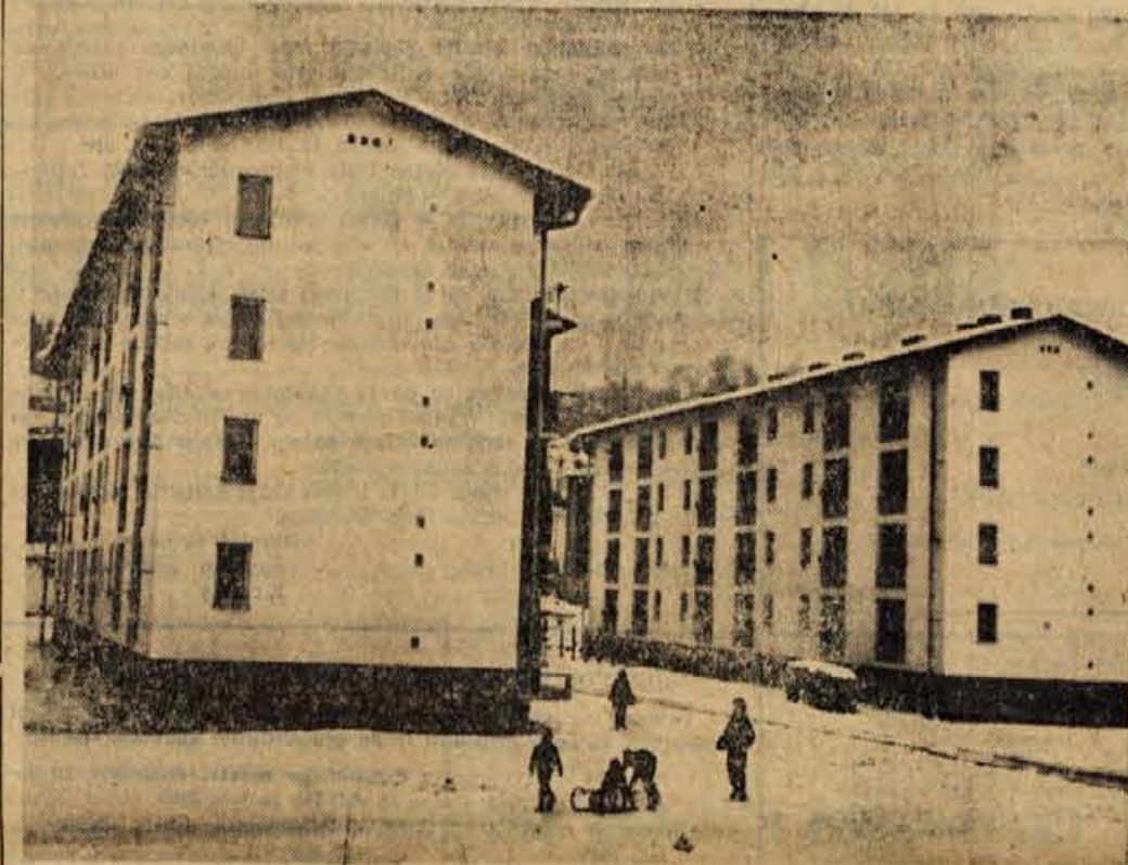
Na »Novem svetu« v Škofji Loki so številni občani že dobili nova stanovanja, v gradnji pa so že tudi novi stanovanjski bloki

Nedelja, 23. decembra — ob 9.30, 17. in 20. uri v kinu Sora jugoslovanski film »Poklicali so tudi 5. c.«