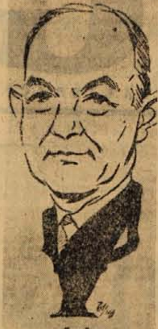
Ameriški zunanji minister RUSK

potem je zadnji čas, da se iz Atlantske palače na Seini odpelje apostol Dullesove vojaške zapovedi - množičnega maščevanja. To zasedanje je potemtakem zamisljeno tudi s scenjskim vložkom znamenjave generalov, ki iz pariške