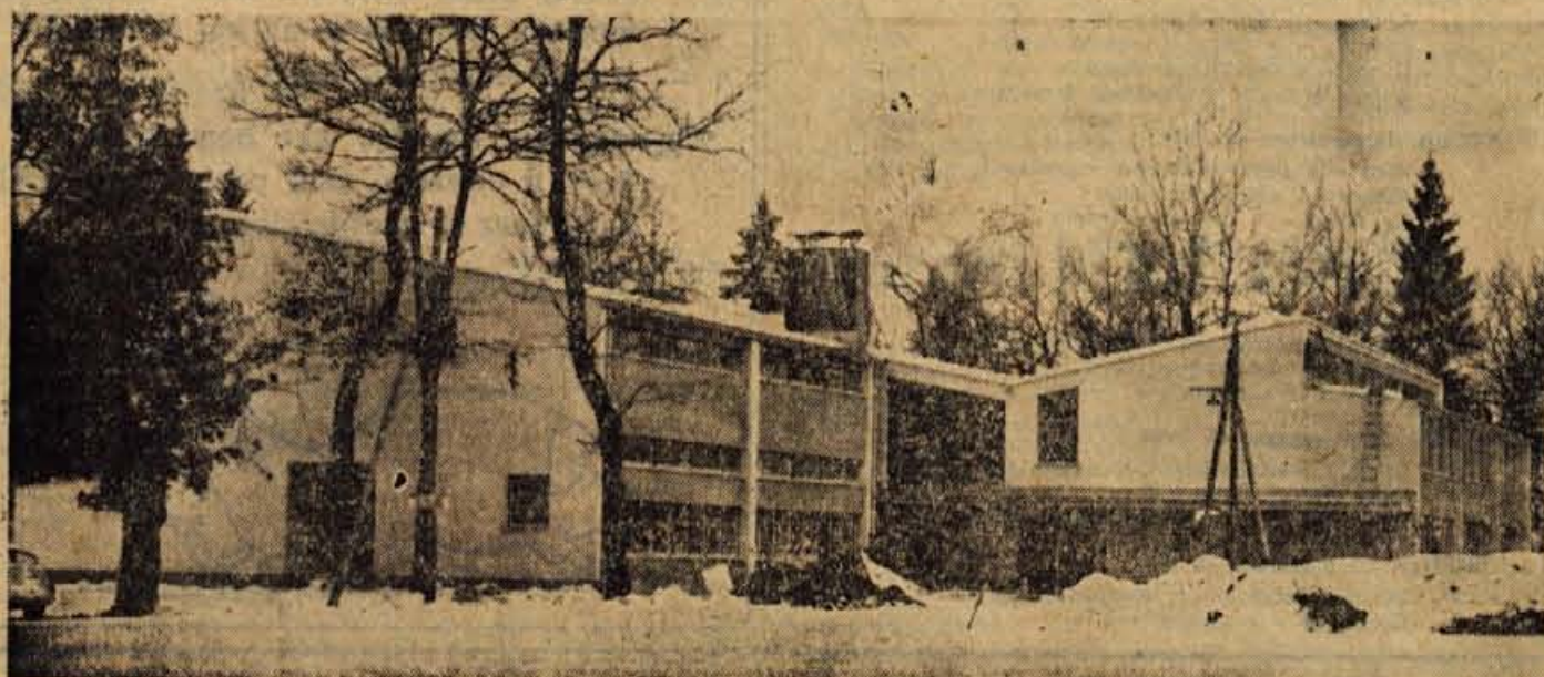
V torek popolne — pred slavnostno sejo ObLO Škofja Loka v počaslitve občinskega praznika — bo na Trati otvoritev nove šole

osemletko, brez notranje opreme, je bilo potrebnih 105 milijonov dinarjev, ki so jih v glavnem zagotovile škofjeloške gospodarske organizacije. Med drugimi so za gradnjo nove šole dali: LTH 15