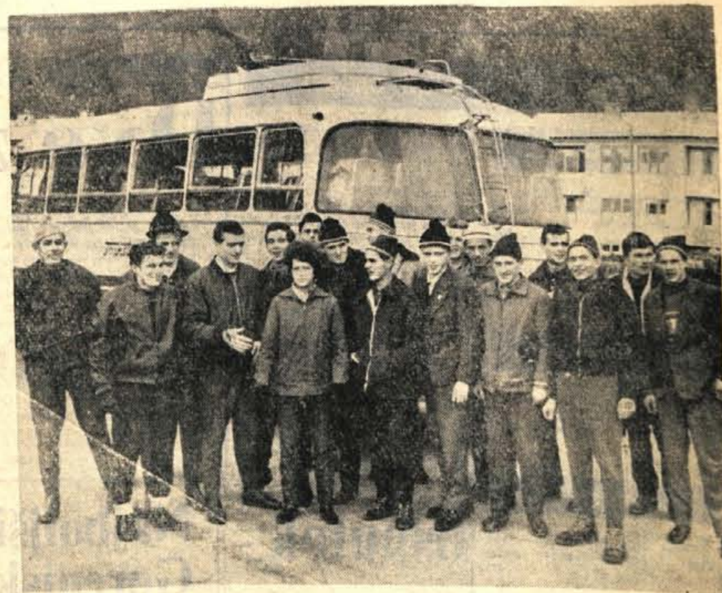
Smučarska zveza Slovenije je za mlade smučarje tekače organizirala skupni trening na Pokljuki. Pred odhodom jih je naš fotoreporter posnel v Gorjah. Trening vodi poljski trener Kobylanski. Najprej so nameravali na Velo polje, sedaj pa so snežne razmere na Pokljuki za trening zadovoljive.

Mladinci Triglava so v predtekmi s svobodasi igrali neodločeno 2:2. — J. Z.