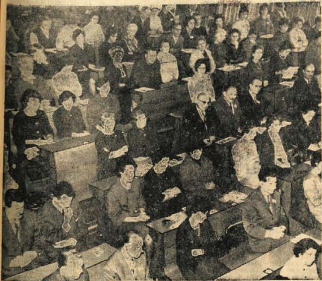
Med zasedanjem slovenskih knjižničarjev

GLASILO SOCIALISTIČNE ZVEZE DELOVNEGA LJUDSTVA ZA GORENJSKO