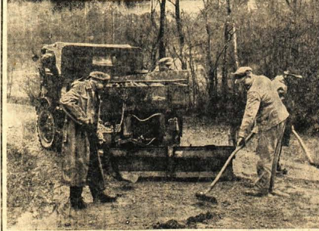
Te dni urejajo cesto med Kamno gorico in Lancovem. S temi deli bo cesta v glavnem tudi pripravljena za asfaltiranje, kar pa bodo naredili prihodnje leto