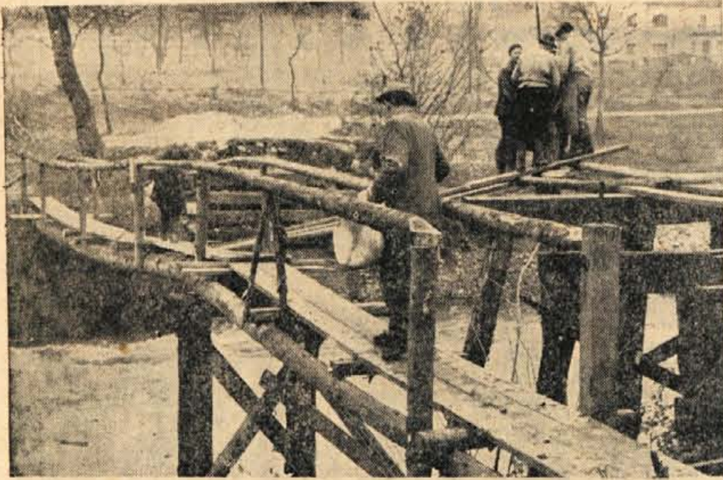
V Retanjah pri Trzihu se je zadeva okoli gradnje novega mostu vendarle premaknila. Začasno so uredili vsaj približno zavarovano zaslonno brv, medtem ko so se že lotili tudi gradnje večjega lesenega mosta. Tudi novi lesen most pa bo le začasen, saj je predvideno, da bo v tem predelu v bližnji prihodnosti potrebno zgraditi večji betonski most