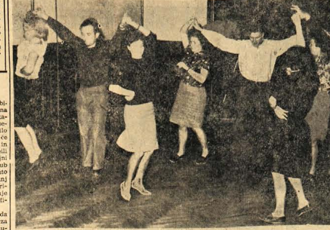
Folklorna skupina Jeseniške »Svobode« ima v zadnjem času zelo pogoste vaje. Mladi plesavci-amaterji se pripravljajo na številne prireditve, ki jih bodo imeli v okviru praznovanja ob dnevu republike, razen tega pa so sedaj v dogovoru tudi za morebitno gostovanje v Franciji

V nedeljo, 11. novembra, je bila v Skofji Loki letna skupščina ZROP škofjeloške občine, na kateri so kritično pregledali dosedanje delo in ugotovili, da bi bilo delo te organizacije še boljše, če bi pri delu sodelovali vsi člani in ne samo nekateri in če bi bili krajevni odbori bolj samostojni pri svojih prizadevanjih. Kljub temu je ZROP priredilo vrsto uspešnih predavanj, tekmovanj itd., jeseni pa so si ogledali prikaz napada na Turjak. Združenje zajema danes vse rezervne oficirje in podoficirje v občini. Na skupščini so poudarili, da bo treba v prihodnje program za delo bolje pripraviti in prestrukturirati, prilagoditi pa bo treba k delu tudi več mlajših ljudi. Ob koncu so izvolili novo 17-člansko uredništvo ZROP. — J. K.