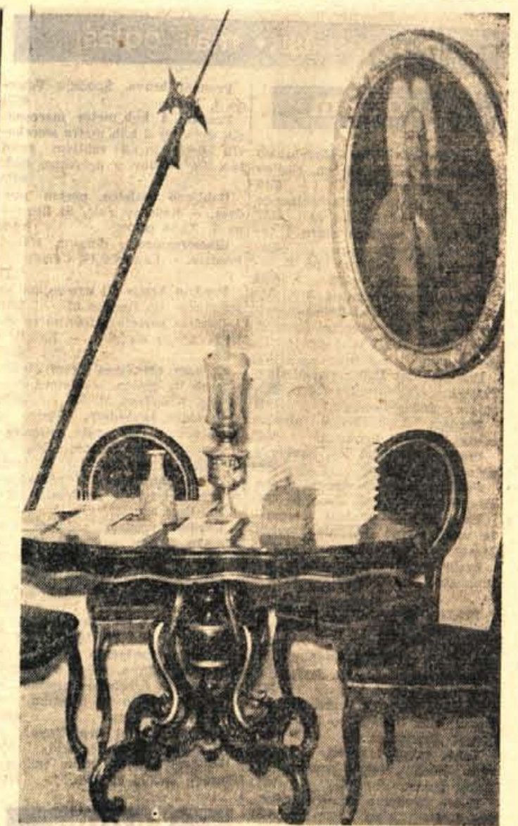
Razstava del gorenjskih javnih delavcev