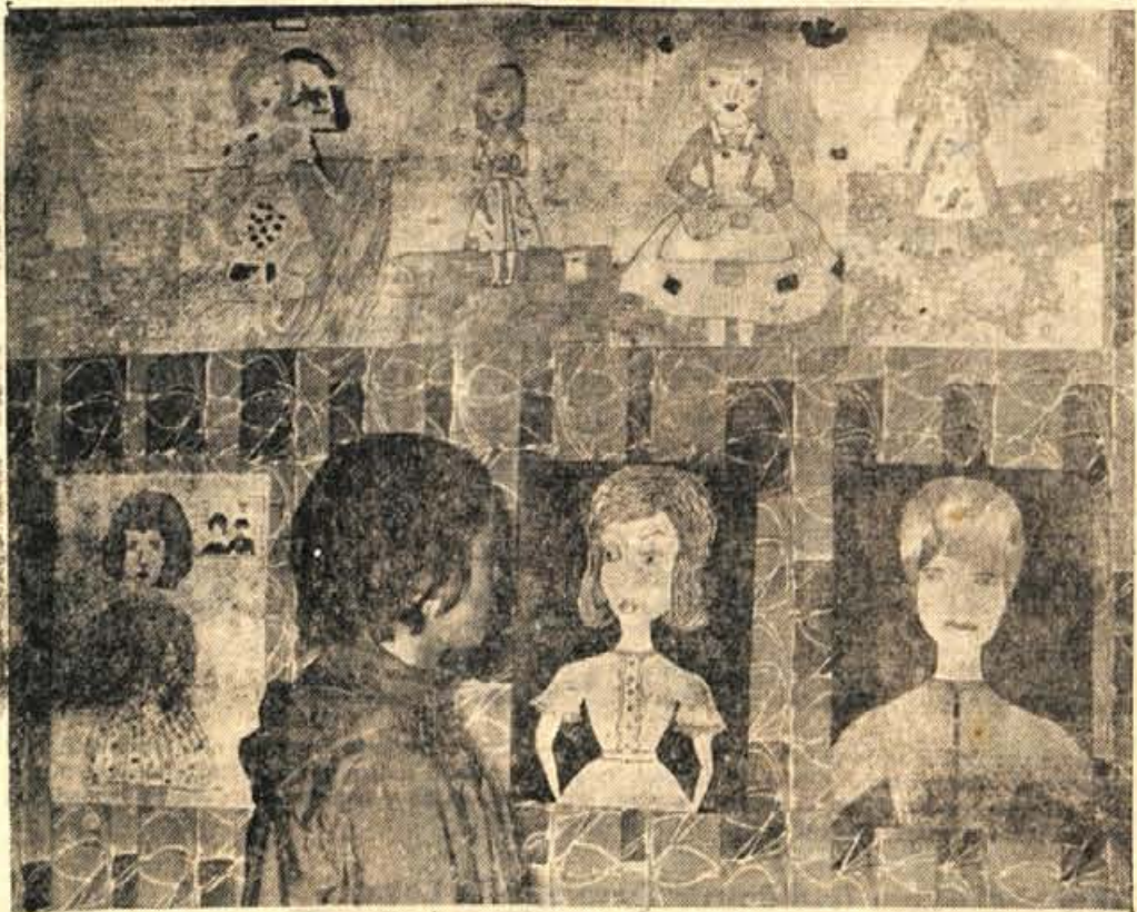
Z razstave del članov krožka za likovno vzgojo, ki deluje v okviru centra za estetsko vzgojo pri pionirski knjižnici

Komisija za sklepe si je vsak problem vseh 41 diskutantov navedeno zabeležila. Zbrano gradivo bo dalo veliko dela za prihodnje leto (morda tudi za daljše obdobje), treba bo najti le dober sistem, da bodo vse izrečene misli našle pot tudi do tistih mladincev, ki zanje niso zvedeli na konferenci, in obliki sodelovanja članov mladinske organizacije v drugih družbeno-političnih in samoupravnih organih, ki bodo kranjski mladinci pomagali urediti nemajhne naloge. — Kot prvo bo občinski komitej vse najpomembnejše naloge z več variantami njihovih rešitev izdal v posebnih brošurah, ki bo nekakšen aktivistični priročnik za delo mladinske organizacije. — J. Z.