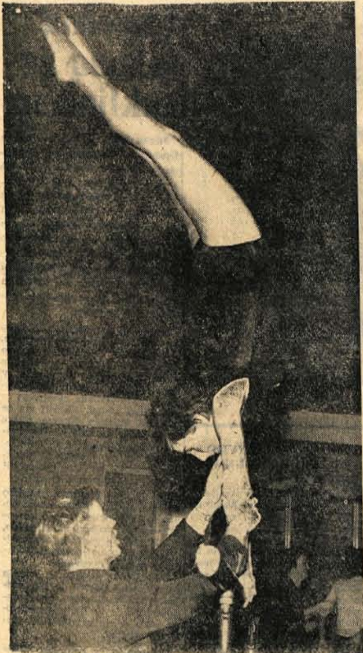
V telovadnici v Križah je bil včeraj pregledni nastop gorenjskih orodnih telovadcev. Udeležili so se ga mladi tekmovalci iz sedmih društev.