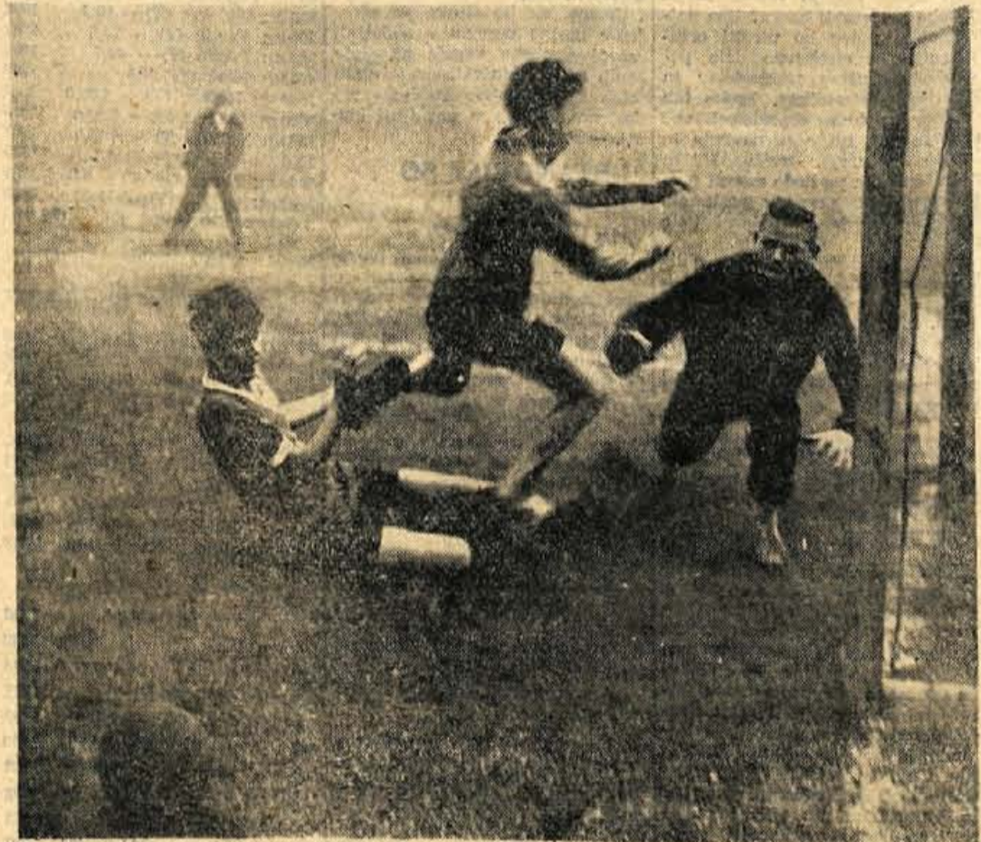
Na igrišču v Besnici je bil včeraj (prvič na Gorenjskem) turnir v malem nogometu, ki bo prav gotovo kmalu postal priljubljen.