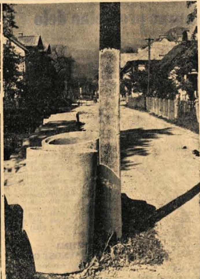
Odkar so ukinili jeseniško in beliško pokopališče prevažajo vse na novo pokopališče na Blejski Dobravi, ki ima izredno lepo lego. Zalpa je cesta skozi Blejsko Dobravo skrajno zanemarjena, kar dokazuje naš posnetek. Čas bi bil, da se pred zimo dokončajo novi odcep ceste od dobravškega vialdukta do pokopališča

Vprašali bi se samo, kdo bo kriv in kdo bo trpel posledice sprejetega sklepa? Krivce bodo ugotovili bržkone sami kmetje, ko bodo posledice občutili na lastni koži. Samo primer. Kmet, ki poseka 50 kubikov lesa v I. razredu, plača samo progresije 55.000 dinarjev in 1000 din prometnega davka na kubik, kar znaša v tem primeru nad 2000 dinarjev od kubičnega metra. Če ne kooperira z GG Bled, sčasoma bodo kmetje vsekakor »hvaležni« zadrugnemu svetu za sprejeti sklep. — Stane Škrabar