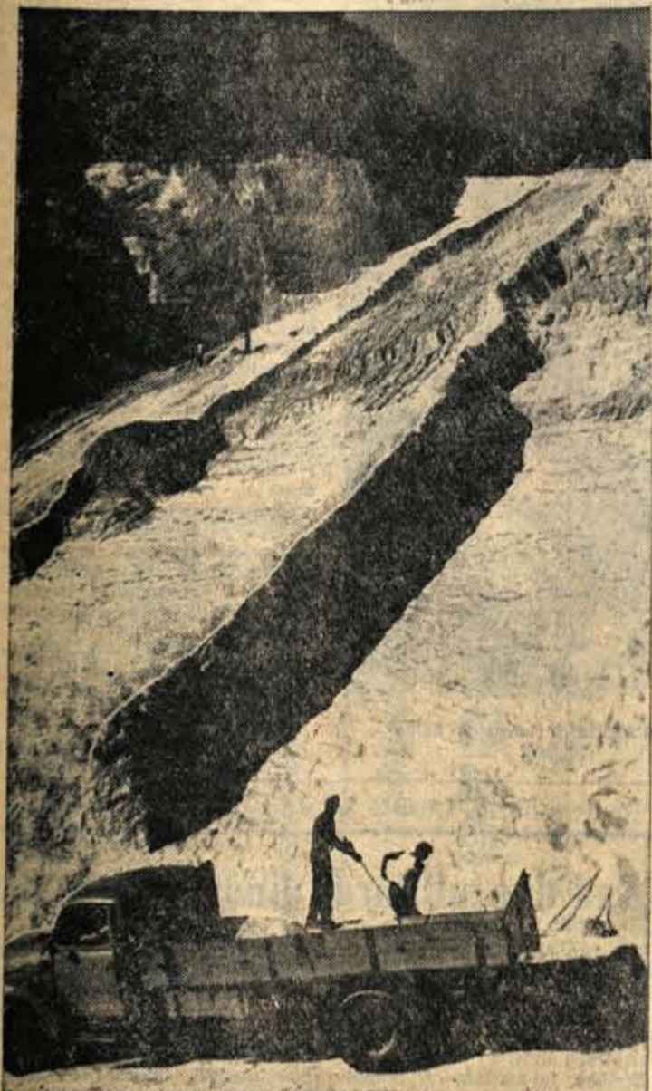
Beli pesek iz kamnoloma Komunalnega podjetja v Trliču je na tržišču precej iskan. Zaradi tega ga Komunalno podjetje precej proda tudi v druge kraje izven meja svoje občine. Precej pogosti interesenti za beli pesek so zlasti tisti, ki se povsod pripravljajo, da bi za dan mrtvih čim boljše okrasili grobove, spomenike in spominska obeležja

GLASILO SOCIALISTIČNE ZVEZE DELOVNEGA LJUDSTVA ZA GORENJSKO