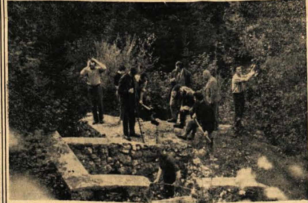
Jeseniški livarji pri čiščenju prve livarne nad Nomenjem

Z željo, da bi poživili delo potrošniških svetov in dali krajnjim in stanovanjskim skupnostim možnost delovanja na širšem področju, so sprejeli odlok o prenosu zadev svetov potrošnikov v pristojnost stanovanjskih in krajnjih skupnosti. — P. U.