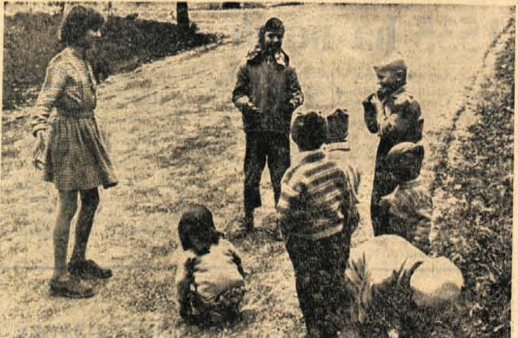
Otroci se najraje igrajo na cesti ali ob njej, seveda le tedaj, če nimajo privlačnega igrišča ali njihovi

V omenjenem načrtu je bila tudi nadgradnja dela hotela »Park« na Bledu, s čimer bi pridobili 113 postelj v ogrevanih sobah, in preureditev hotela Trati v depandanzni hotela »Toplice«. Vendar pa so bili na ponedeljkovem posvetovanju turističnih delavcev in urbanistov na Bledu urbanisti proti temu predlogu, češ da je predvideno, da bodo v daljni prihodnosti te objekte porušili. — M. S.