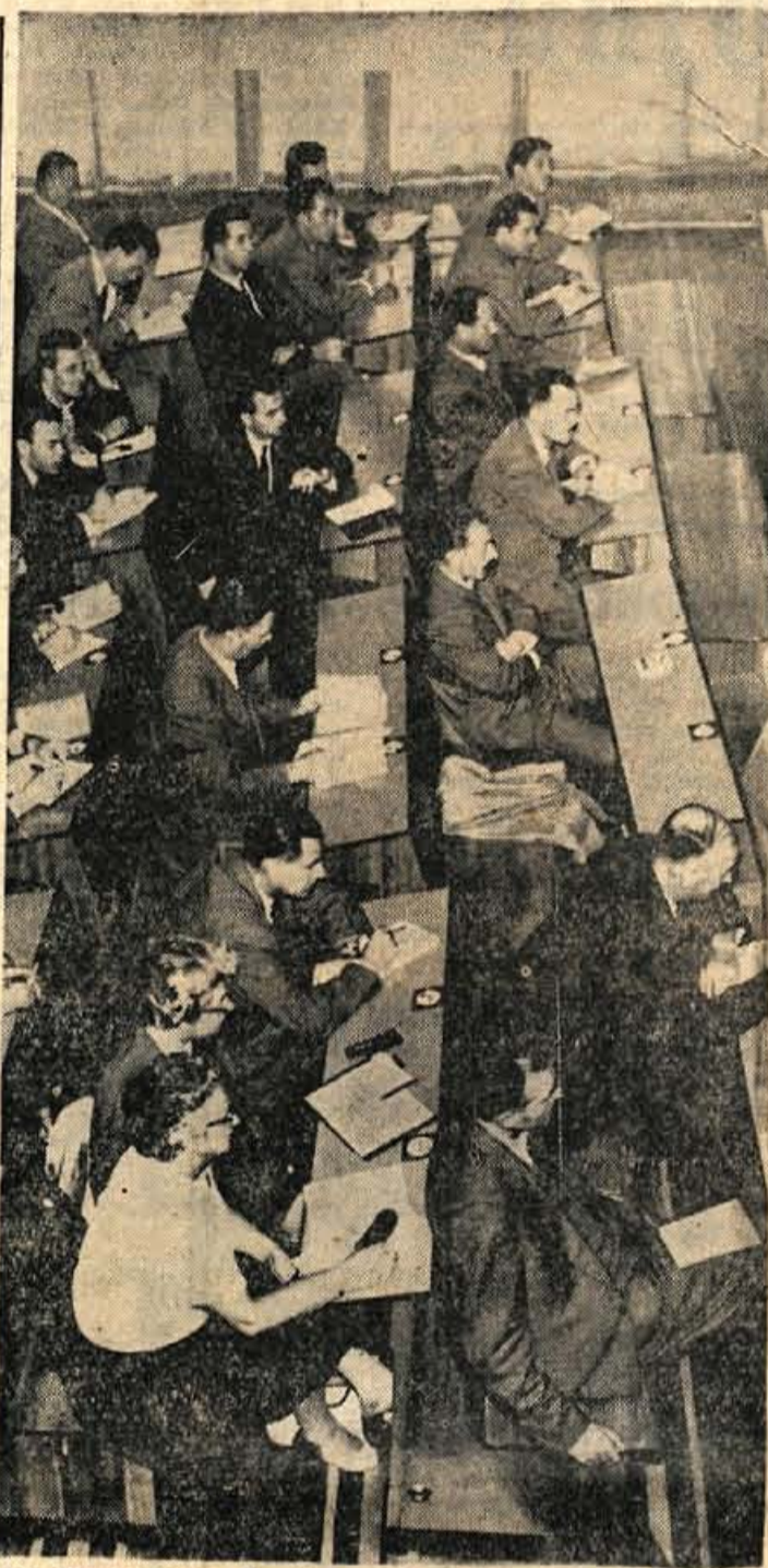
Del dvorane OLO v Kranju v udeleženci seminarja o predosnutku ustave FSRJ

V razpravi so zlasti govorili o specializaciji posameznih dejavnosti in o nekaterih težavah v tem pogledu. — M.