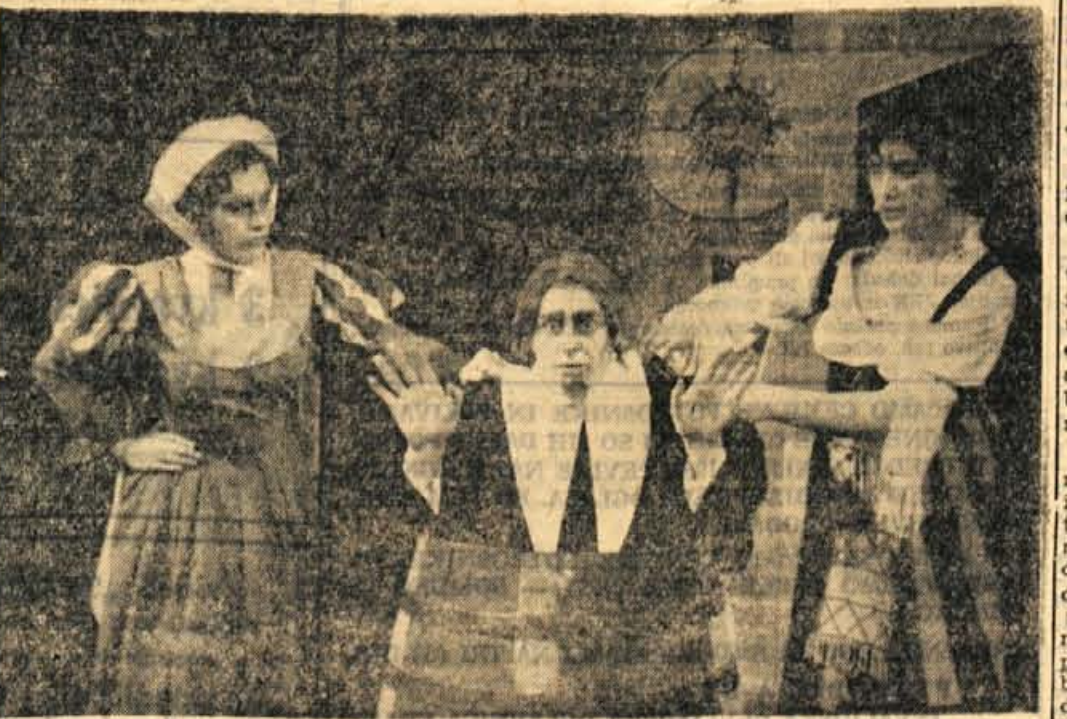
Prizor iz komedije Marina Držiča »Tripče de Utolče« v uprizoritvi Čufarjevega gledališča