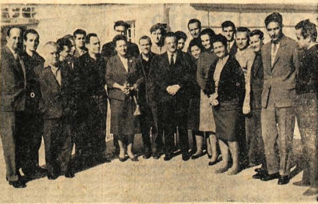
V četrtek, 11. oktobra, okrog 11. ure je obiskal izobraževalno-rekreacijski center v Podvinu podpredsednik zveznega izvršnega sveta, Edvard Kardelj s soprogo. Ogladal si je prostore in se seznanil z namenom tega centra. Nato se je nekaj časa pogovarjal s slušateljki višje kadrovske šole, ki imajo trenutno seminar v Podvinu. Na sliki: tovariš Edvard Kardelj in soproga s slušateljki višje kadrovske šole

Pogovorili so se o razvoju maloobmejnega prometa, o izdajanju (Nadaljevanje na 2. strani)