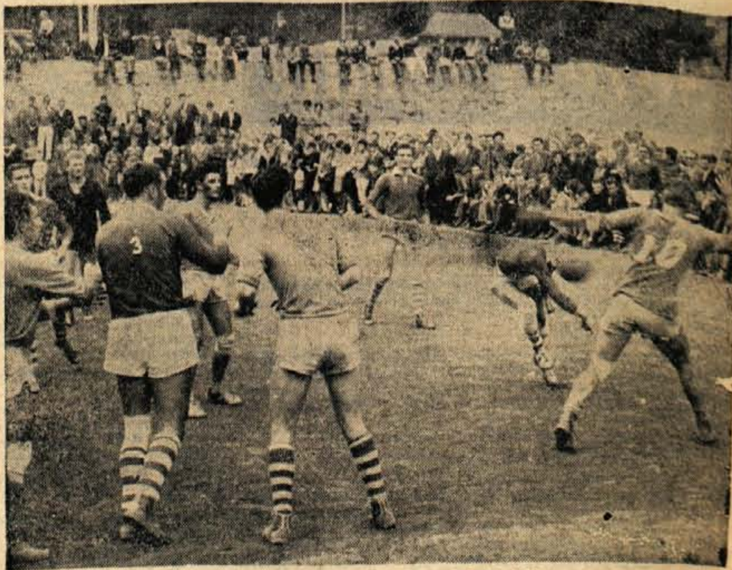
Bera gorenjskih predstavnikov v rokometni ligi je bila večera le 2 točki

Gorenjska liga TRŽIC B : SAVA 17:15 (7:9) Tržič, 7. oktobra - Oslabljena ekipa gostov je bila enakovredna domačim, ki so si zagotovili zmago šele v zadnjih minutah.