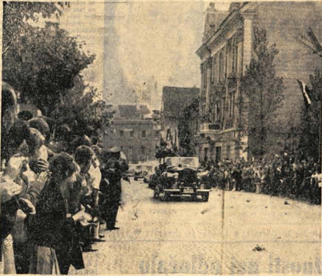
Kranjčani pozdravljajo visoke goste