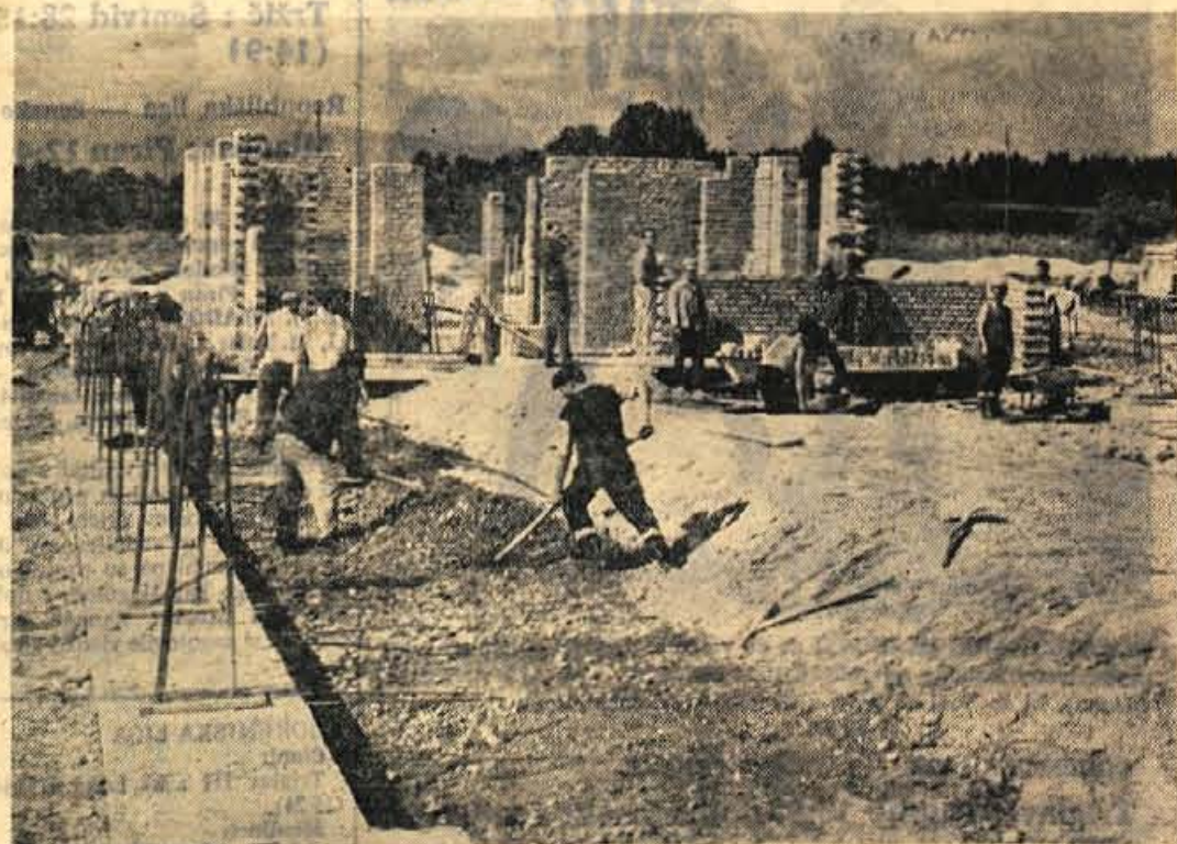
Z gradnjo nove šole v Senčurju so začeli šele pred kratkim, vendar dela na zadovoljstvo vaščanov potekajo dokaj hitro