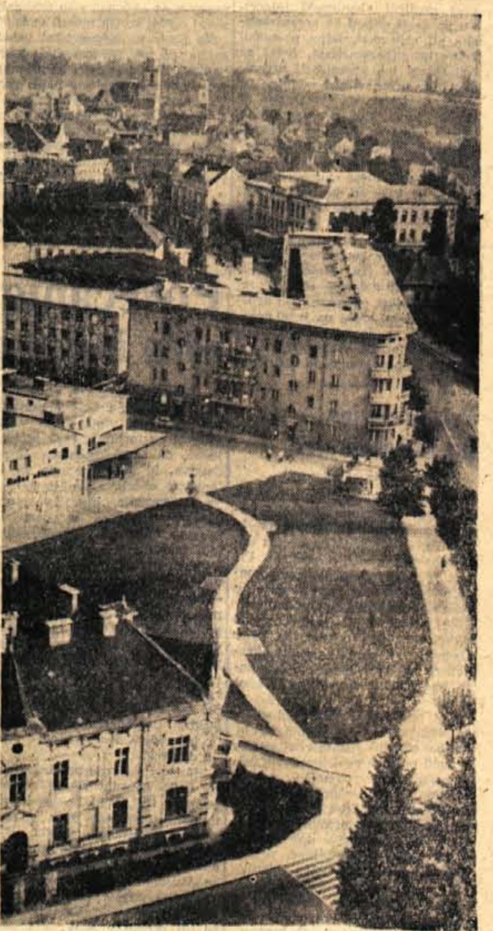
Z vrha nebotičnika se odpira nov pogled na Kranj

Republiška proslava 20-letnice pionirske organizacije bo ob koncu meseca decembra v Ljubljani. Ob tej priložnosti bodo v SPORNEM PARKU INZ. STANKA BLOUDKA odkrili SPOMENIK PIONIRJU REVOLUCIONARJU. Z Gorenjskega se bo te proslave udeležilo 69 pionirjev, ki so bili za to izvoljeni na posebnih pionirskih konferencah. — M. S.