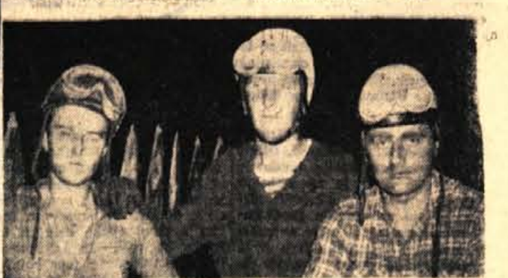
Nedeljski ljubljanski I. mednarodni moto-cross je bil za številne gledavce nepisno doživljaj. Med Tržičani in tudi drugimi, so pogovori o nedeljski prireditvi še vedno zelo pogosti in raznih komentarjev verjetno še ne bo kmalu konec. Zlasti obširne razprave so med prireditelji. »Krstina« predstava je namreč pokazala, da je ljubljanska moto-cross steza primeriva tudi za največje tovrstne prireditve, seveda z nekaterimi izboljšavami, kar brez pomislekov zagotavlja lepo perspektivo AMD Tržič. Brezine bo imel prireditelj v prihodnje največji problem z gledavci. Že v nedeljo je bil prostor zanje skoraj premahnen, spričo uspele prireditve in vse večjega zanimanja za moto-cross pa bo zaradi tega v prihodnje še večji problem. - Na sliki: Edini slovenski tekmovalci, ki so se tudi udeležili I. ljubljanskega mednarodnega moto-cross tekmovalja. Od leve proti desni: Ciril Lipavec (Jesenice), Anton Stare (Cerklje) in Janez Rotar (Tržič)

Tekmovalje je bilo nezanimivo predvsem zaradi maloštevilne udeležbe. Na tekmovalju je zmagala Slovenija s 180 točkami pred Hrvatsko in Srbijo. - P. Klavara