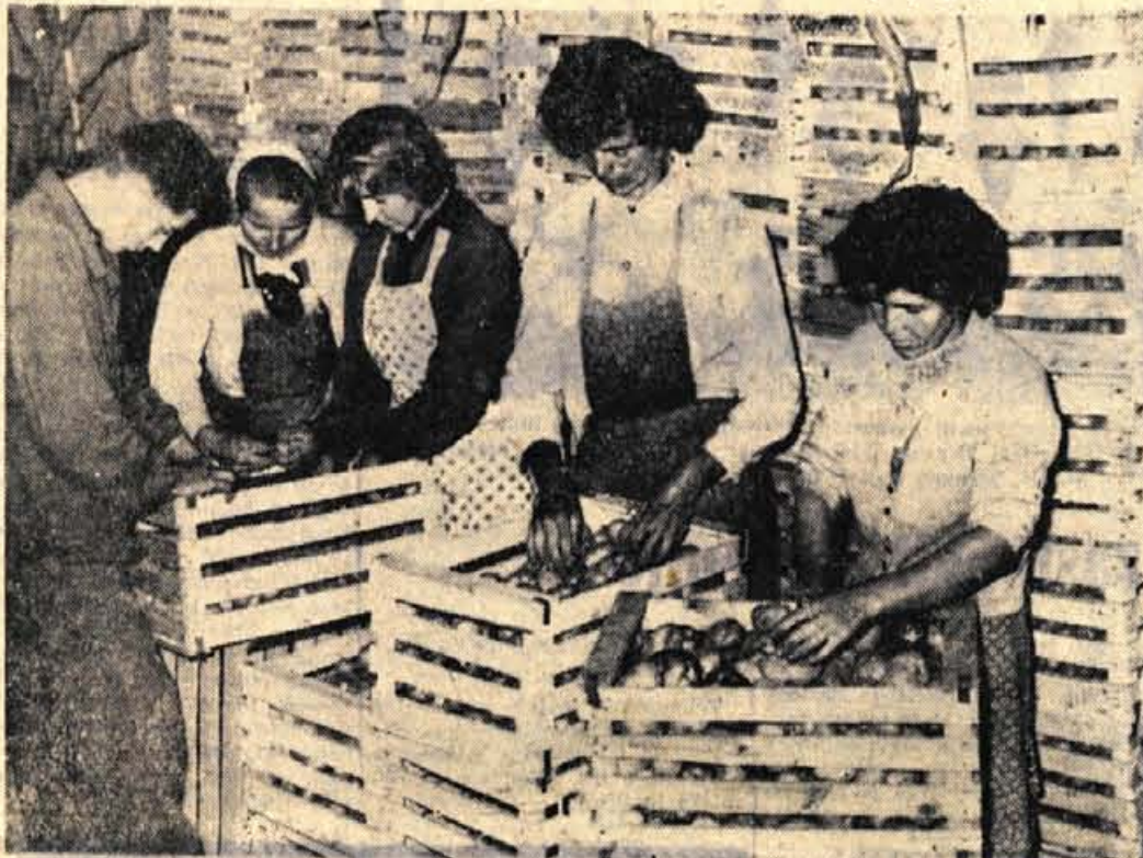
Na obratu KG v Cerkljah so letos prvič pridelali tudi večje količine posebnega krompirja križanca. Nima se imena in ga označujejo kar z »1/38«. Pridelali so ga približno 23.000 kg po hektarju. Ze to je lep uspeh. Glavna njegova prednost pa je v tem, da ima zelo svetlo belo meso, kot pravijo, in da je izredno okusen. Zato ga bodo v večini pridržali za seme

Obravnava je ugotovila, da je prisvojil v času od junija 1950 do maja letos postopoma 618.735 dinarjev. Prisvojitev tako visokega zneska mu je omogočila postopno ponarejanje dnevnih poročil, na katerih je izmenično sam tudi brez dovoljenja podpisal po dva odgovorna finančna uslužbenca svojega podjetja. S tem je razen poneverb zakrivil še kaznivo dejanje ponarejanja listin. Sodišče je K. sicer akuzal prepričati, da je poneveril skupnes le okoli pol milijona dinarjev, kar pa mu je finančni izvedenec — s dokazi ovrget zagovor. Je priznal, da je poneveril vseh 618.735 dinarjev, zaradi česar ga je sodišče obsodilo na 4 leta in 6 mesecev strogega zaporu in seveda tudi na povračilo poneverjenega denarja podjetju. Sodišče je pri odločanju kazni upoštevalo kot oteževalno okolnost dejstvo, da je K. izrazil nagnjen h kaznivim dejanjem iz koristljubja.