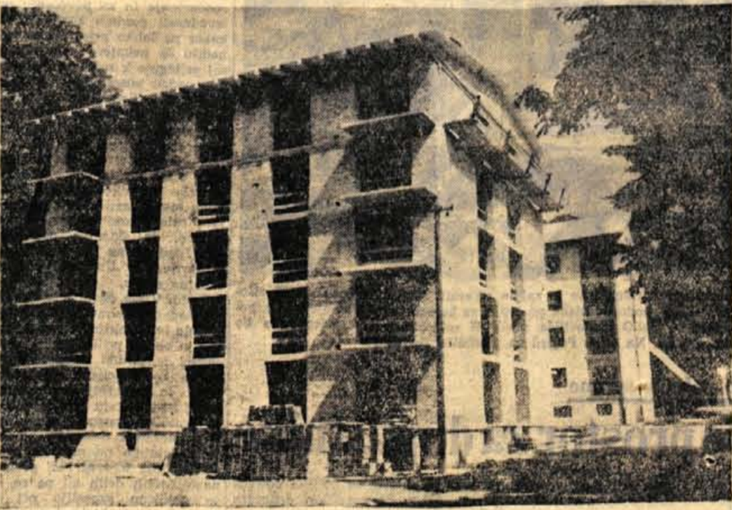
Na Koroški Beli bo stanovanjski blok za monterje novih strojev in valjarni na Belškem polju kmalu gotov. V njem bodo predvsem samska stanovanja

ur, ne drži popolnoma. Če bi delo pravilno razdelili, bi moralo tudi točasoma odpasti. Prav zato jeseniški zavodi daleč prednjačijo v osebnih dohodkih nad republiškim povprečjem. Nekateri, kot so gledališče, ljudska knjižnica itd. pa so pod republiškim povprečjem. Zato bodo morali zavodi v najkrajšem času uskladiti osebne dohodke s splošnim stanjem in le na podlagi povečanja števil uslug ter boljše kvalitete dela opravičiti sorazmerno visoke osebne dohodke. — M. Z.