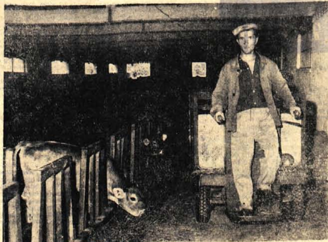
Kadar živali stišijo brnenje električnega vozička, vedo, da prihaja »kosilo«. V hlevih kmetijskega gospodarstva je vse zelo mehanizirano, kar olajša delo in povečuje proizvodnost.