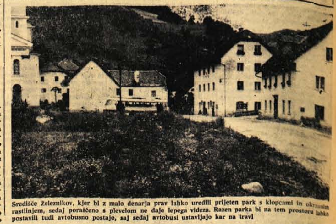
Središče Zeleznikov, kjer bi z malo denarja prav lahko uredili prijeten park s klopami in okrasnim rastlinjem, sedaj poraščeno s plevelom ne daje lepega videza. Razen parka bi na tem prostoru lahko postavili tudi avtobusno postajo, saj sedaj avtobusi ustavljajo kar na travi

našel pravi počitek. Lep tak primer počitniške vasi bi bila Davča v Selški dolini, kjer bi dopustniki preživeli počitnice na čistem gorskem zraku, v senci smrekovih in bukovih gozdov, v želji po skodelici mleka, svežem surovem maslu in domačem kruhu, pa vse tja do cenjenega »davaškega želodca«. Tam bi šele prišla do izraza prava rekreacija delovnega človeka. Tudi drugi kmečki dvorci na Martinju vrhu, v Rovtavih, pa na drugi strani v Sorci, v Dražgošah, v Podlonku in povsod po naših gorenjskih hribih bi lahko