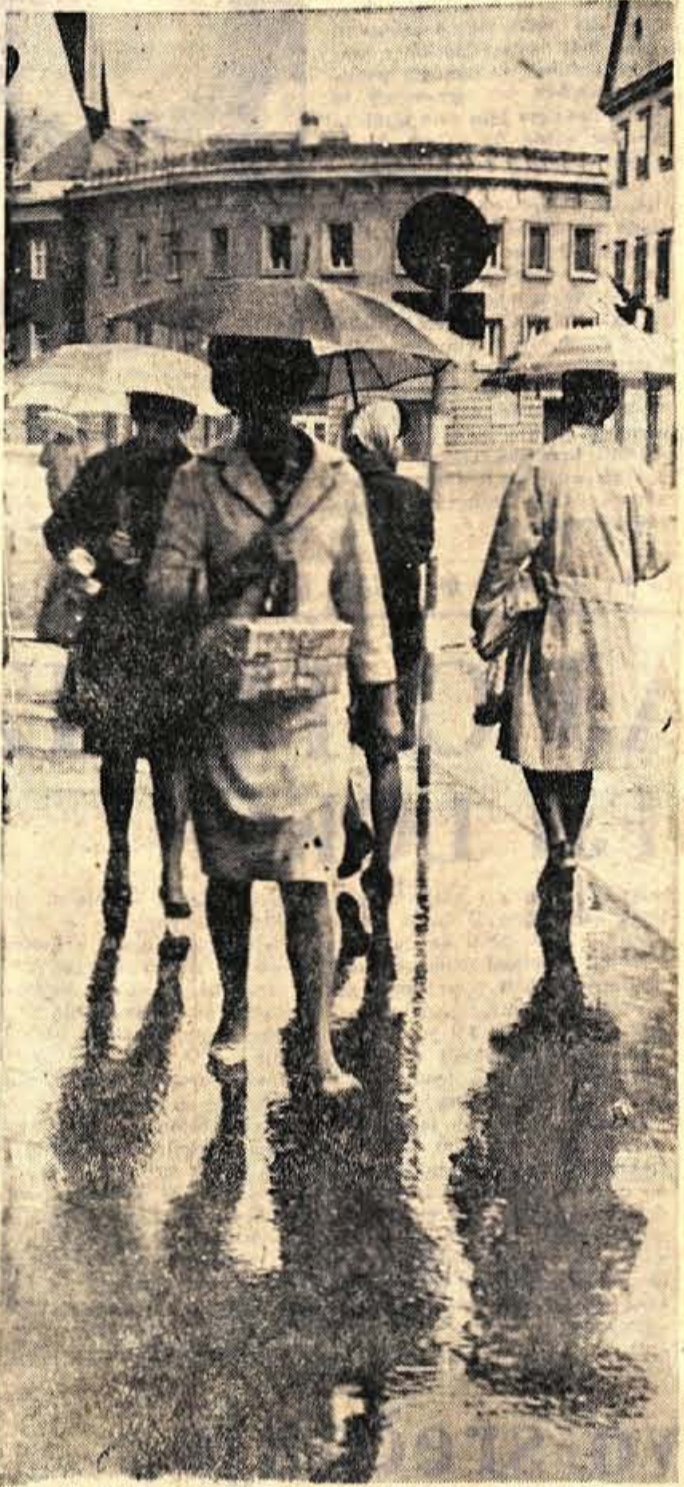
In sončni dnevi so se umaknili septembrskemu dežju. Da le ne bi bil tako trdovraten kot letošnje sušno obdobje...

Na pobudo okrajnega sindikalnega sveta so se začeli pripravljati na konferenco delavskih svetov našega okraja, ki je predvidena v mesecu oktobru. Na konferenci bodo skušali prikazati stanje in izkušnje z vsemi uspehi in težavami pri utrditvi in razvoju delavskih svetov in pri uveljavljanju njihovih pravic. Kot predvideno, bi na okrajni konferenci sodelovalo približno 150 delavskih svetov iz delavskih svetov in kolektivov. Zatem so predvidene še konferenice za ožja območja. Glavni namen teh konferenc je - medsebojno izmenjava izkušenj, kar vse naj bi služilo boljše uveljavljanje delavskih pravic in samoupravljanja. - K. M.