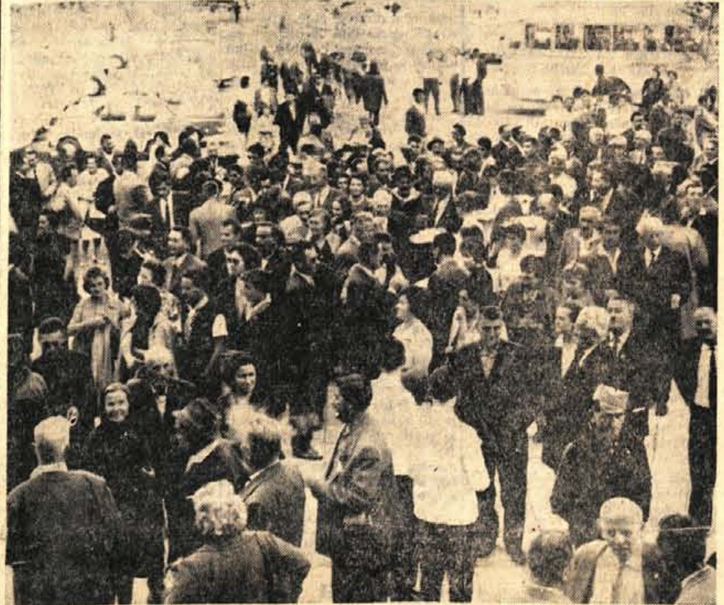
V soboto popoldne so gostje iz Srbije prispeli v Podvin, kjer so bili posebno navdušeni nad kulturnim programom in lepo okolico

Kako se bomo oskrbeli z jesenskim sadjem in zelenjavo