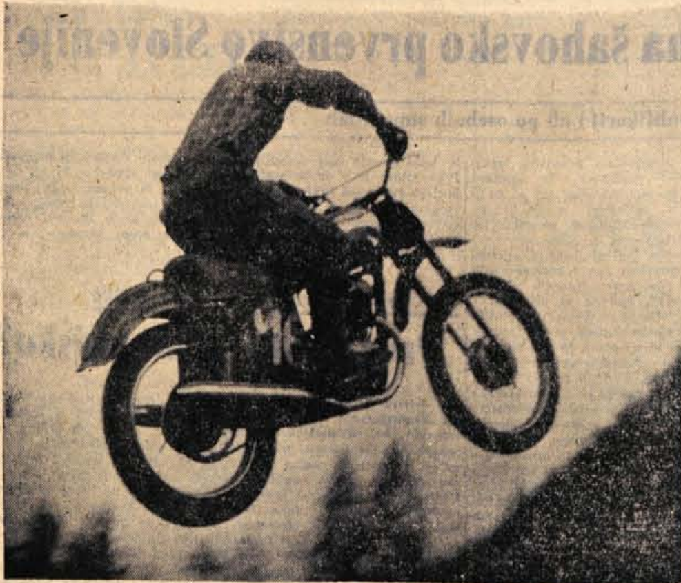
Vožnja »čez drn in strn« z motornimi kolesi je pri nas še precej neznana, vsem pa je bila všeč

Ekipna uvrstitve med srednjimi in strokovnimi solami je bila naslednja: Gimnazija Kranj 4317 točk, Gimnazija Jesenice 3253 točk, TTS iz Kranja 2853 točk. — P. Klavora