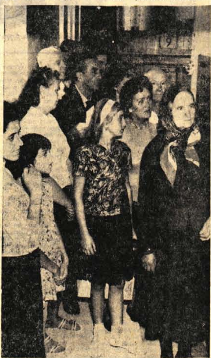
Udeleženci manifestacije »BRATSTVA IN ENOTNOSTI« so včeraj popoldne obiskali muzej talcev v Begunjah. Grozote, ki so jih Nemci prizadeli domačinom, so jih globoko pretresle

Predsednik občinskega ljudskega odbora je na zadnji seji zaprosil odbornike, naj osnutek statuta, ki so ga oni prvi dobili, temeljito proučijo. Statut bodo dobili v razpravo tudi ostali pristojni organi, zlasti še družbeno-politične organizacije. — P.