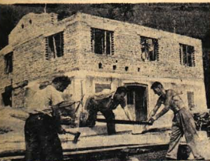
Prostori strojnega kovaštva v Poljanah nad Škofjo Loko so postali pretesni. Zato so se odločili, da bodo stavbo, kjer imajo svoje prostore dvignili za eno nadstropje. Vsa dela bodo opravili sami in z lastnimi sredstvi. Delo v delavnicah pa bodo tudi bolj mehanizirali

ELRA Škofja Loka ima konkretno osnovo, na kateri gradi upanje, da bo v prihodnjem (ali morda delno že tudi letos) letu postala izvoznik. Delovni kolektiv predvideva, da se bo do prihodnjega leta toliko usposobil, da bo v letu 1968 izvozilo za 41.200 dolarjev svojih izdelkov. Pri tem računa, da bo za 11.200 dolarjev svojih izdelkov prodal nekemu tujcemskemu podjetju, za katero še dela. Prav tako pa se že dogovarja tudi za izvoz spajkal. Teh artiklov bi lahko izvozili letno za vrednost 30 tisoč dolarjev. Z izvozom bi podjetje pričelo prihodnje leto, so pa tudi manjše