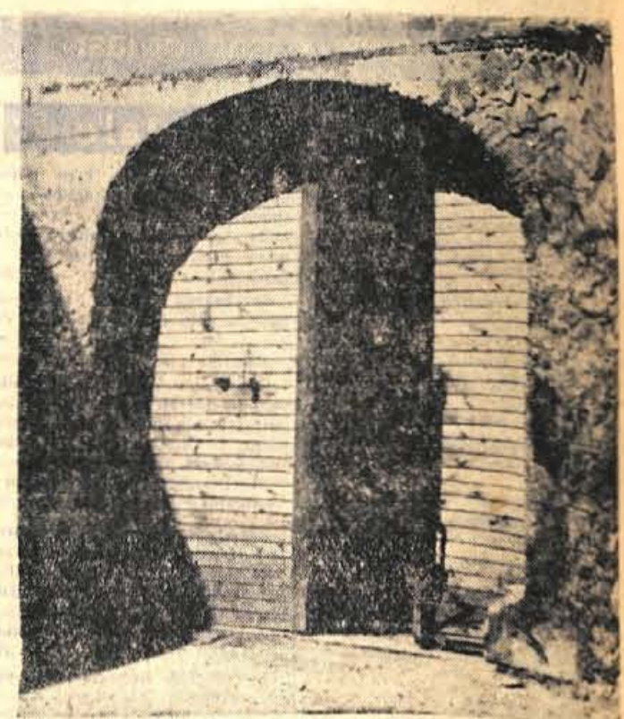
Morda bi bilo bolje, če ne bi vsem pokazali vhoda v kranjski muzej - v edini njegov prostor za eksponate - v skladišče