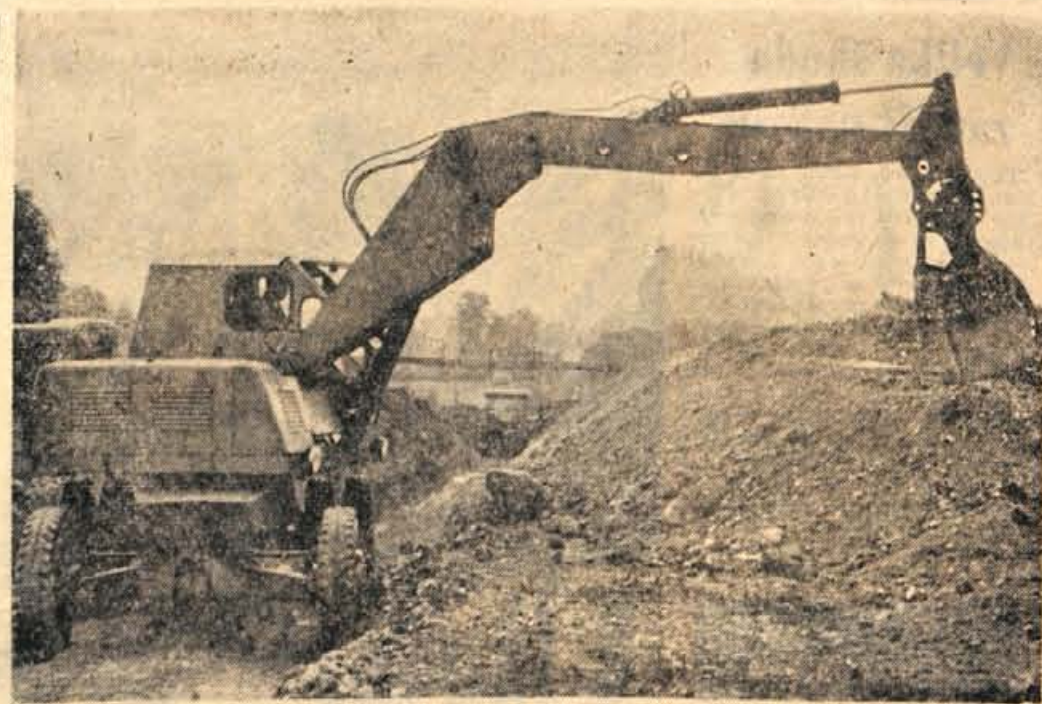
Dela za sanacijo Blejskega jezera že več kot 14 dni izvaja v Gorjah — med tunelom v Grabčah in železniško progo — delovna ekipa ljubljanskega »Tehnograda« po načrtih Zavoda za vodno gospodarstvo

Z nekoliko zamudo bodo odborniki na skupni seji razpravljali tudi o gospodarjenju škofjeloških gospodarskih organizacij v letošnjem prvem polletju. — J. Z.