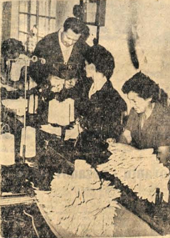
Novim delavkam, ki se pričujejo v proizvodnji rokavic v blejski tovarni čipk in vezenin gre delo vsak dan bolj izpod rok. Sedaj izdelava vsaka rokavico od začetka do konca, kasneje (z začetkom leta) pa je za proizvodnjo rokavic predviden tekoči trak

S tremi avtobusi si je v nedeljo nekaj manj kot sto upokojencev škofjeloške občine ogledalo muzej v Begunjah in grobišče v Dragi, kjer so grobove talcev okrasili s cvetjem. Razen tega so si člani loškega društva upokojencev ogledali tudi muzejske zbirke na blejskem gradu in obiskali gostilne v Ribnem. — Z.