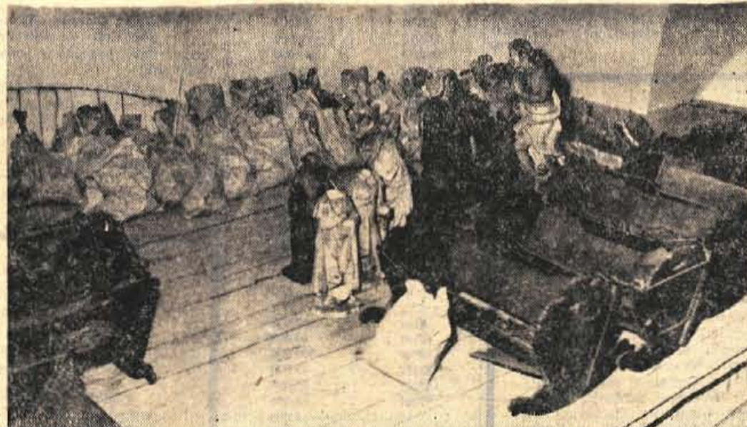
Kranjski muzej ne bi smel biti več novorojenček, čeprav ima v skladišču na voljo dovolj starih, a vendar dobro ohranjenih zibelk. Čas bi že bil, da bi za njih preskrbeli večjo posteljo v primernejših prostorih, kot jih ima muzej sedaj. - V ozadju stari Slovani v papirnih vrečkah

Skladiščanjem kranjskega muzeja pa prav gotovo zapostavljamo tudi turizem. Čeprav grede skozi Kranj - zlasti v poletnih mesecih - številni tujei, v Kranju še vedno ne znajo poskrbeti, da bi na takšen ali drugačen način vsaj za kratek čas zadržali goste. Seveda je mnogokrat težko preprečiti namen tujea, ki je sklenil, da se bo ustavil prvič šele v Ljubljani ali pa šele, ko bo zagledal morje. Z nekoliko več iznajdljivosti pa bi tudi Kranjčan lahko spremenili še tako trden sklep skozi Kranj drugega gosta. Delček k temu, čeprav v začetku bolj skromen, bi lahko deprinesel tudi primerno urejen muzej, saj je znano, da so v svetu za turiste mnogokrat prav muzeji najkrajavnejši, saj v njih lahko do podrobnosti spoznajmo kraj, v katerega so prišli. Kaj je zanimivega v Kranju, pa nihče ne zve. Če pripelje tujeec z blej-