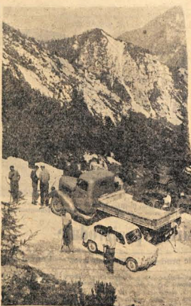
Na Vršiču se že oglašja jesen, zato je še toliko bolj mikaven. Izletnikov, turistov in planincev, kljub temu da se je treba spovzpeti 1611 metrov visoko, ne manjka

Isto noč je bil ustavljen tudi promet preko Ljubelja. Nalivi so namreč sprožili velik plaz na tamkajšnji cesti, zaradi česar so morali številni avtomobili čakati na ureditev ceste ali na Ljubelju ali pa v Tržicu. — F.