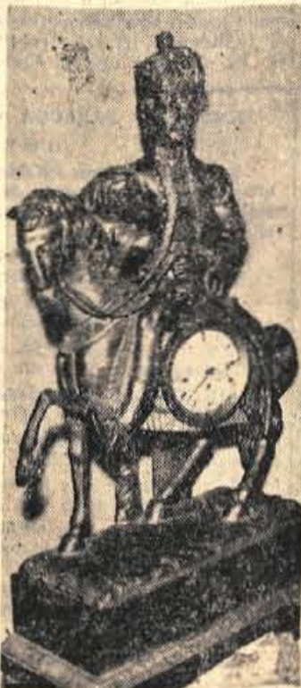
V kranjskem muzeju je uskladiščena tudi velika zbirka najrazličnejših ur. Med najzanimivejšimi je prav gotovo ura - konjenik, vendar pa imajo številne ostale ure večjo zgodovinsko vrednost.

Nilže si ne more zamisljati podjetja, ki bi leta in leta proizvajalo, proizvajalo pa samo zato, da bi napolnilo skladišče. - Zaradi »proizvodnosti« kranjskega muzeja pa si belijo glave verjetno le tamkajšnji