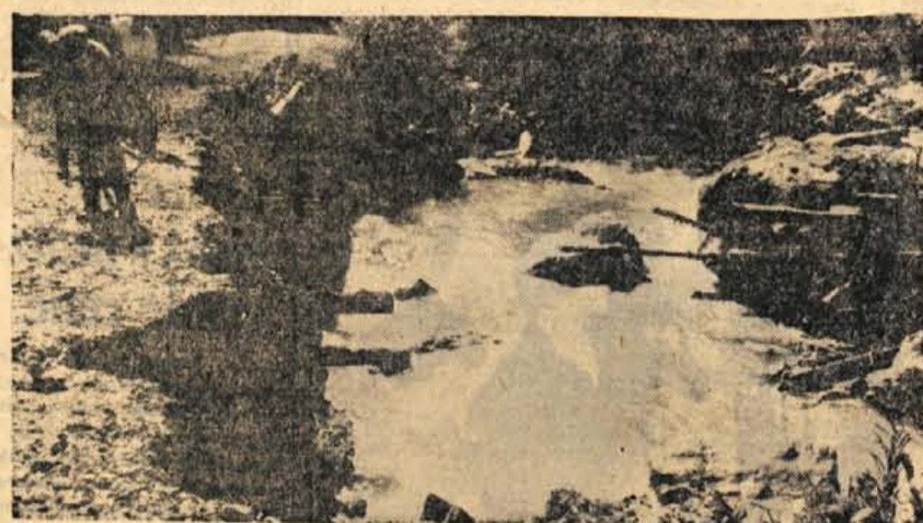
Trziška Bistrica je prejšnji teden po močnih nalivih hudo popokala celino in do dol. Slika prikazuje predel, kjer je narasla voda odnesla jez in izpodkopala cesto, čeprav je bila dobro zgrajena.

Od organizatorjev smo izvedeli, da so za to priložnost pripravili celodnevni progr m.