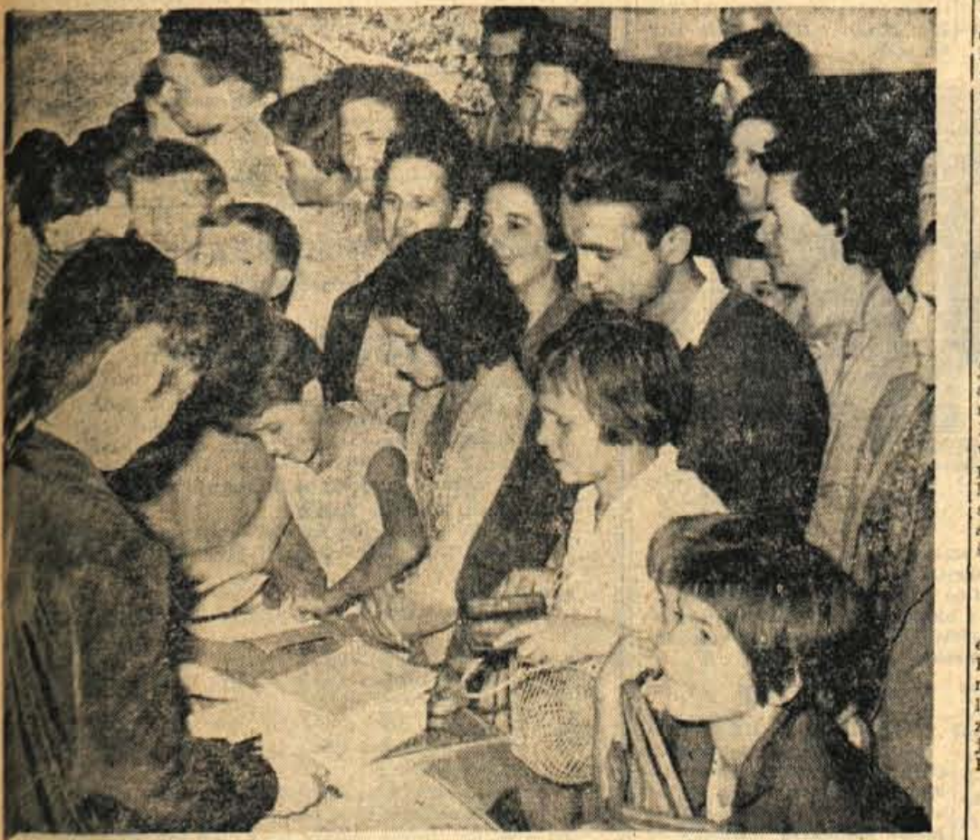
Učenci so se odprla šolska vrata. Naval je bil v naših knjigarnah pred pričetkom šole velik. Otroci so kupovali najrazličnejše šolske potrebščine. Kamera našega fotoreporterja je zabeležila tale prizor v škofjeloški knjigarni, ki so jo odprli pred kratkim. Za popravilo lokala so porabili okoli 6 milijonov dinarjev.