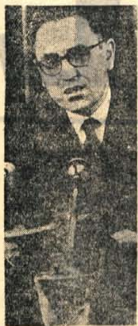
Benbada zaman poziva alžirske voditelje, da pridejo v Alžir

sleherne politične dejavnosti v Alžirskem glavnem mestu in novo razdobje brezvladja je nastalo kot posledica različnih političnih silnic, ki jih zagovarjajo poveljniki nekaterih vilaj in vodilne osebnosti Alžirije. Pravo ozadje je še vedno dovolj neraziskano in nejasno. Gre po vsej verjetnosti za nadaljevanje nasprotij, ki ob pomirnitvi niso bila dobro razčiščenja. Vodstvo dveh vilaj je ob prevzemu oblasti političnega odbora bilo naklonjeno temu sodelovanju in so se vojaki v dveh vi-