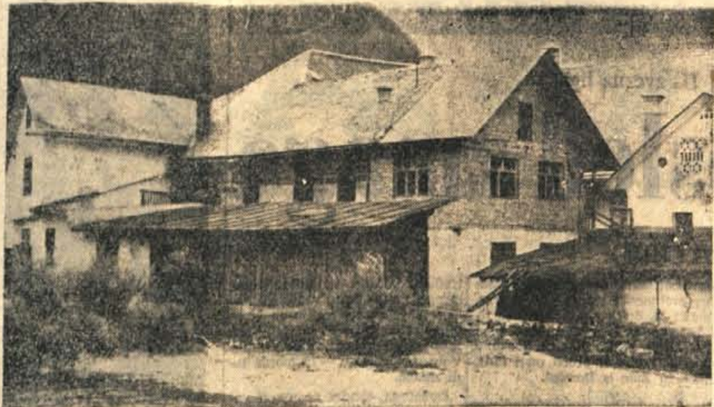
Zdaj v tej stavbi v Zelenikah posluje še podjetje Usnjarna, za katero so odborniki občinskega ljudskega odbora Skofja Loka na zadnji seji sprejeli sklep o likvidaciji. Čez kaka dva meseca pa bodo delo v njej popolnoma prekinili in izpraznili prostore. Kaj bo potem v stavbi, ki jo kaže slika, bomo še poročali

Fižol 130 do 160, ajdova moka 140, ješprenj 100 do 150, kaša 150, krma za kokoši 45, krhlji 100, šahtolka 80, oves 35 za liter; skuta 150 do 160, surovo maslo 880 do 700, čebula 90 do 100, krompir 30 do 40, sladko zelje 60 do 70, zelenata 80 do 100, pesa 50 do 60, zelena paprika 90 do 100, jabolka 50 do 80, hruške 80 do 140, slive 140, bruskeve 120 do 140, cvetača 100, kumare 40 do 60, kumarce 130 do 160, buče 40, stročji fižol 120 do 140, grozdje 200 do 230 za kilogram; jajca 28 do 33, kokoši 600 do 800 za komad, piščanec 400, česen 10 do 50 din, zajci 350 din za komad; korenček 18 do 20 din, peteršilj 10 do 30, zelena 10 do 30 din za šopek; smetana 20 din za merico.