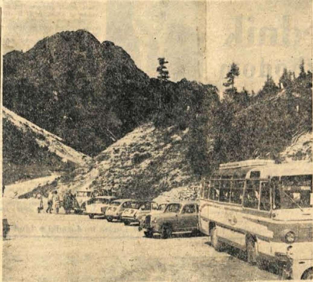
Vršč, začetek septembra — Počitek po naporni vožnji

Vse za zdravstvo občinskega ljudskega odbora Jesenice je o ustanovitvi skupnosti zavarovan- cev za območje obeh občin raz- pravjal in sprejel sklep, da bo ustanovitve predložil na jutrišnji sej. — M. Z.