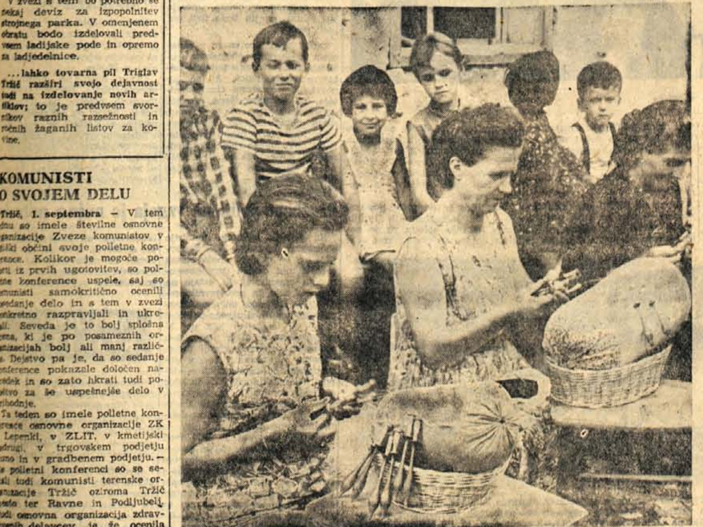
V Selški dolini je še vedno živo klekljarsko delo. Na sliki vidimo klekljarice v Železnikih, ki izdelujejo lone, pričke (ki so iskano narodno-ograsno blago) za ljubljansko podjetje Dom

Ta teden se je komisija za štipendije pri ObLO v Škofji Loki sestala in uskladila dosedanje razlike med višinami posameznih štipendij, ki so bile v preteklih letih dokaj občutne. - Z.