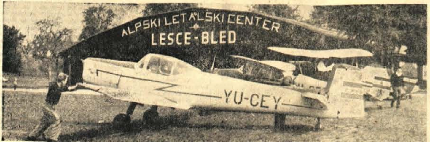
Ze od minule nedelje, ko se je zaključil I. republiški tečaj v padalstvu, so v zraku in na letališču Alpskega letalskega centra v Lescah tekmovanja v okviru VIII. gorenjskega zleta, ki bo jutri slovesno zaključen. Hkrati z razglasitvami najboljših tekmovavcev pa bo jutri uradno zaključena tudi športna letalska sezona. Ob tej priložnosti bodo člani ALC prikazali gledavcem, ki jih bržkone ne bo malo, nekakšen prerez svoje dejavnosti v sezoni. Na sliki: vsakdanji prizor pred hangarjem ALC — St. S.

Magnifico je do sedaj gostoval že v 200 jugoslovanskih krajih, samo letošnje poletje pa je nastopil več kot sedemdesetkrat. — S.