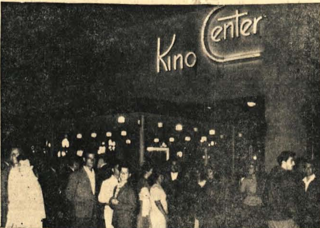
V sredo zvečer pred dvorano kina »Center«

Ali bo današnji koncert Magnifico navdušil poslušavce?