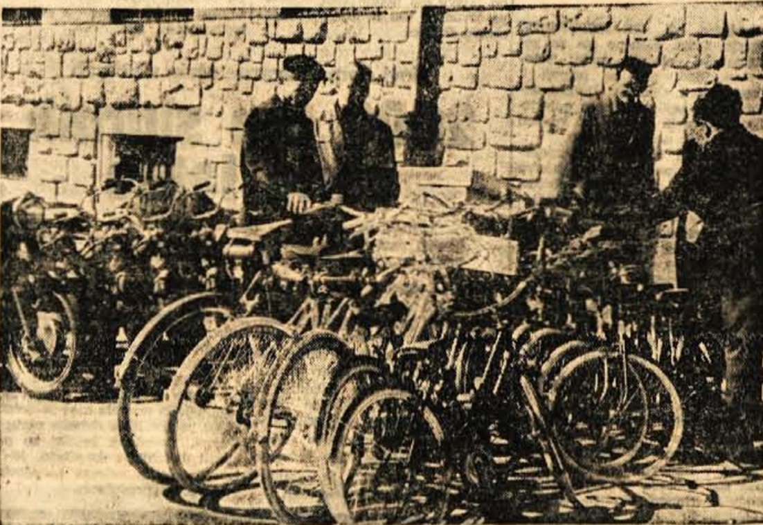
Ljudje kolesa in motorji potrebujejo svoje parkirne prostore.

Na 35. seji KO v Naklem so nad vse živahno razpravljali o znižanju proračunskih sredstev za letošnje leto, saj so se jim sredstva znižala kar za 124.000 dinarjev in bodo morali kar najbolj varčno gospodariti.