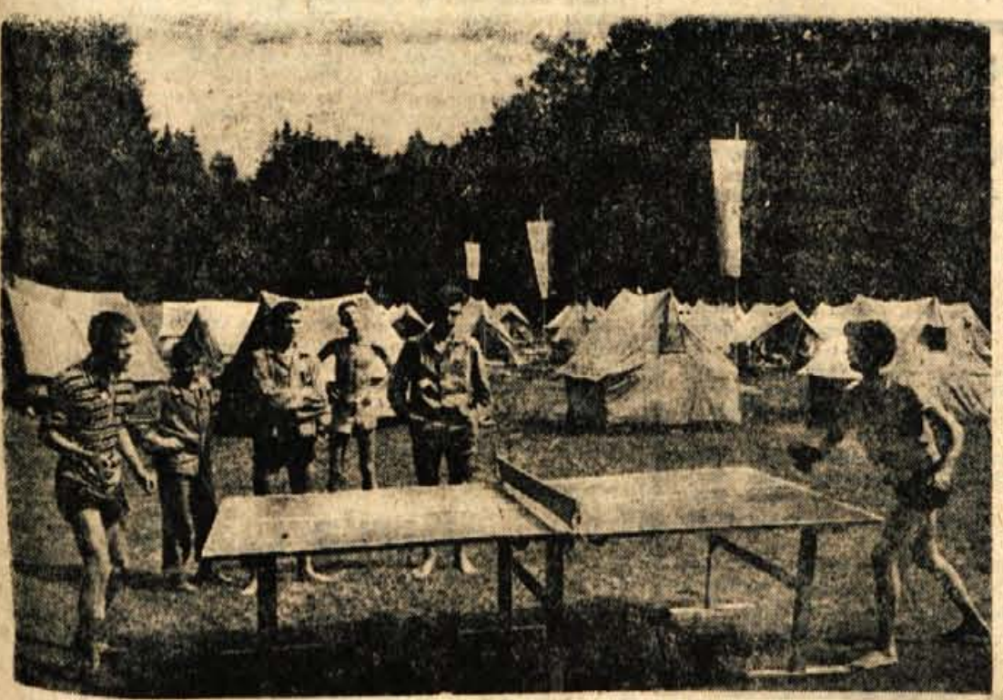
Bratovski občutoma gosteca - brigadirji v Kranju se iskalo zabavalo v vročem času

In moje mnenje! Po mnenjih, ki sem jih shlal v zadnjem času, so v časnikih razmišljanja javna stvar, pri nas je treba operirati z dejstvi. Osebnost se sicer ne strinjам poseam s tem, zato bom tudi zaključil z mislijo. Sodim, da je edini način, da ljudje pribijajo, sodim, da je edini način, da ljudje pripovedujejo o svojih stvarih... in morda bi tovaris Marko včasih tudi moral pomisliti o tem. Premisliti pa tudi o tem, da beseda ni konj. Pa tudi to, da niso ljudje zaradi njega v podjetju, ampak on zaradi ljudi. J. K.