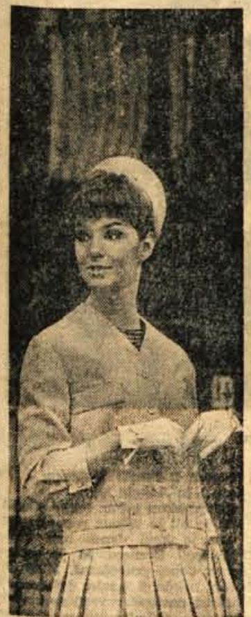
Preprosti detajli: našitki, plise in manšete so pogoj za ljubkost kotima na sliki zgoraj.