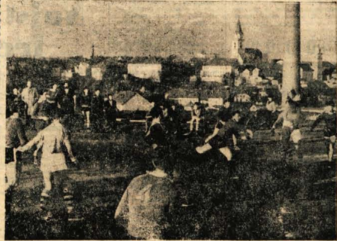
Igralci Mladosti med treningom

Pri domačih sta zlasti ugajala najmlajša Hvastit in Posedi, vtem ko je Poljka tako dobro »stražila« najboljšega slovenskega strelca Papeža, da je le-ta dosegel samo 1 zadetek, pa tudi Poljko so pred