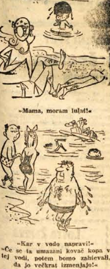
»Mama, moram lutati!«

V letu 1960 so Londončani poza-bili v javnih prometnih prostorih 90.984 dežnikov, 22.000 knjig, 44.000 kovčkov, 11.000 ključev, 80.000 pa-rov rokavic in 12.000 očal. Te šte-vilke potrjujejo, da so Angleži precej raztreseni med vožnjo in čakanjem na prevozna sredstva.