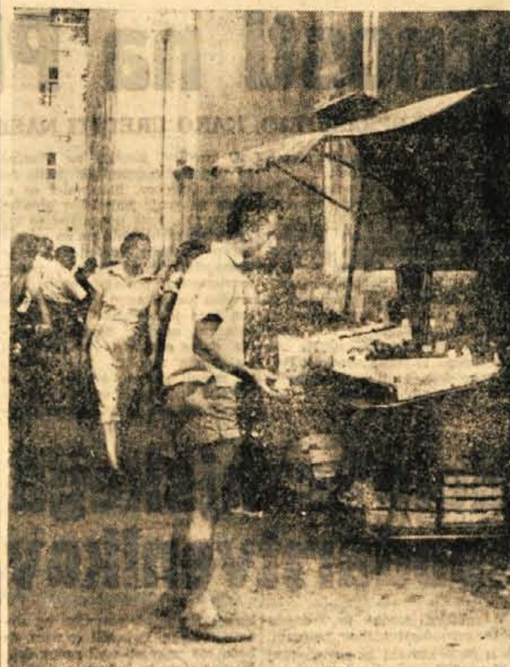
Ze dolgo je tega, kar cerkveni zid v Kranju nudi zavetje vsem listim branjevkam in branjevcem, ki prodajajo tudi takrat, ko ni tržnega dne. Res, da se ne pritožujejo, le takrat, kadar dežuje in sedaj, ko jim hočejo ose pojesti vse sadje, žalostno pogledujejo proti zidu, za katerim bo stala nova tržnica

V Crnomlju bo 19. in 20. avgusta zbor PTT delavcev Slovenije, združen z otvoritvijo prvega novega poštnega postopja na Dolenjskem. Crnomelj - središče Bele krajine, v katerem je bilo zgodovinsko I. zasedanje SNOS, bo sprejel 19. in 20. avgusta poštno, telegrafsko in telefonske delavce iz vseh krajev Slovenije, da skupno z bivšimi borci aktivisti in interniranci ter prebivalstvom Bele krajine proslavi 20. obletnico vstaje jugoslovanskih narodov.