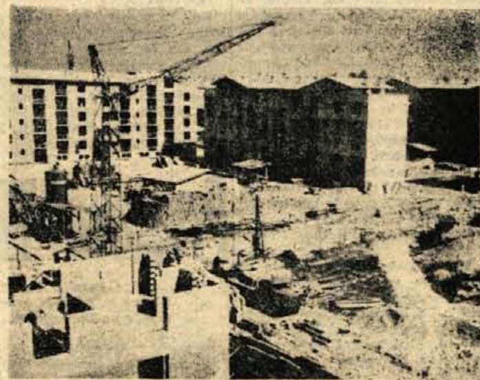
Stanovanjska gradnja v Kranju dobro napreduje.