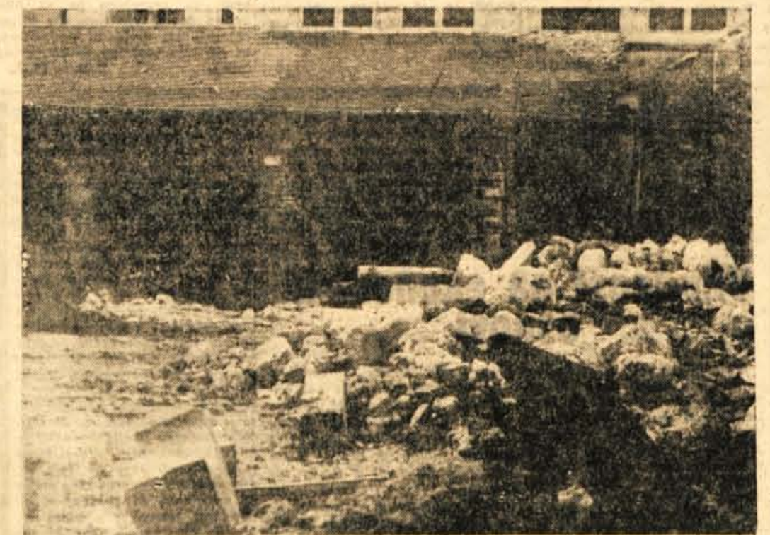
Tale kup kamenja nam res ne obeta nič posebnega, še najmanj pa bi se ob pogledu nanj lahko nadejali, da bo že letos tu stala pokrita tržnica. Vendar so natančno na Zavodu za komunalno izgradnjo pri Obl. G. Kranj povedali, da bo gradbeno podjetje Projekt Kranj že prihodnji teden pričelo z gradnjo tržnice, ki naj bi bila usposobljena že do letošnje jeseni. Zunanji tržni prostori pa naj bi bili urejeni do 1. maja 1952.

- Goetišče na Smarjetni gori se ne more pohvaliti z obiskom med poletnimi meseci. Pravijo, da je vsako leto tako: spomladi in jeseni pa se obisk neprimerno poveča.