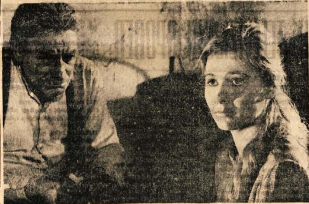
Prizor iz filma »Balada o trobenti in oblaku«

Prav bi bilo, če bi za prvi dan festivala bil lahko prikazan film z