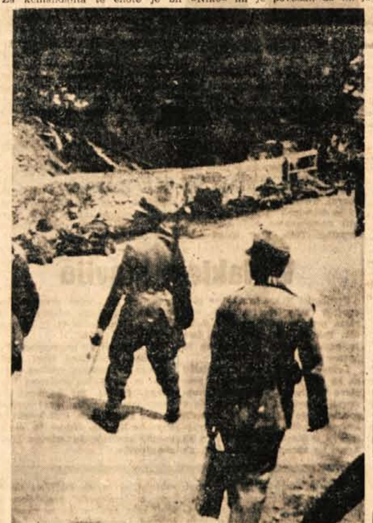
Pred 20. leti, v začetku avgusta 1941. leta so se prve partizanske enote že tako utrdile in usposobile, da so že začele s prvimi akcijami. Minerski vod Jeseniške

doslej že obiskalo okrog 50 tisoč turistov. Čeravno turistična sezona v tem obdobju ni bila takšna, kot so pričakovali, je obisk gradu vendarle dosegel rekord, saj so zabeležili tamkaj za 7 tisoč gostov več kot lani do konca julija. Tu so šteti predvsem tisti gosti, ki so obiskali muzej na gradu, medtem ko je ostalih obiskovalcev se precej več. Samo v juliju si je ogledalo muzejske zanimivosti na blejskem gradu 4 tisoč več ljudi kot lanskega julija. Slabo vreme gostov ne ovira; nasprotno, še rajše pridejo na grad, če ni vročine. Z otvortvijo nove moderne restavracije bo grad spet precej pridobil. Pravzaprav so se dela precej zavlekla. Kot kaže, bo restavracija odprta za obiskovalce 18. avgusta. Oskorbo bo prevzel Gostinski šolski center na Bledu. Kot so povedali, bo v novi restavraciji moč postreči kaskadno gostom hkratno.