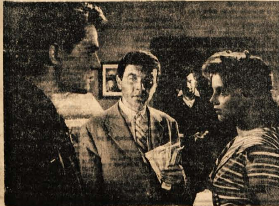
iz filma »Štirinajsti dan«