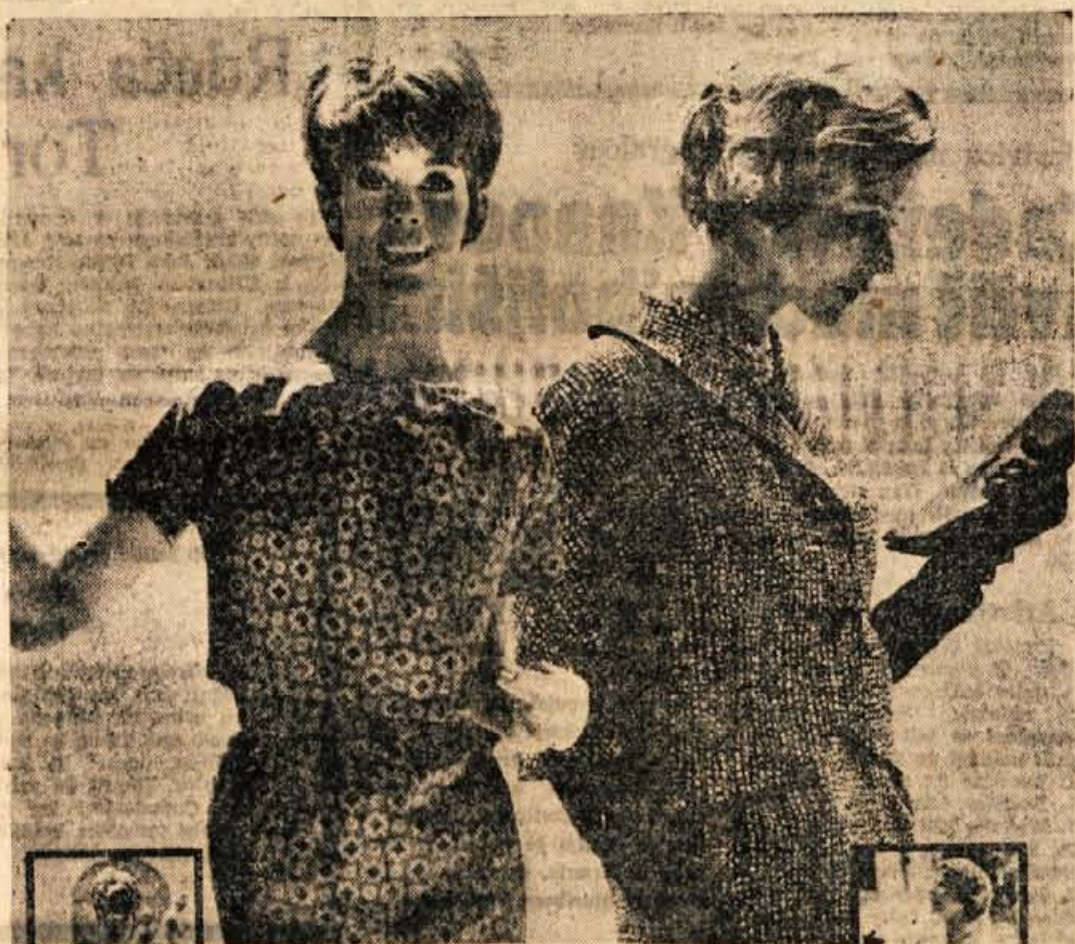
Sredi poletja smo in v modnih časopisih se poleg otek in kompletov za vroče poletne dni pojavljajo sem pa tja tudi modeli za prehodno jesensko obdobje. Tudi na tej sliki vidimo enostavno poletno obleko izvrstne volene svile, ob njej pa lahke komplet iz črnoblega grobo tkanega volnenega blaga — primeren za jesen in za hladnejše poletne večere

vodo pod materinim vodstvom bo otroku ohrabil. Počasi ga obrnite na trebuh in ga tako vozite po vodi. To večkrat ponovite, istočasno pa naj plava z rokami in nogami. Nazadnje ga naučite dihanja v vodi. Najprej ga vadite tako, da bo imel samo usta pod vodo, potem glavo in končno naj se privadi tako imenovanega »tunkanja«. Poučite ga, naj globoko vdihne zrak preden gre pod vodo, potem naj ga počasi izdihava, tako da se vidi v vodni površini nehurčki. Ko ga tako popolnoma odvadimo strahu pred vodo, se bo z lahkoto naučil plavati.