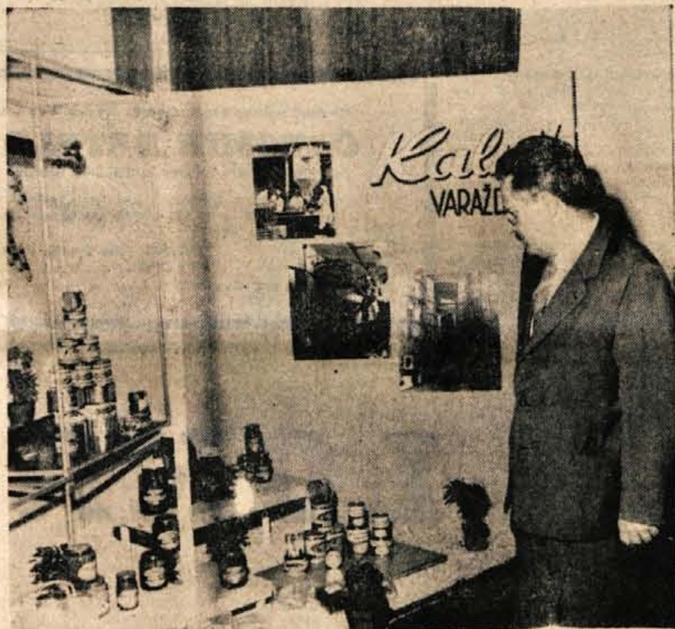
Paviljon industrije konzerv "Kalnik" iz Varaždina, si je na letošnjem Gorenjskem sejmu z zanimanjem ogledal tudi podpredsednik ZIS, tovariš Edvard Kardelj.

"Kalko" ima še druge prednosti. Hitro se da pripraviti in nimamo težav s prenosom. To poceni pijačo so postavili za protitež v borbi zoper alkoholizem.