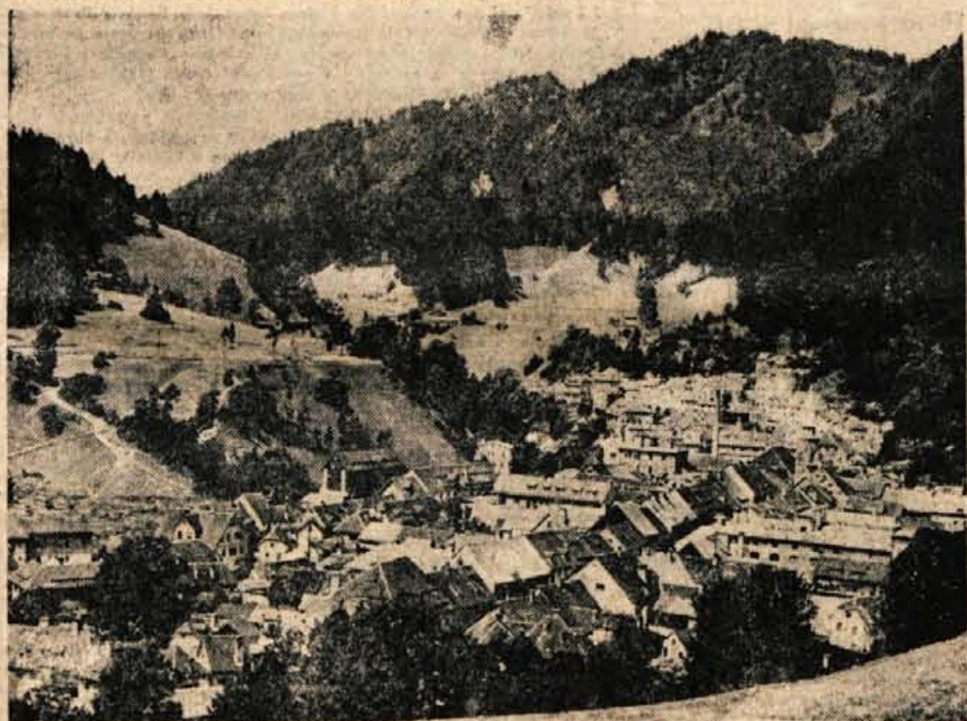
V Tržiču in okolici je te dni praznično razpoloženje

Ob 13.30 uri bo nogometna tekma med prireditelji člani predvojnega naprednega društva «Slovan» in današnjim moštvom Partizana. Ob 15. uri bo kraljeva organizacija razvila svoj prapor, za kar gre zasluga tudi kolektivu Sava iz Kranja. Zatem bo partizansko srečanje in splošno ljudsko veselje.