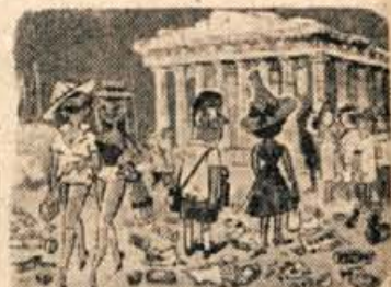
Povsod naletimo na sledove preteklosti. Moj mož si nikoli ne utegne do konca ogledati klasičnih lepot.