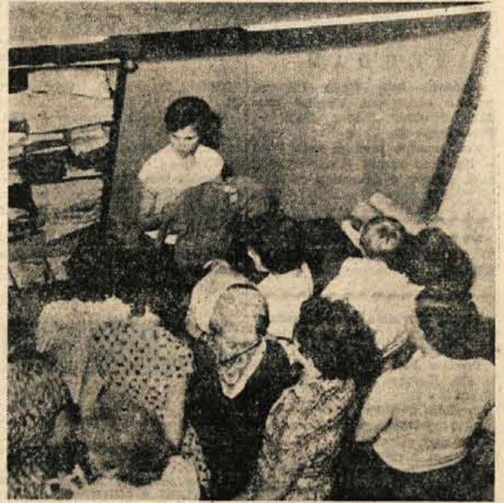
Vsaj za oči je največ zanimanja med ženskami v drugem delu razstavišča, kjer prodajajo tekstil, konfekcijo, pletenine in podobno. Zadovoljni pa so vsi: razstavljalci in prodajalci kot tudi potrošniki