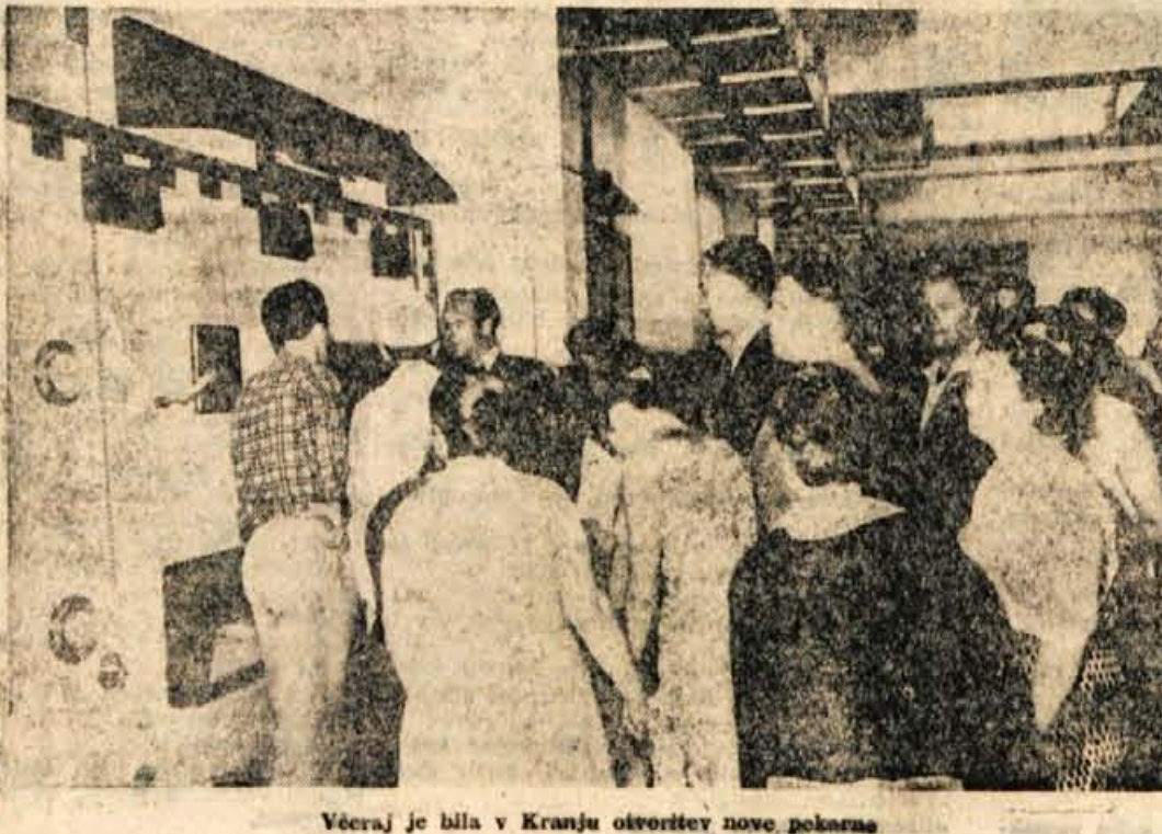
Večera je bila v Kranju otvoritev nove pekarnar

V novi objekti so vložena velika sredstva, zato je naša skupna želja, da bi kolektiv pekarnarstva zares pravilno upravljal in da se bodo na trgu kmalu pokazale ugodne posledice te investicije. Sre je to dokaz, da je bila poraba vložnih sredstev opravičena in koristna in trdno upam, da se bodo naša pričakovanja uresničila. To bo tudi najlepša počastitev današnjega občinskega praznika, ker takšni rezultati najbolj potrjujejo, da vztrajna skrb za delovne ljudi pri nas ni prazna fraza, marveč resnica.« je zaključil tovarniški Sefic. Zatem so si vsi navzoči domačini in gostje ogledali preprosto in proizvodnjo v novi pekarni. M. Z.