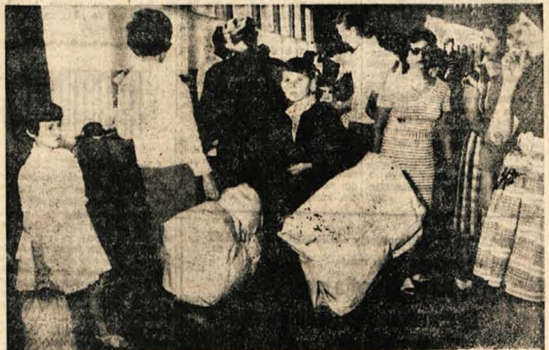
Skoraj vsak nekaj kupi. Nekdo več, drugi manj. Tako veliki paketi, kot jih vidite na sliki, pa letos niso nobena posebnost.

Če po urejene kolone koles, mopedov in motorjev čakajo na kupce. Lani so se ljudje trli za nje, letos pa celo precej znižane cene niso dovolj mikavne. — Največja sprememba zadnjih 365 dni na Gorenjskem sejm