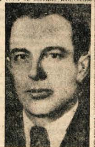
in posvetovanja z aktivisti, ustanovljajal prve odbore OP, jih organizacijsko utrjeval ter povezoval s prvimi partizanskimi enotami. Vsi trije so padli v prvih letih vojne.