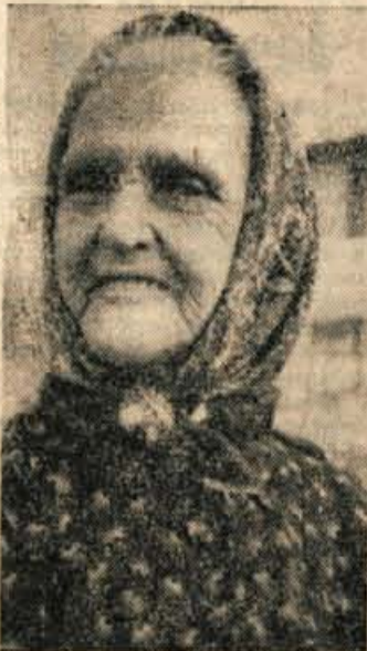
Mamica pod čišnjo — tako so imenovali Erzenovo mamo partizani in kurirji, ki so hodili tam mimo