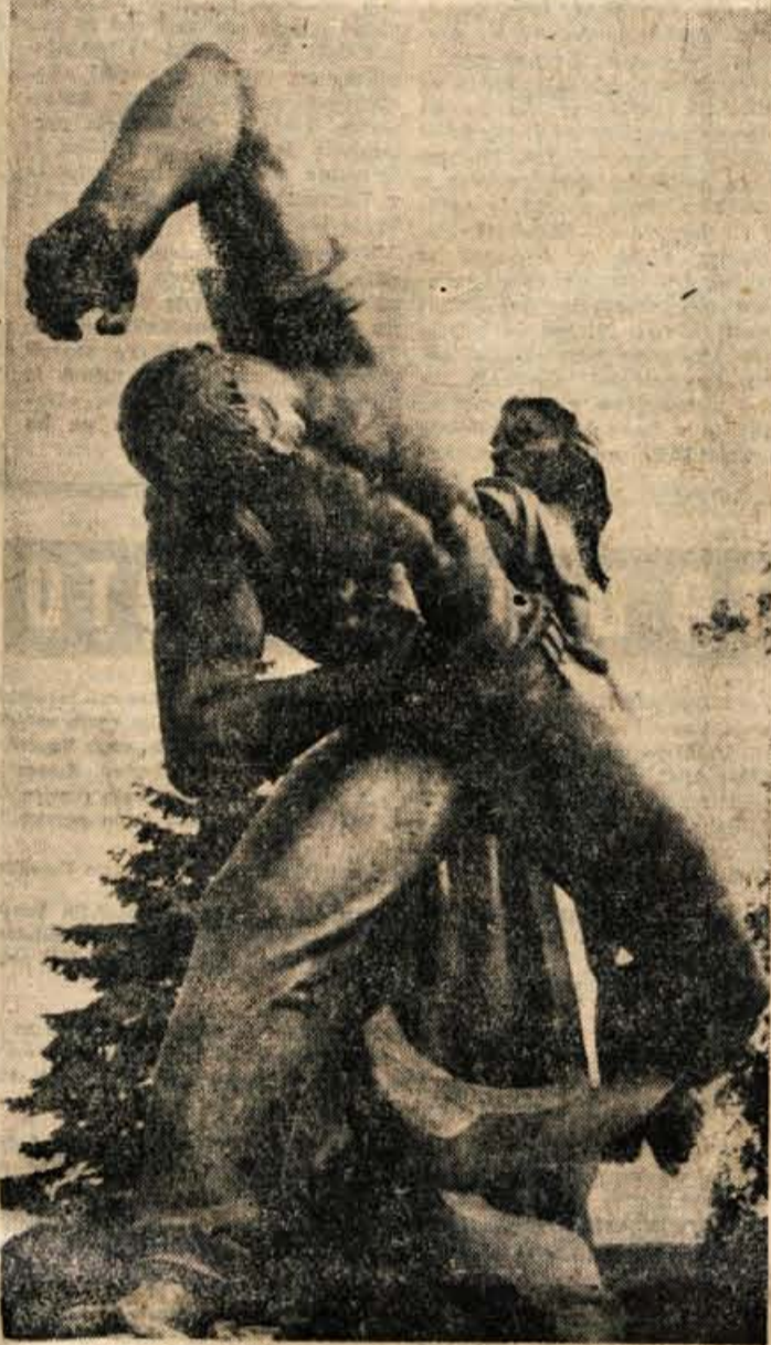
Lojze Dolinar: detajl spomenika Revolucije, ki ga bodo odkrili v Kranju 30. julija

Strel je zamolklo odjeknil med grmovjem pod Šmarno goro. Počilo je! Ne počilo! Prekipelo je bilo tistega dne 22. julija 1941. Nekdanje žrtve Zaloške ceste, iz Ljutomera in Dragatuša, so znova oživele. Potomci krških puntarjev so se združili s stavkujočimi železničarji, tekstilci in delavci. A med njimi so bili voditelji, vzgojitelji iz »političnih šol« Mitrovica, Biliče, Ivanjice... Vsi so »kovali svoja srca« skozi trpljenje, skozi bedo, brezposelnost in zapore. Zato se niso več bali smrti. Odklanjali pa so tako življenje; izkoriščanje, hlapčevstvo in ponižanje.