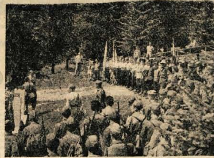
Svečanost na prostem, kjer je bil nekdanji „Lovčev hotel“

tu ni bil brez novega venca. Udeleženci pohoda so se spomnili prav vseh tovarišev – borcev, ki so padli v boju za svobodo. In prva živa ovira! Pred Idrijskim zdraviliščem „Stane Žagar“ Jeseniško-bohinjski odred ni mogel prodreti. Udeležence pohoda so pričakali gostje in domačini s pijačo in jedajo, kot takrat, ko so Bohinj in Bohinje osvobodili partizani. In ko je bilo najlepše razpoloženje, so obveščevalci sporočili: