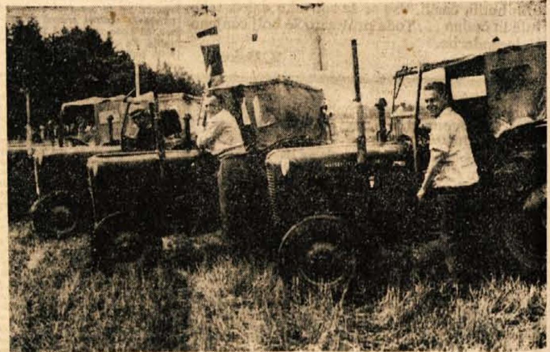
Zgorajnja slika je naš fotografiratelj posnel pred okrajnim traktorskim tekmovanjem, ki je bilo poteklo nedeljo v Senjarju

PREVZGOJA V JUŽNI KOREJI — Vojaška punta v Južni Koreji je izpustila 1293 ljudi, ki so jih aretirali po udaru 16. maja, ker so jih osumili »slepičarske« dejavnosti. Predstavniki juhte je s tem v zvezi izjavil, da so te ljudi izpustili, potem ko so se spoklesali in izrazili pripravljenost, da se posvetijo interesom države. Rekel je, da je v zaporih še 538 političnih osumljenecv.