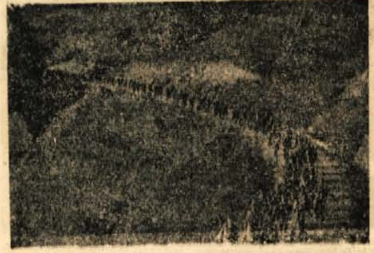
Tretje jutro. Sto kilometrov pohoda bo kmalu za njimi. Dolga kolona Prešernovcev se vije iz Gorj proti Poljanam