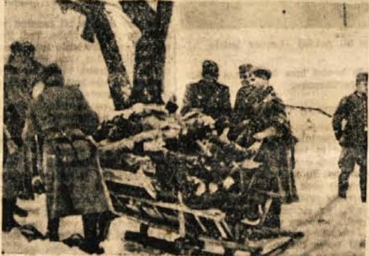
Nemci nakladajo svoje vojake, ki so padli v boju s Cankarjevimi bataljonom v Rovtu, decembra 1941.

Prah se je oprlel obleke in to pomeni, da je bila cesta dolga dva dni. Na vroči julijski pripek. Enota je stala poravnana, kakor telefonski drogovi. Zvočnik je napovedoval, da je na čelu odre-