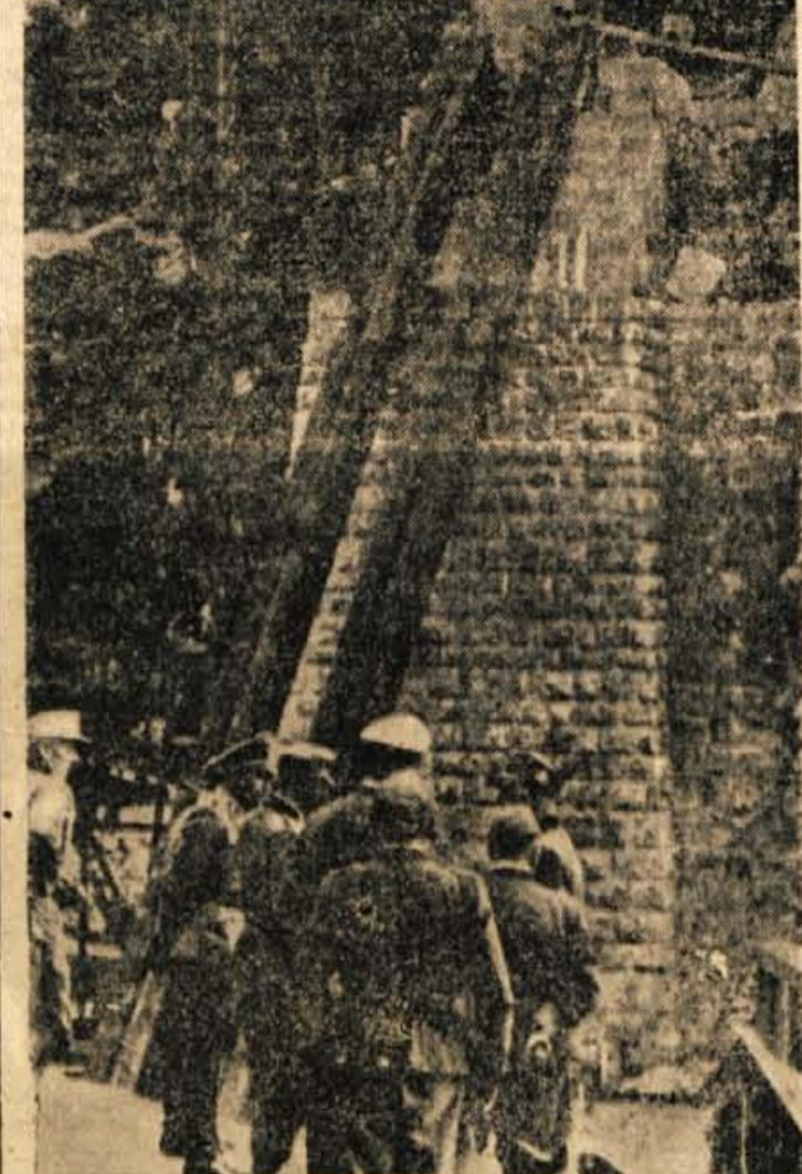
Visoki nemški častniki ogledujejo ostanke železniskega n. v Mostah pri Zirovnici, ki so ga borci Cankarjevega bataljona uničili 30. junija 1942. leta. Cankarjev bataljon je imel takrat 130 borcev. Iz maščevanja so Nemci sicer postrelili tamkaj 29 talcev, toda moči partizanskih enot in osvobodilnega gibanja niso mogli zatreti

VDV bataljon je odšel istega jutra iz Radovljice. V Lipnici so se ob zvočnih godbe na pihala srečali z borci Cankarjevega bataljona. Od te vasi pa so odti naprej z združenimi močmi. Kolona je bila sodaj dolga in na mestih se je raztegnila kot repelka kača. Raz-