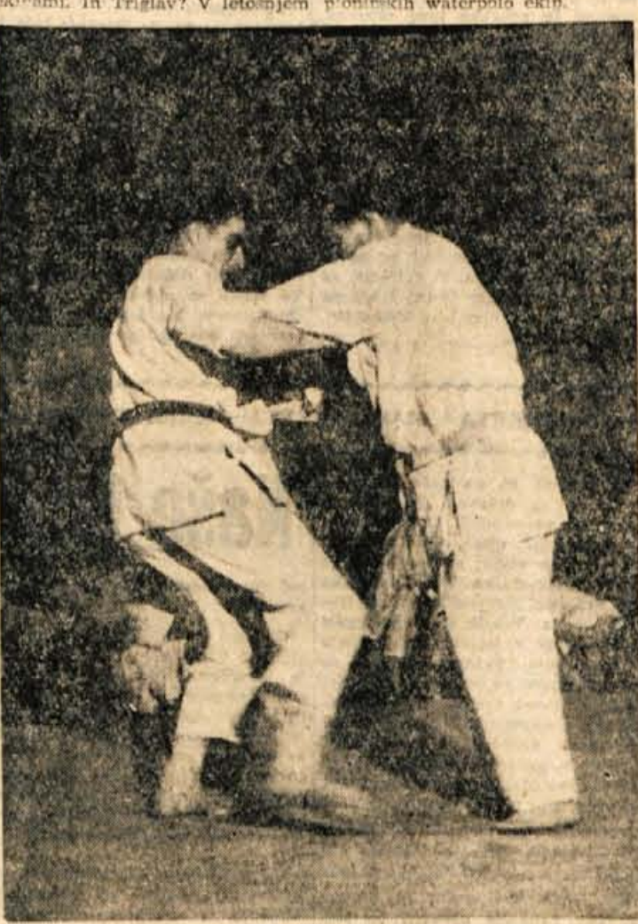
Stare (desno) je bil največkrat zmagovalec