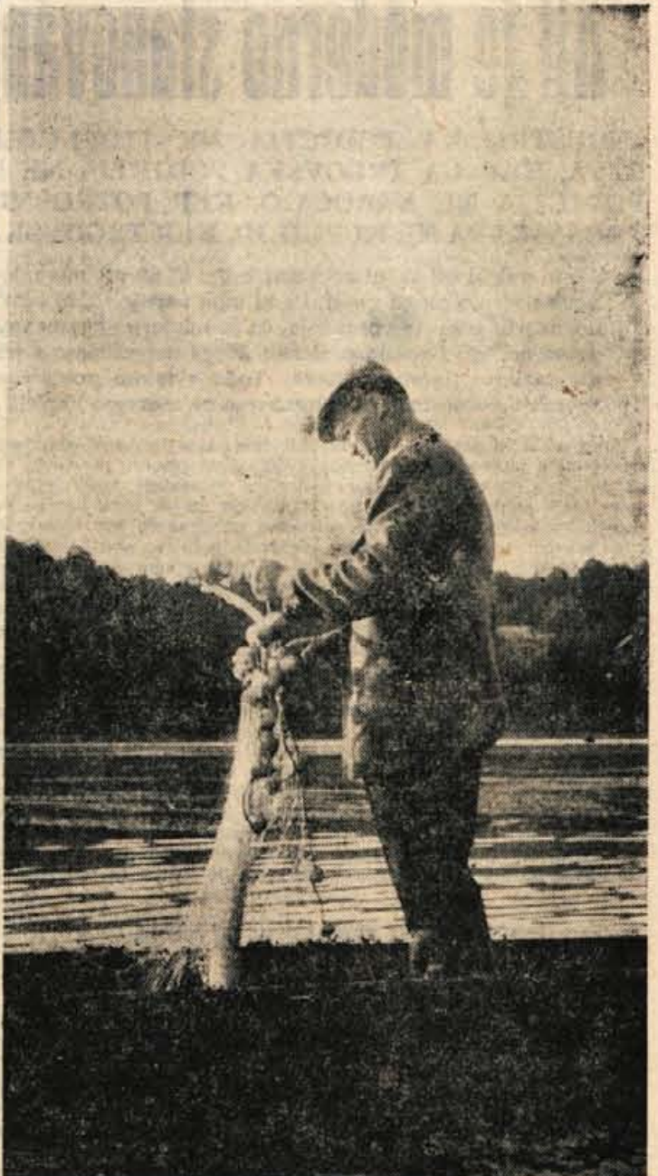
Takole polagajo tanko mrežo v vodo. Kroglice ob vrhu mreže so napolnjene z zrakov, tako da ob obteženju mreže ne potonejo