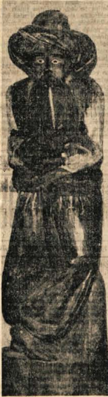
Soha »Turka« kot panj (star 120 let iz Brnikov)

Razstavljene predmeti v muzeju so res nekaj odmetvenega, značilnega za Slovenijo ne samo glede čebelarstva, temveč za zgodovino Slovencev nasploh. Številne panjske končnice, čeprav so stare tudi več desetletij ali celo stoletje, so kot najčudovitejša in naj-