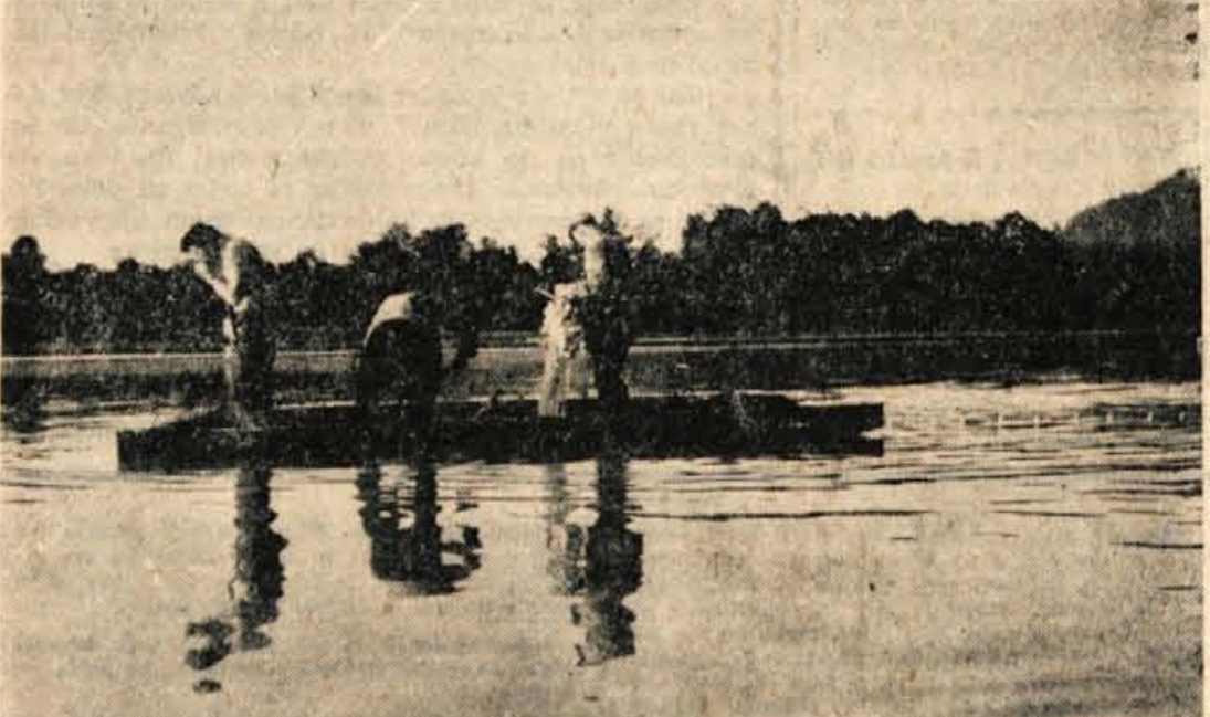
Mreža čaka na ribe...

SENCUR — V sredo popoldne je bila v Kranju razširjena seja kmetijsko-tehnične komisije pri OOLT Kranj, ki so ji prisostvovali tudi zastopniki Kmetijskega posestva iz Šenčurja, Zbornice za kmetijstvo in gozdarstvo okraja Kranj, Društva traktoristov in kmetijskih strojnikov Kranj, člani OOLT Kranj in drugi. Razpravljali so o okrajnem tekmovanju traktoristov in kmetijskih strojnikov, ki bo v nedeljo dopoldne na zemljišču posestva v Šenčurju. Po prijavah, ki so jih prejeli, so ugotovili, da se bo letošnjega tekmovanja udeležilo precej večje število traktoristov, kakor prejšnjega leta. Tekmovali bodo člani, mladinci in pionirji in to v treh disciplinah: v oranju, spretnostni vožnji in teoriji. Borba za prva mesta bo letop precej bolj zanimiva kakor je bila prejšnja leta in to predvsem zato, ker se število traktoristov, z ozirom na vedno večjo mehanizacijo v kmetijstvu, vedno bolj množi, prav tako se boljša tudi kvaliteta dela. Zmagovalci bodo prejeli več pokalov, diplom, pla-