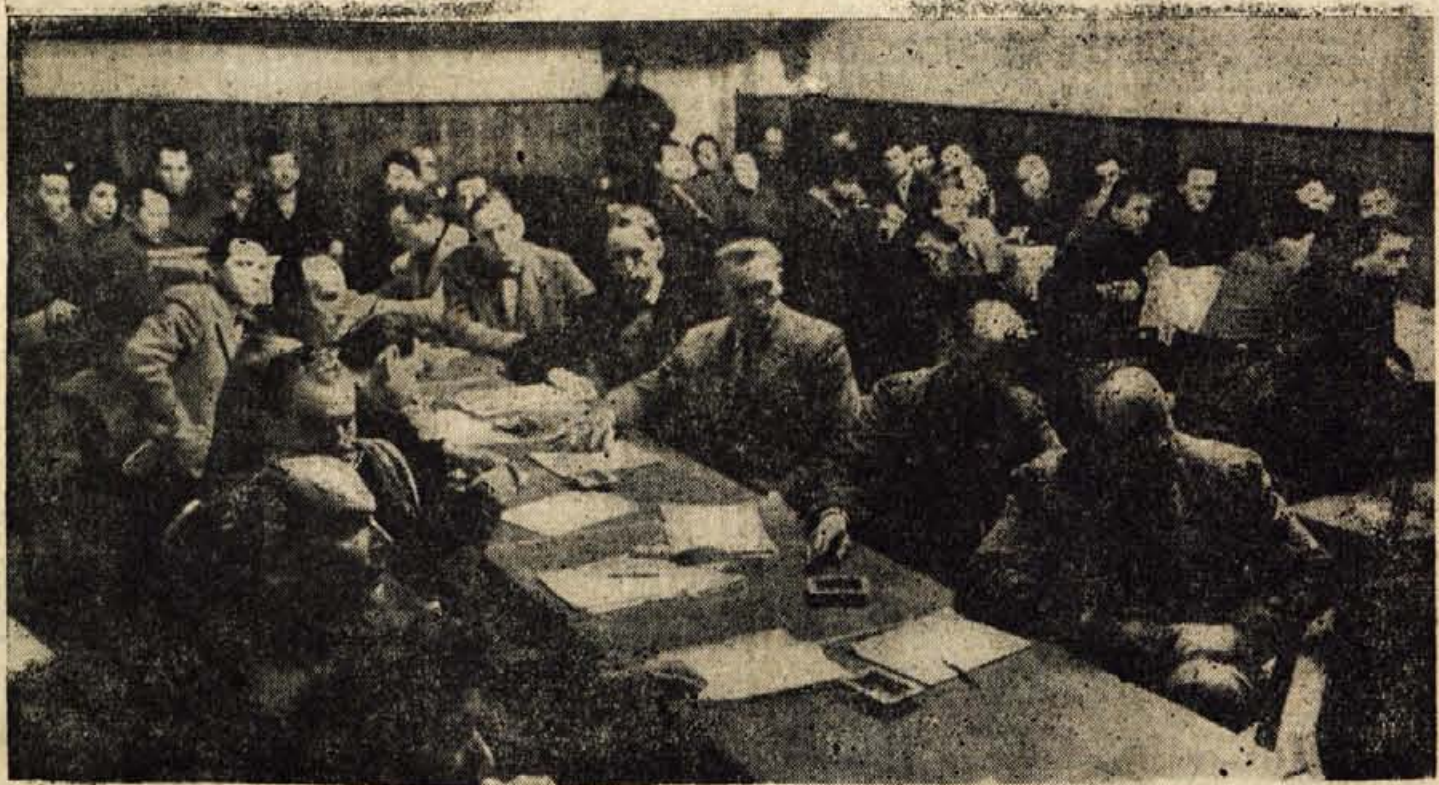
ODBORNICI OBČINSKEGA LJUDSKEGA ODBORA JESENICE NA PONEDELJKOVI SKUPNI SEJI

GLASILO SOCIALISTIČNE ZVEZE DELOVNEGA LJUDSTVA ZA GORENJSKO