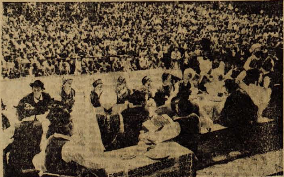
Med vsemi večerajšnjimi izletniki v Bohinju je bilo, razumljivo, največje zanimanje za 'Kmečke ofceti'...