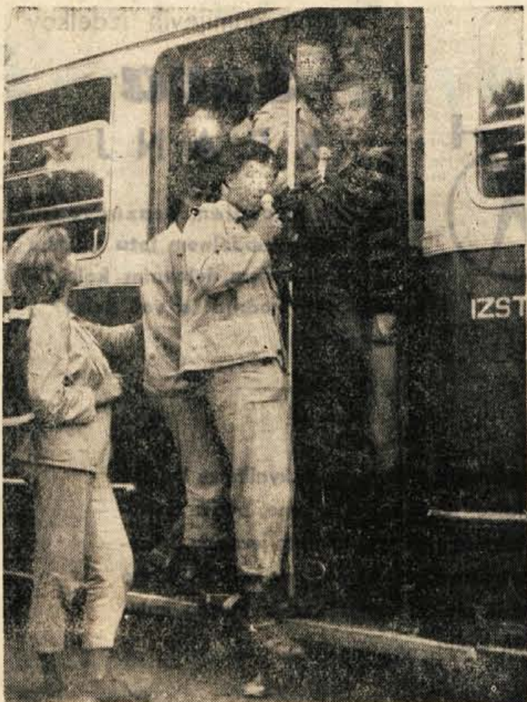
Razen rednih prometnih avtobusnih prevozov vam Avtopromet iz Kranja zagotovi tudi udobne posebne skupinske prevoze

Ob hitrem razvoju motorizacije na naših cestah