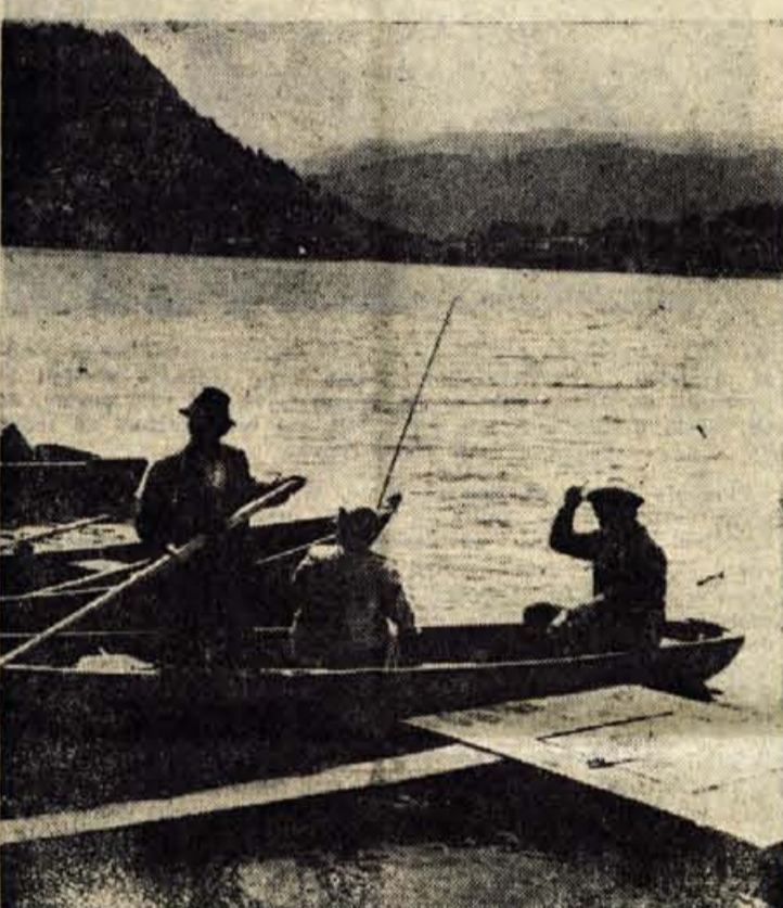
Bled, 18. junija - Danes je bilo na Bledu mednarodno tekmovalje v lovu rib. Udeležilo se ga je 147 tekmovalcev iz 38 ribiških drušin, in sicer največ iz Slovenije. Te vrste tekmovalje je že desetletno zapored in postaja tradicionalna in zelo priljubljena športna prireditve na Bledu ter je tudi po številu udeležencev največja tovrstna prireditve v Jugoslaviji.