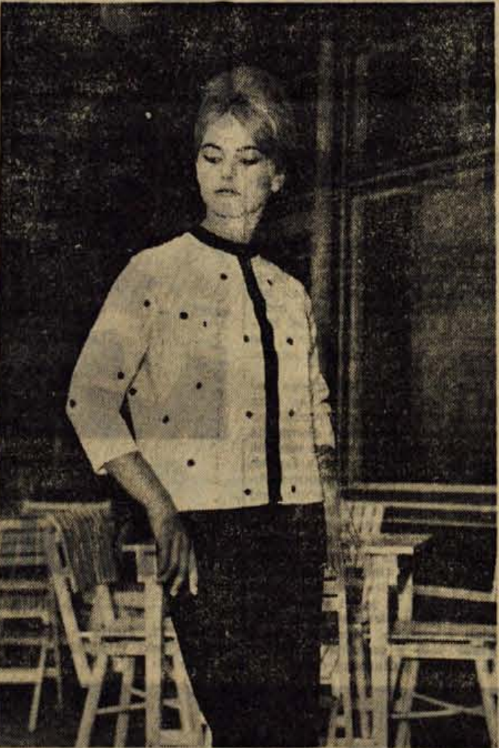
Radovljica, 18. junija - Včeraj je bila v Radovljici uspela modna revija, ki jo je pripravila Alpska modna industrija Almira. Za revijo, na kateri so gledalci lahko videli 112 modelov, je značilno, da so bili na njej prikazani le tisti izdelki, ki jih bodo v Almiri izdelovali serijsko. Torej - nič več izdelovanja ekskluzivnih modelov, ki pridejo v poštev skorajda samo na reviji; vsi modeli bodo po pristopnih cenah naprodaj. Pri reviji, ki jo bodo danes zvečer ponovili še v Kazini na Bledu, sodelujejo še podjetja: Volna-Laško, Sešir-Skofja Loka in Plavnika-Kranj

S starimi tablicami bodo lastniki motornih vozil lahko vozili do 31. julija, vendar moramo opozoriti, da bodo za zamudnike izdatki večji. Nova vozila bodo z novimi tablicami registrirali od 20. junija naprej vsa Tajništva za notranje zadeve Občinskih ljudskih odborov, ki imajo že nove tablice. Za motorna kolesa pa bodo tehnični pregledi in registracija naknadno določeni.