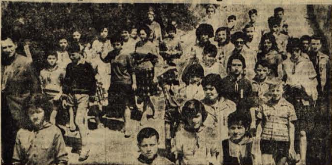
Beograjski pionirji v Kranju