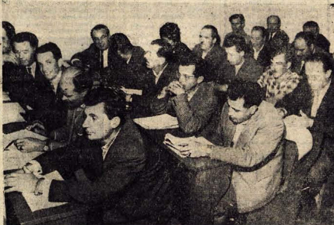
S skupnega plenuma predsedstva Obo SZDL in ObSS Tržič

Tako kot sredina, je tudi včerajšnja razprava pokazala, da so gospodarske organizacije v tržički komunni in tudi drugod, doslej obravnavale obratna sredstva kot postranski problem, ki pa se je prav z uveljavitvijo novih ukrepov v gospodarstvu pokazal kot osrednji problem v nadaljnjem gospodarjenju. Razveseljivo pa je,