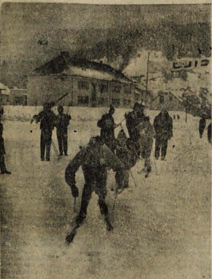
DVOJNI USPEH: mladinci iz Gorij so bili najboljši v soboto v Bohinjski Bistrici in včeraj v Železnikih

GLASILO SOCIALISTIČNE ZVEZE DELOVNEGA LJUDSTVA ZA GORENJSKO