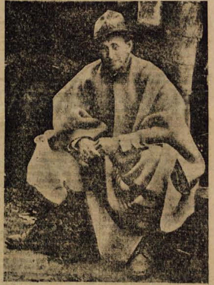
EICHMANN kot »organizator« firme »CAPRI«