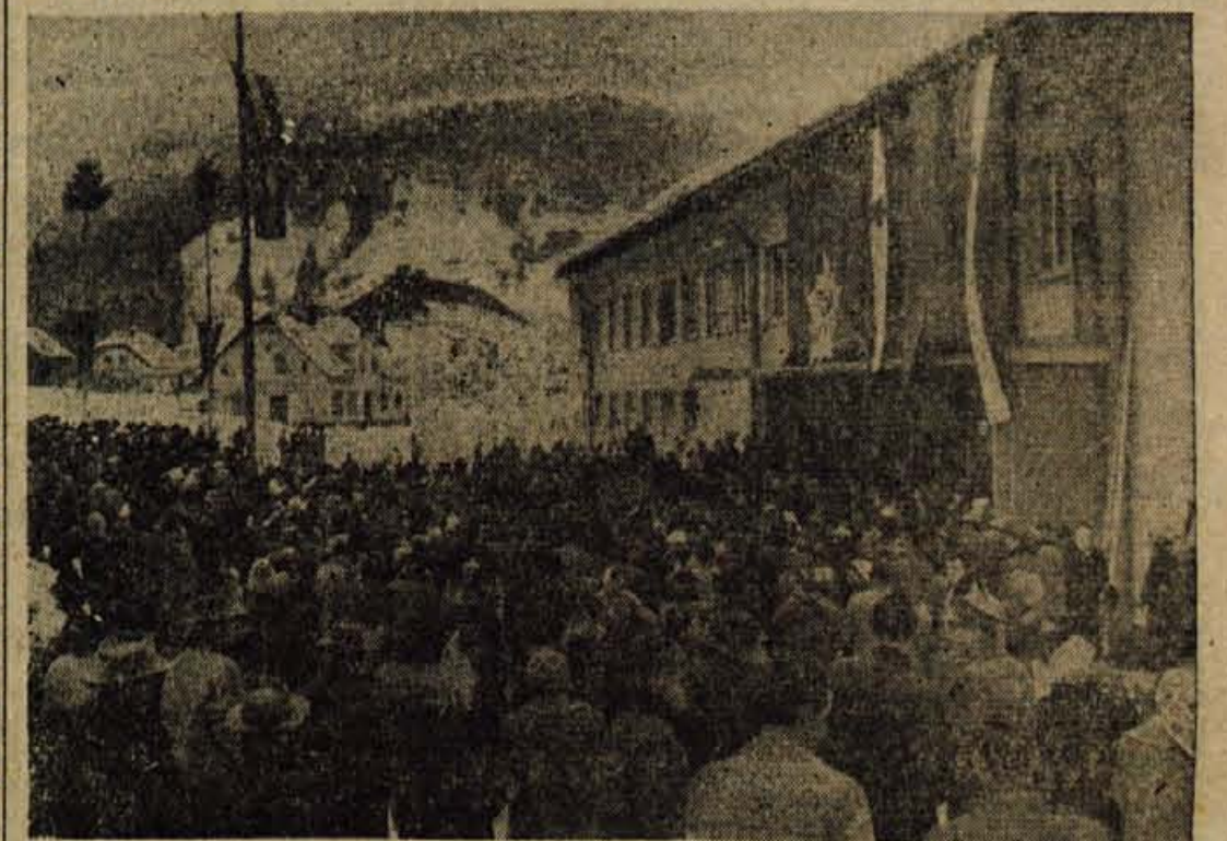
Na včerajšnji osrednji in hkrati zaključni proslavi letošnje prireditelj "Po stezah partizanske Jelovice" v Železnikih je bilo več tisoč udeležencev

Odstotek čistega osebnega dohodka napram celotnemu dohodku pa ni tako naraščal, kakor smo videli pri skladih. V glavnem je odstotek ostal na isti ravni, kar ni zadovoljivo in ni niti v skladu s smernicami perspektivnega plana. Celotna industrija je v letu 1956 porabila za čiste osebne dohodke 5,1 odstotka celotnega dohodka, lani in letos pa 7,5 odstotka. To, da se ne predvideva povečanje udeležbe čistih dohodkov v celotnem dohodku ni nikakor razveseljiv pojav. Vsi namreč vemo, da stremimo za tem, da povečamo osebne dohodke. Drži, da se bo s povečanjem celotnega dohodka sorazmerno povečal tudi del osebnih dohodkov, vendar smo lahko prepričani, da takšno povečanje osebnih dohodkov ne bo zadostovalo. Primerno bi bilo najti neko novo obliko, po kateri bi se lahko dodelili večji del celotnega dohodka za osebne dohodke.