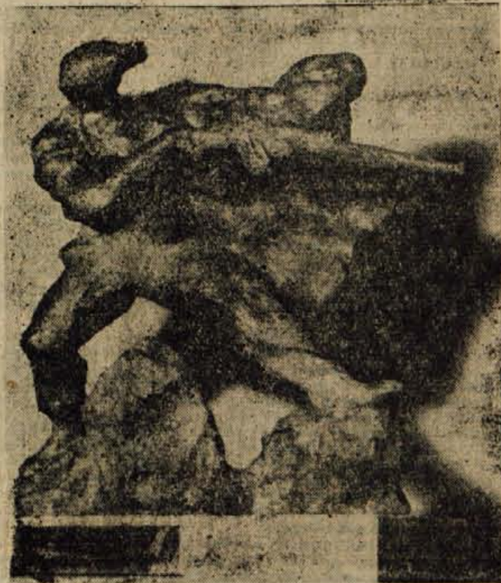
Kip bora (na sliki), ki ga je izdelal kipar Franc Smerdu, bo prva nagrada na smučarskih in sankarskih tekmah v Železnikih. Od okrajnega odbora Zveze borcev ga bo prejela vprehodno darilo najboljša na 15 km dolgi progi

otrok, kadar jih rešujejo skupaj z očetovskimi in razveznimi spori. Poleg tega pa rešujejo okrožna so-