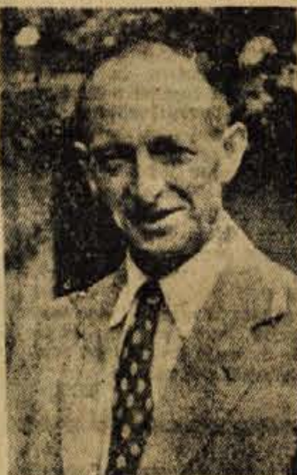
Eichmann mesec dni pred aretacijo v Argentini